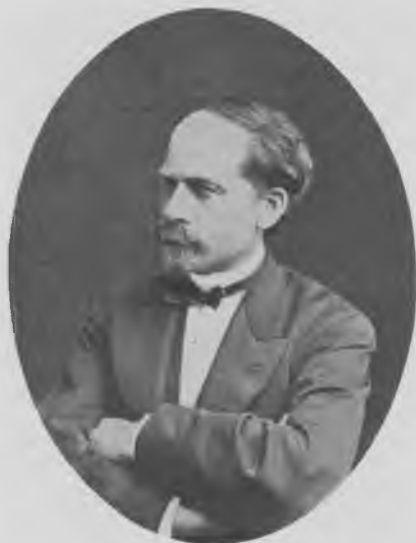
F. Meldahl.

hjelpehospital for epidemihospitalet, og indtil Øresundshospitalet ved slutningen af 1800-tallet omdannedes til tuberkulosehospital, var det dels karantænehospital, dels reservehospital for de øvrige hospitaler, især Blegdamshospitalet. 46