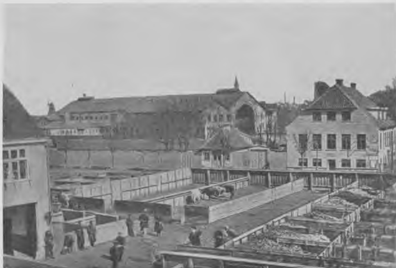
Kvægtorvet. I baggrunden den gamle banegård.