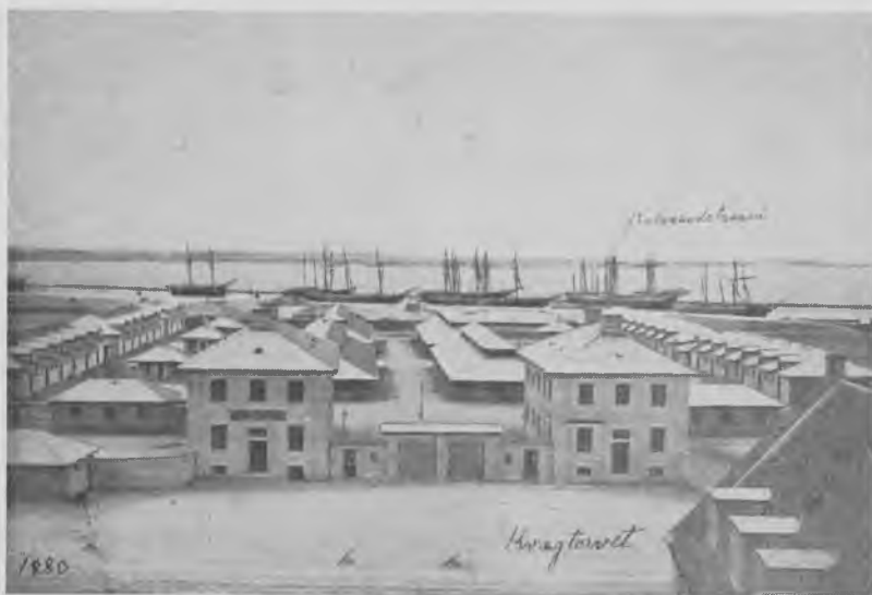
Kvægtorvet 1880.

Krieger: »Qvægtorvet er nu færdigt, nemlig Betænkningen derover, og jeg troer at Forslaget er ret tilfredsstillende, efterat det har styrket sig med en rolig Søvn i 6 Maaneder i Ehlers' Pult.«