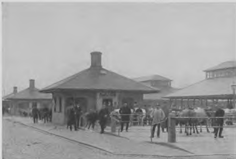
Vejerbod på Kvægtorvet.