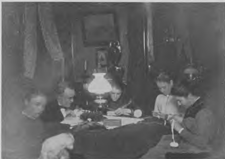
Familien Hindenburg i dagligstuen

Lejlighedens sidste og mindste, men for mig meget interessante rum var spisekammeret, der lå mellem køkken og pigeværelse, en lille enfagsstue med bugnende hylder fra loft til gulv og arbejdsbord ved vinduet. På gulvet stod de største og tungeste krukker med syltetøj: blommer, pærer, asier og agurker m.m. samt store halmomspundne glasbidons med ægte olivenolie, som min mor forskrev direkte fra Algier. Solbærrommen, som fabrikeredes i sommerferien på landet, lå også her på hedvinsankre og lagrede.