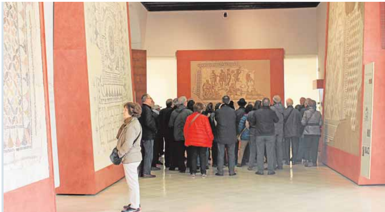
El museo acoge una espléndida muestra de mosaicos romanos llamativamente conservados