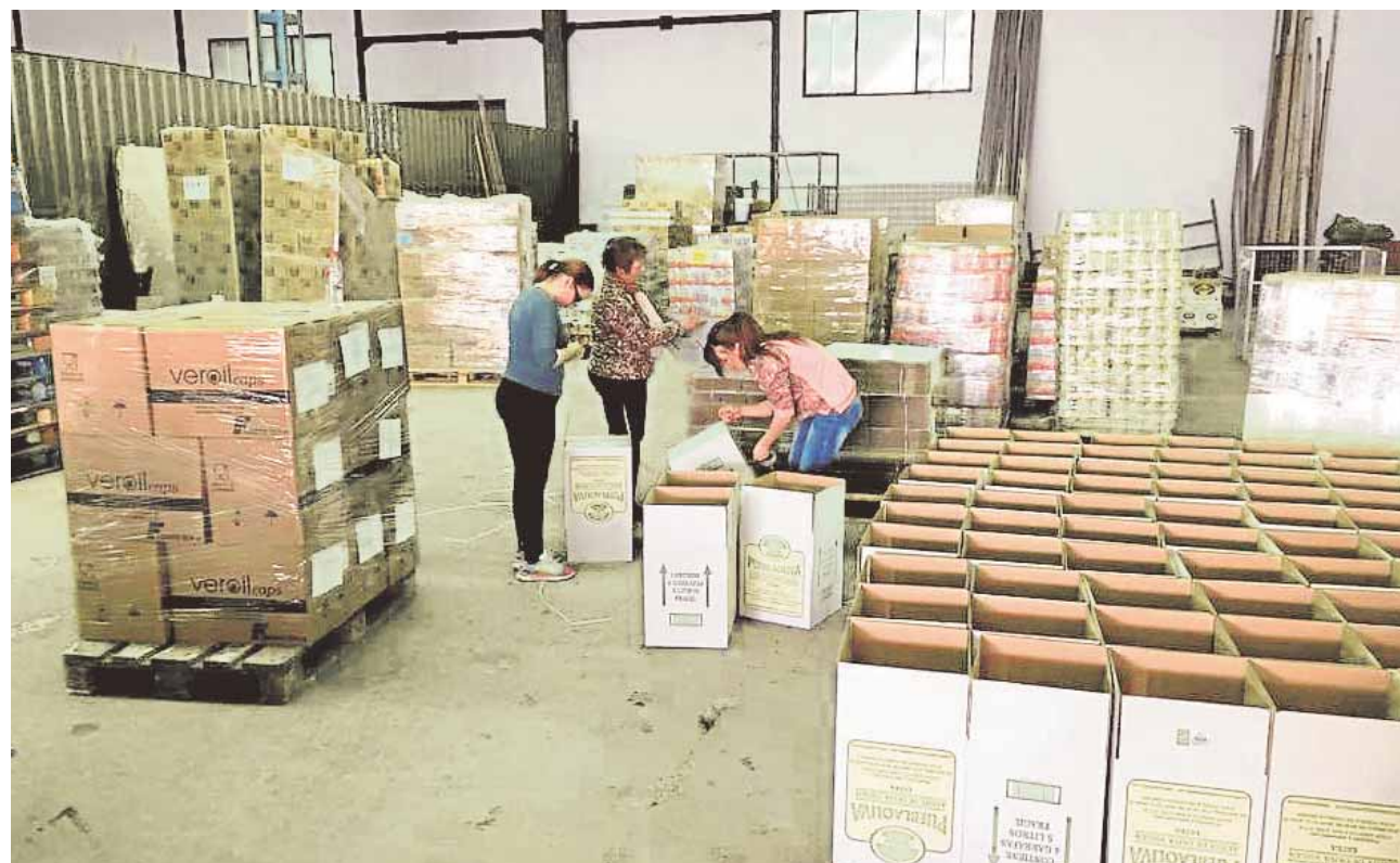
Algunas voluntarias colaboran empaquetando productos

Se trata, al fin y al cabo, de la demostración de la cara positiva que traen estas situaciones: la respuesta más humanitaria de los ciudadanos ante el sufrimiento de sus semejantes.