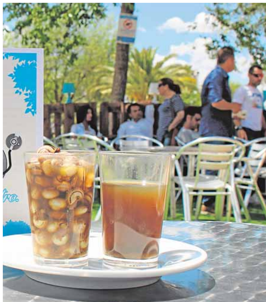
Los caracoles se sirven en un vaso de caña en la localidad palaciega