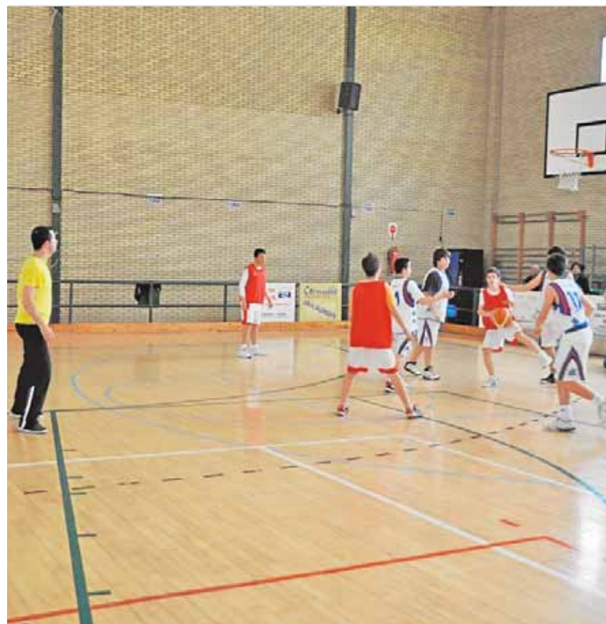
El pabellón Andrés Jiménez presenta problemas en sus cubiertas

Por otro lado, el Ayuntamiento ha diseñado un plan de asfaltado y mejora de calles que ya está aprobado por el Pleno y en el que se incluye el arreglo de las calles Avenida de la Estación, Nuestra Señora de los Dolores, Benito Pérez Galdós, Alcores, Alameda, Julio Romero de Torres, Avenida Doctor Villa Díaz, Bonifacio IV junto al instituto El Arrabal, Anfiteatro