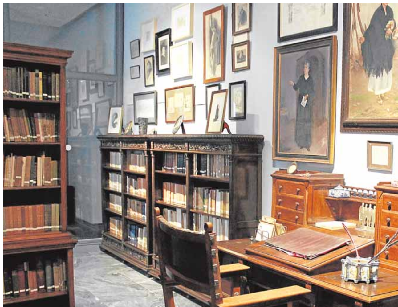
Una imagen de una estancia del museo que conserva los objetos más queridos por los Álvarez Quintero

do un total de 670 jóvenes deportistas. El acto de cierre de la temporada se ha desarrollado en el pabellón municipal. Los participantes recibieron un cuadro con la foto de su equipo tras el desarrollo de los diferentes exhibiciones. A.H.