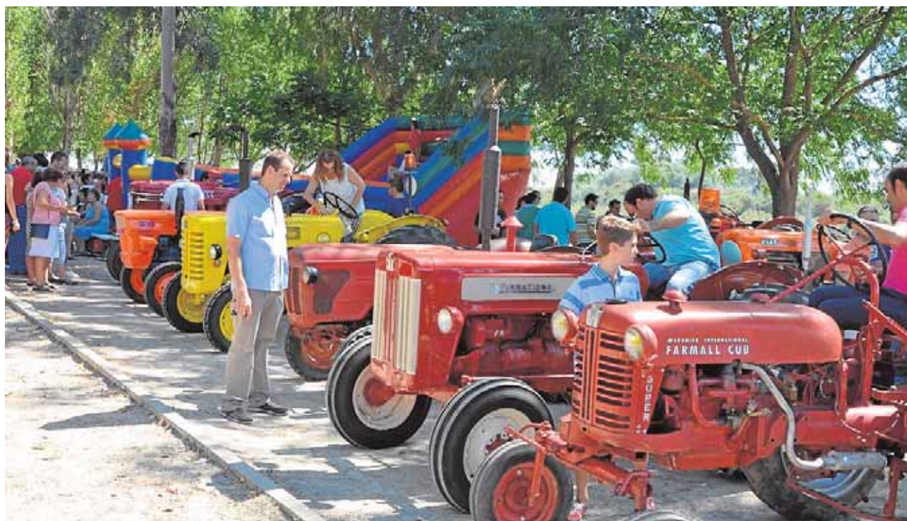
Los miembros de la asociación ceden sus tractores históricos para ferias y exposiciones

pera IV promovido por la Diputación. El gasto total asciende a 219.271,08 euros que se destinarán al arreglo del Callejón de la Prensa y el de El Chorrillo, la continuación del acerado de la Carretera del Judío y el arreglo de la piscina. G.J.L.