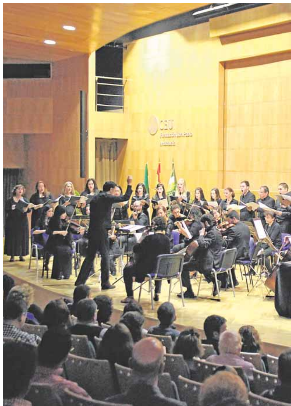
Actuación de la Orquesta de Cámara de Bormujos, el pasado sábado en el CEU San

«La OCB es consciente que allá donde vaya estará mostrando la marca de Bormujos. El lema de la OCB es que cada concierto debe sonar siempre mejor que el anterior», comenta el Al-