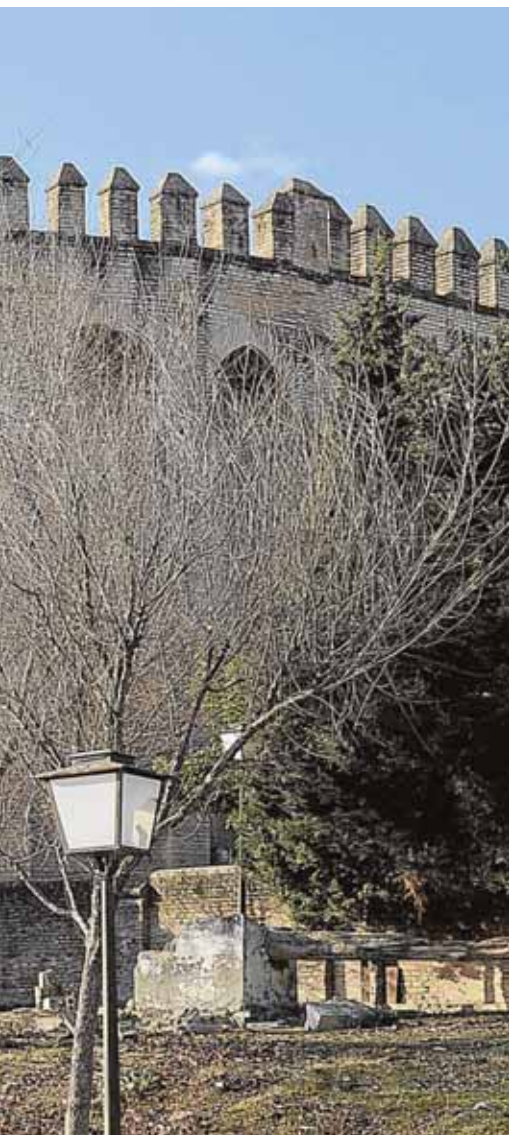
parte de ningún circuito turístico