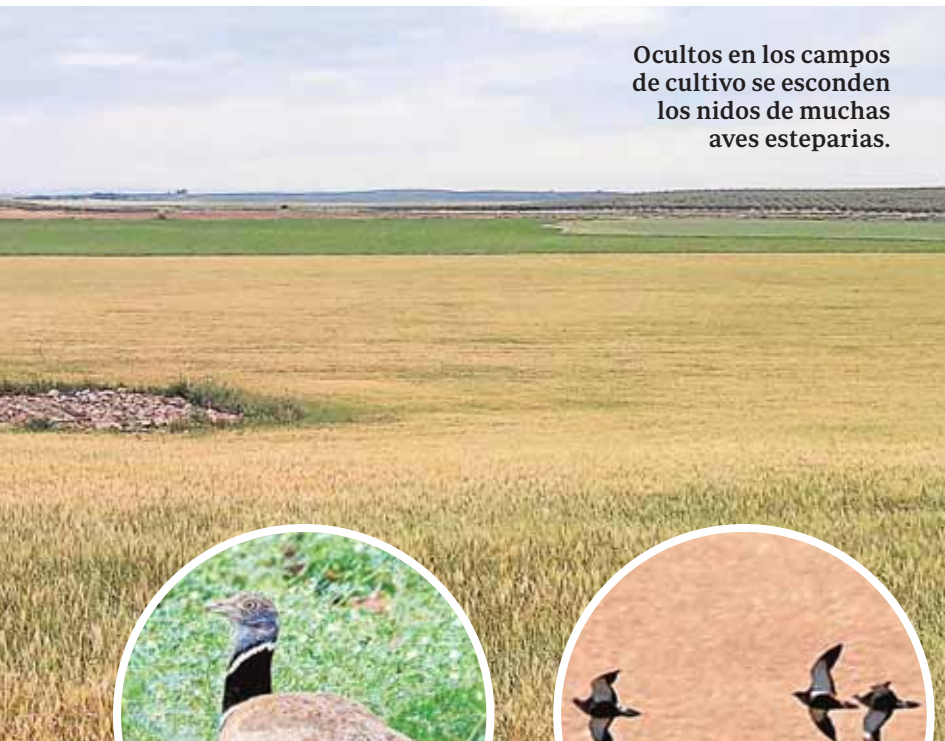
Ocultos en los campos de cultivo se esconden los nidos de muchas aves esteparias.

na miércoles hasta el domingo 22 de mayo se realizarán seis conferencias y una mesa de trabajo. Como actividades paralelas habrá una exposición de Carteles de la Guerra civil española, la proyección de un documental y una obra de teatro. B.M.