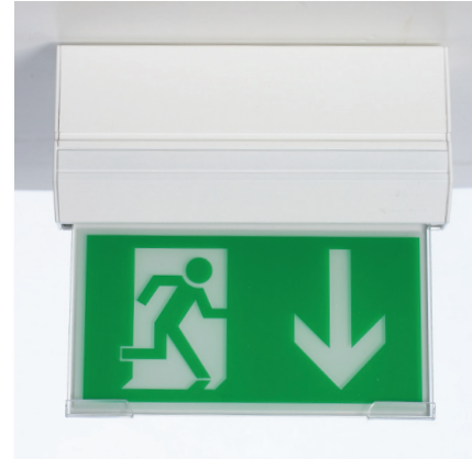
E-learning ger kunskap om hur du vid fara utrymmer på ett så säkert sätt som möjligt.

E-learning ger kunskap och information som behövs för att kunna agera rätt i olika situationer. Personalens kunskaper om brand är otroligt viktiga för brandskyddsarbetet och genom att systematiskt arbeta med brandsäkerhet skapas medvetenhet och förståelse för risker i hela organisationen.