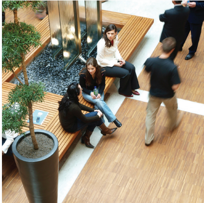
E-learning skräddarsys utifrån verksamheten. Alla anställda får ökad kunskap oavsett individuell nivå.