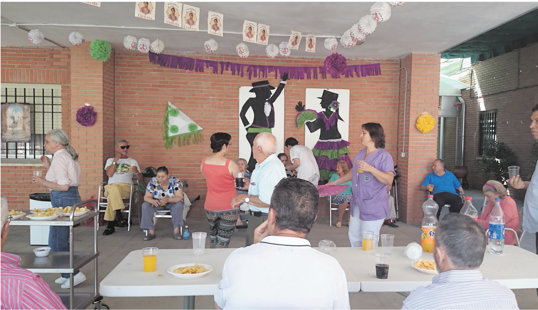
Caseta de feria en el porche de la residencia de Diputación de Marchena