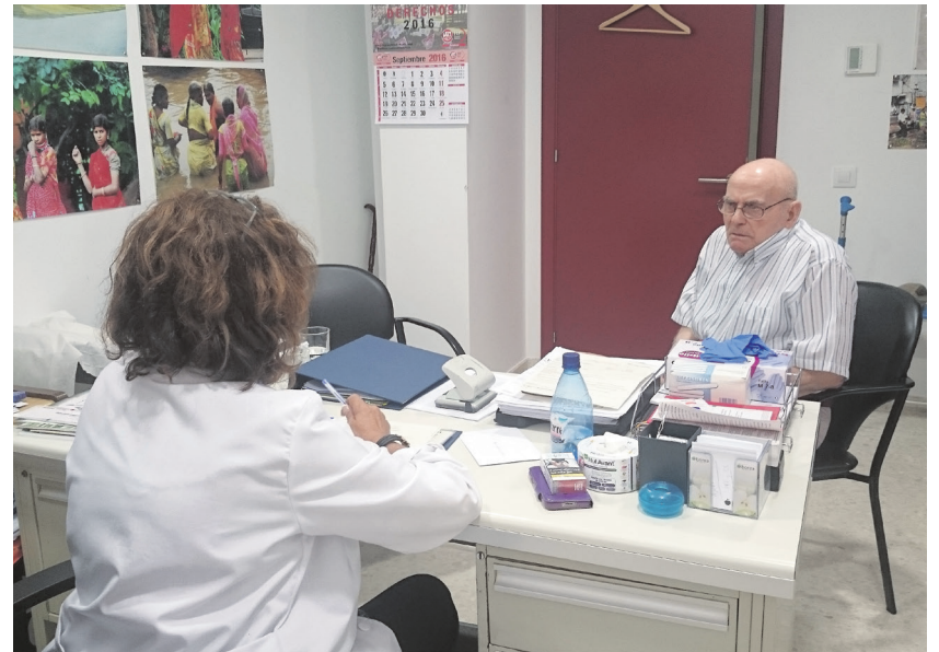
Servicio Médico en la Residencia de Mayores de Diputación de Marchena

Todo ello con el objetivo de restablecer o mantener el bienestar acorde a las limitaciones propias de la edad y de la persona.