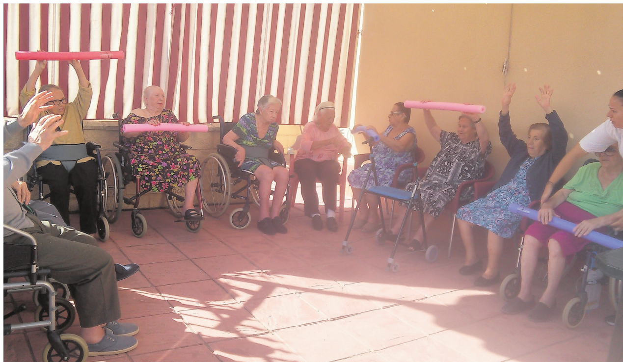
El patio de la residencia acoge ejercicios al aire libre

El patio da a la calle y eso nos deja ver pasar a la gente, que nos saludan. Así que no estamos encerrados, sentimos la libertad de la calle. Vemos, miramos y formamos parte de la vida cotidiana de los que pasan. No estamos aislados. Precisamente en este patio, cuando hace buen