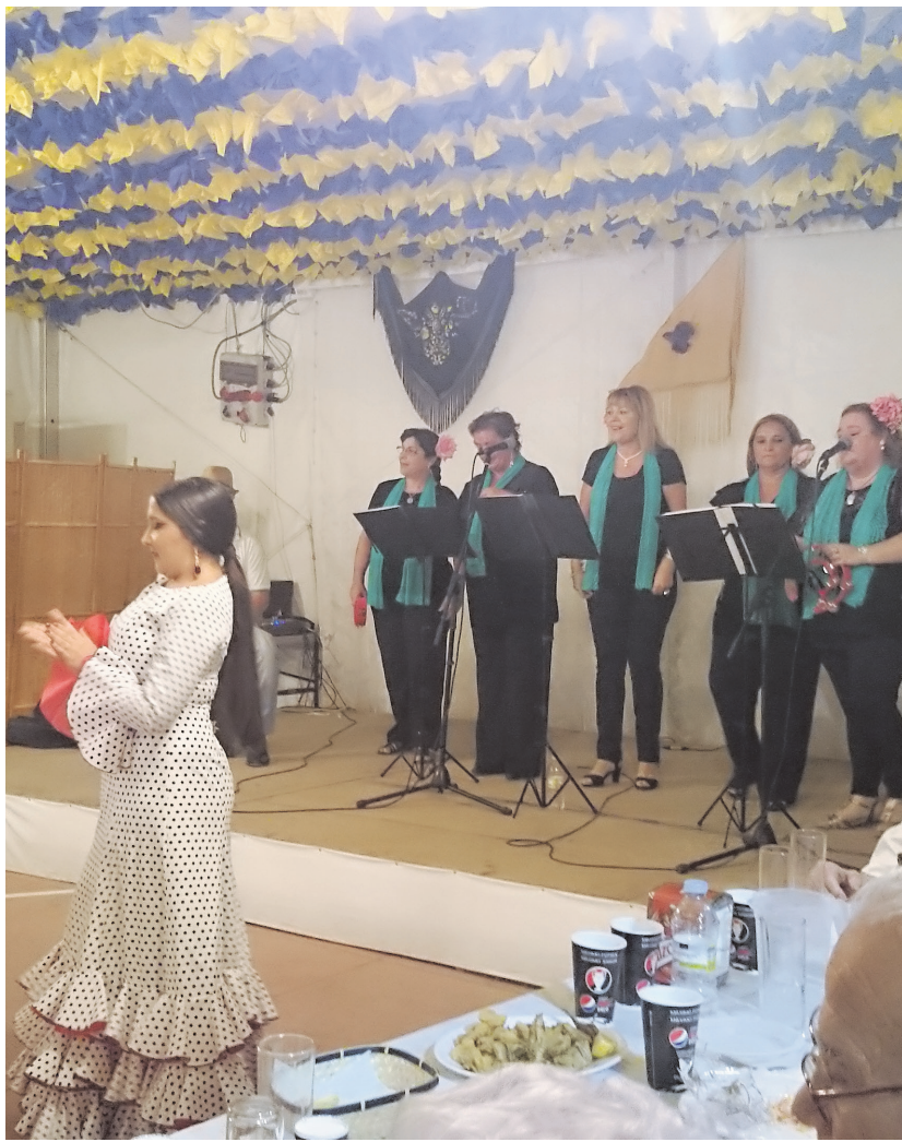
Cena de los residentes en el Real de la Feria de Marchena