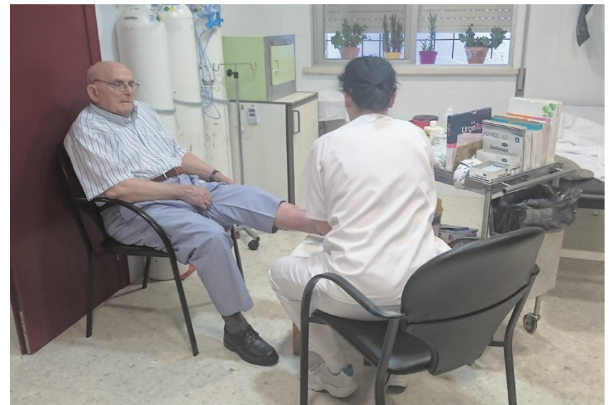
Sala de cura del servicio de Enfermería del centro