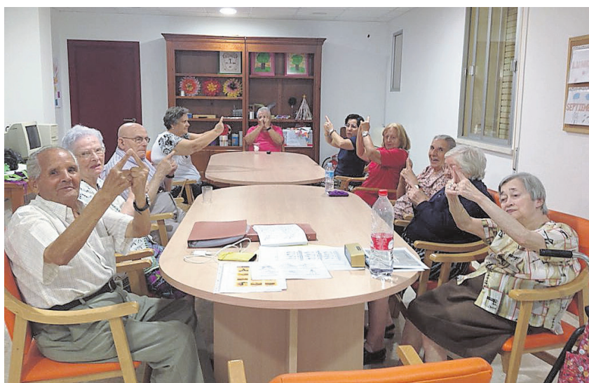
Los residentes durante sus actividades con mudras