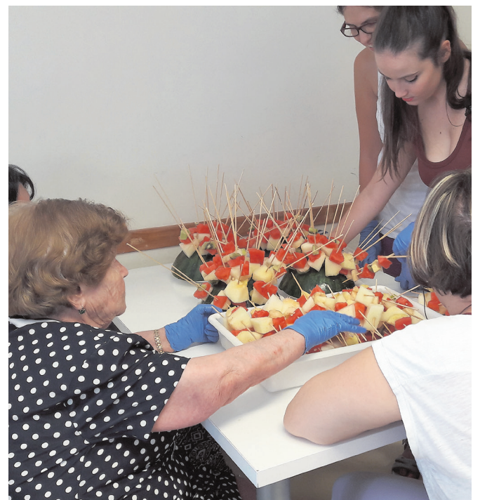
Ambos colectivos elaboraron pinchos de frutas