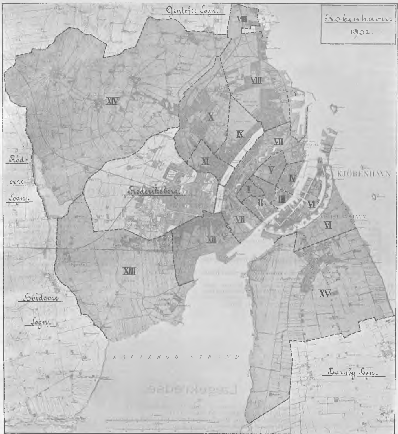
Oversigt over Befolknings-, Beboelses- og Dødelighedsforhold i ethvert af Stadens hygiejniske Kvarterer i Aaret 1900*