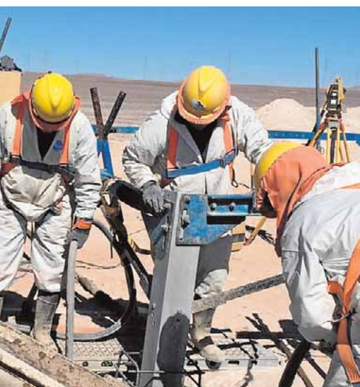
Trabajos en Antofagasta, dos ciudades chilenas.

con un total de diez agentes destinados a la localidad: ocho guardias civiles, un cabo y un sargento. Desde el consistorio se asegura que el nuevo cuartel ha sido una de sus prioridades porque «incrementará la seguridad de nuestro municipio». B.M.