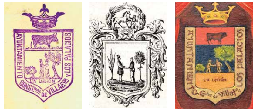
Parte de la evolución del escudo de Los Palacios a lo largo de la historia ABC

corta y sombrero de inferior altura es probable que personificara a los agricultores de ambos pueblos.