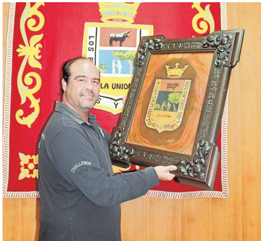
Mayo muestra los dos escudos que lucen hoy día en el salón de plenos F.R.M.

Quizá el más revelador sea el desliz llevado en la calle central del escudo, en el que se plasma de dos modos diferentes (uno en su origen y otro desde 1864 y vigente hoy día) el acuerdo alcanzado entre las dos villas en el que de manera simbólica dos hombres «sellan» dicho pacto entre el señorío y el ramo de labradores. Según documentos a los que ha tenido acceso el archivero, el señor representado con sombrero alto de copa y elegante levita puede representar a la Casa Ducal de Arcos, concretamente un administrador suyo en la villa de Los Palacios; mientras que el hombre con la chaquetilla más