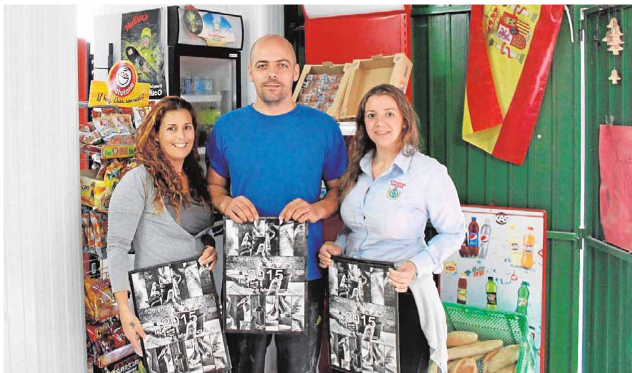
Empleados de Panificadoras Macías posan con el calendario del año pasado

Ahora desde el Ayuntamiento se les ha comunicado un calendario de pagos tras la visita de un inspector de trabajo, pero lejos de solucionar nada, solo se retrasará. «En octubre nos pagan junio, en noviembre, el mes de julio y en diciembre será agosto, pero más adelante nos deberán esos tres meses». La lucha de los funcionarios está, por tanto, lejos de concluir.