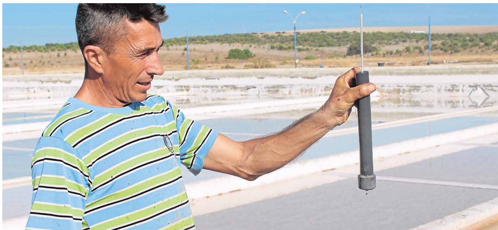
Uno de los trabajadores de Valcargado mide la temperatura de la salmuera artesanal que se elabora en sus instalaciones

de la Caixa por el que la entidad financiara ayudará a la asociación a desarrollar su labor solidaria con los pacientes y sus familiares, y a seguir programando actividades y campañas de concienciación de la ciudadanía. A.H.