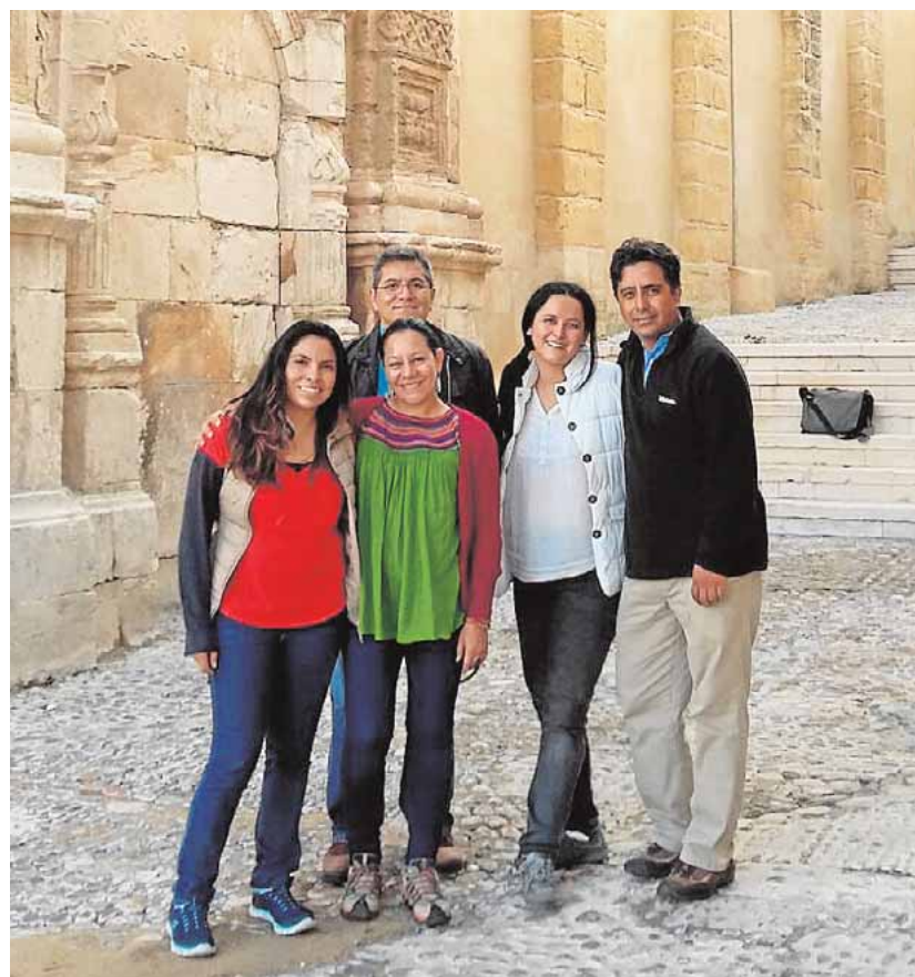
Los profesionales han aprendido métodos que aplicarán en su país.