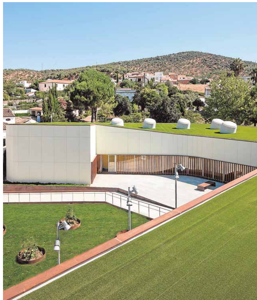
La piscina está totalmente integrada con el paisaje

El actual equipo de gobierno no está de acuerdo con que la piscina suponga un gasto anual de 120.000 euros. «Nos parece un gasto excesivo», explica Ma-