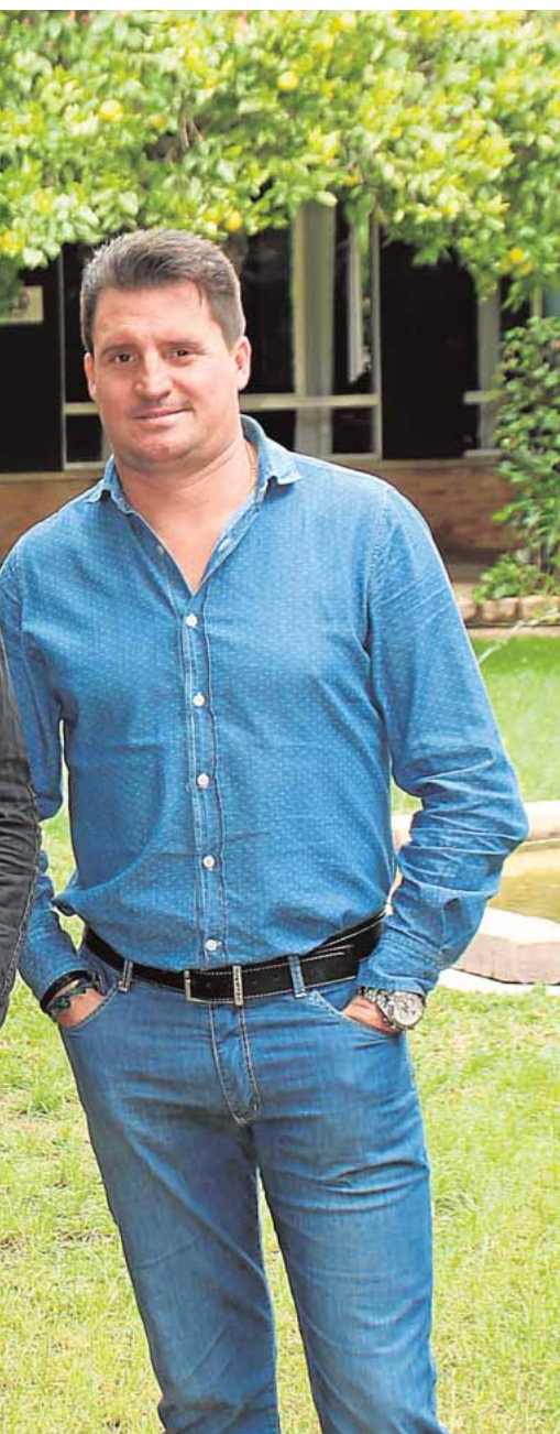
uno de los patios del Lantana Garden