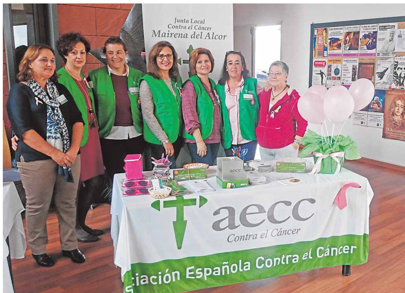
Voluntarias de la Junta Local de Mairena han estado ofreciendo información y recogiendo donativos