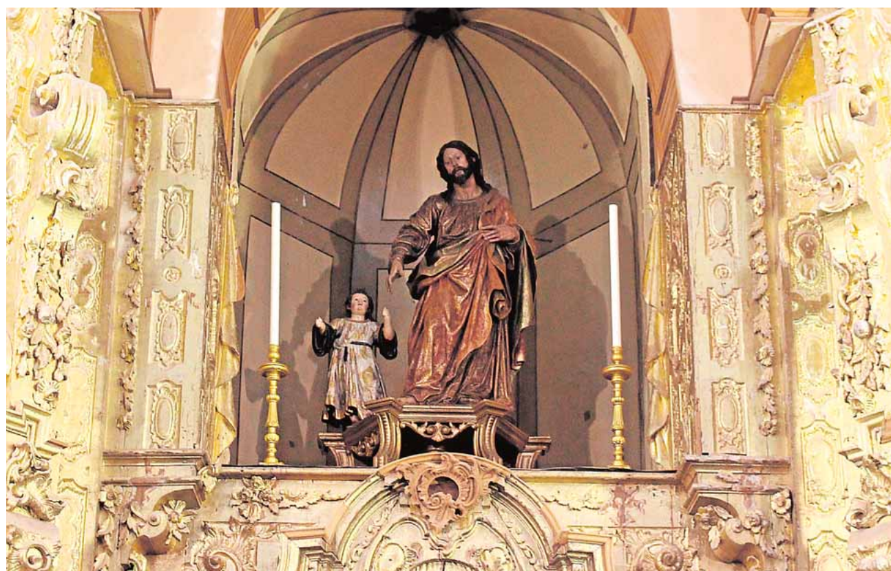
San José y el Niño de la mano se acercará desde el retablo hasta el crucero de la iglesia para la exposición

cho plazo finalizará el día 15 de noviembre. El modelo de solicitud podrá recogerse en el Registro General del Ayuntamiento, en la Plaza de Abastos. El acto de coronación de los Reyes se celebrará el 23 de diciembre en el Palacio de Benamejí.