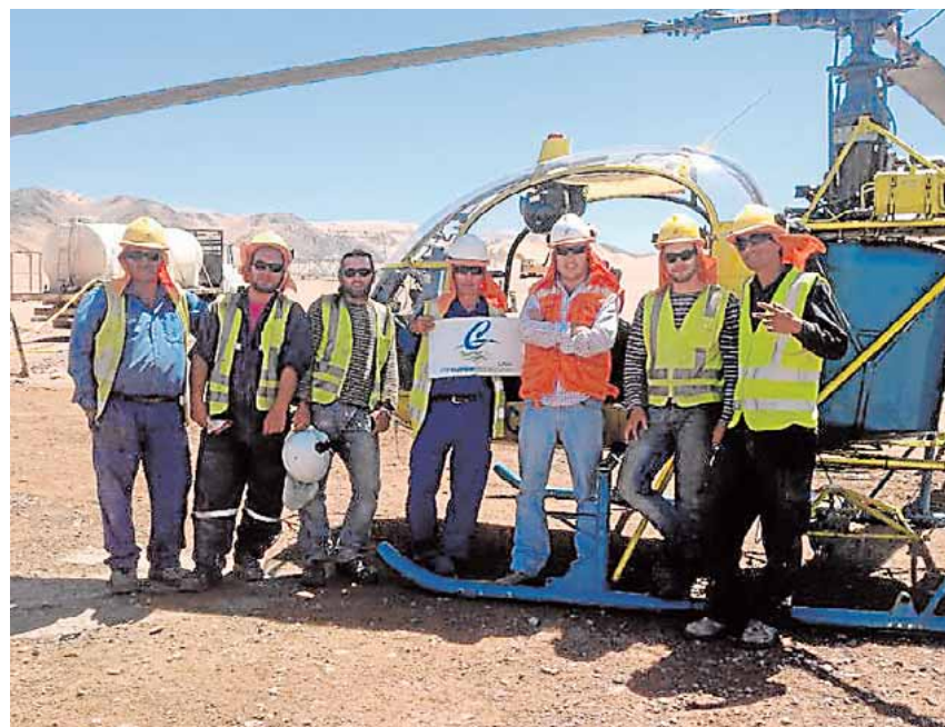
Los trabajadores en el Llano de Llampó, en la región chilena de Copiapó.

Con una plantilla de 55 personas y más de 270 obras ejecutadas a sus espaldas, Concretedecor da ahora el salto al mercado de América del Sur desde su filial chilena y compartirá su ex-