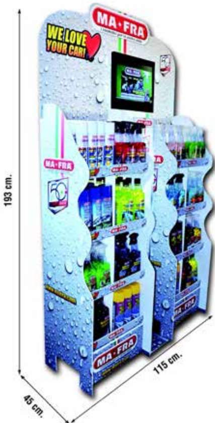
Penisola Boden-Verkaufsständer / Présentoir de sol Ausstellungsregale mit hoher visueller Wirkung, zur Verkaufsförderung Présentoirs à grand impact visuel pour augmenter les ventes