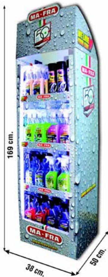
Single Boden-Verkaufsständer / Présentoir de sol