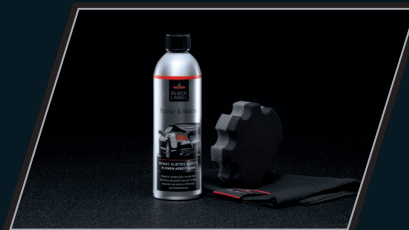
Politur & Wachs Set