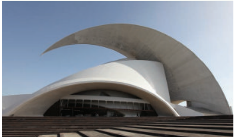
The Auditorio de Tenerife, designed by Santiago Calatrava, in Santa Cruz, Spain.