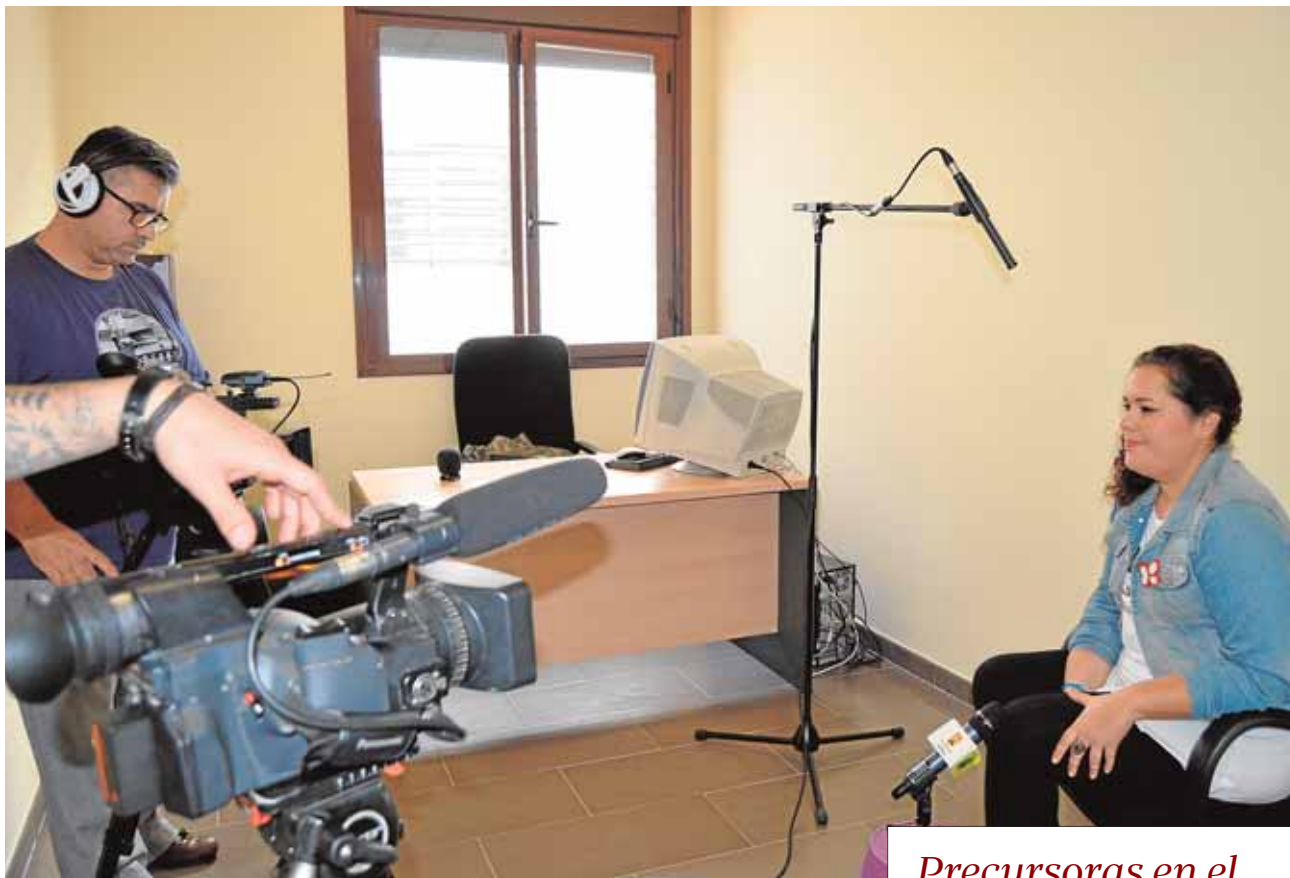
Las entrevistadas han dado su visión sobre el papel de las mujeres. PEDRERA TELEVISIÓN

tro abrirá fines de semanas y festivos, dispondrá de un monitor y contará con horarios exclusivos para los niños menores de 18 años. El nuevo espacio está en el edificio de asuntos sociales y cuenta con diferentes juegos de mesa y recreativos. B.M.