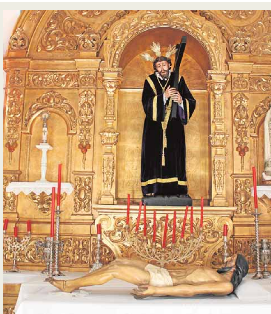
En la Hermandad del Nazareno confluyeron las dos antiguas cofradías de Almadén que procesionaba con los pasos de Jesús Nazareno, Cristo Yacente en su Santo Entierro.