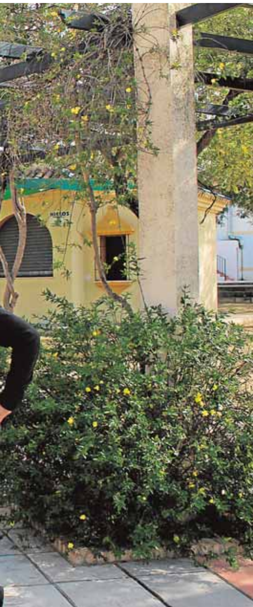
J. L. MÁRMOL

la localidad, se organizó un ensayo solidario en el que se recogieron más de quinientos kilos de alimentos y productos de primera necesidad. Los costaleros iban recorriendo las calles con un paso en el que los vecinos depositaban la comida.