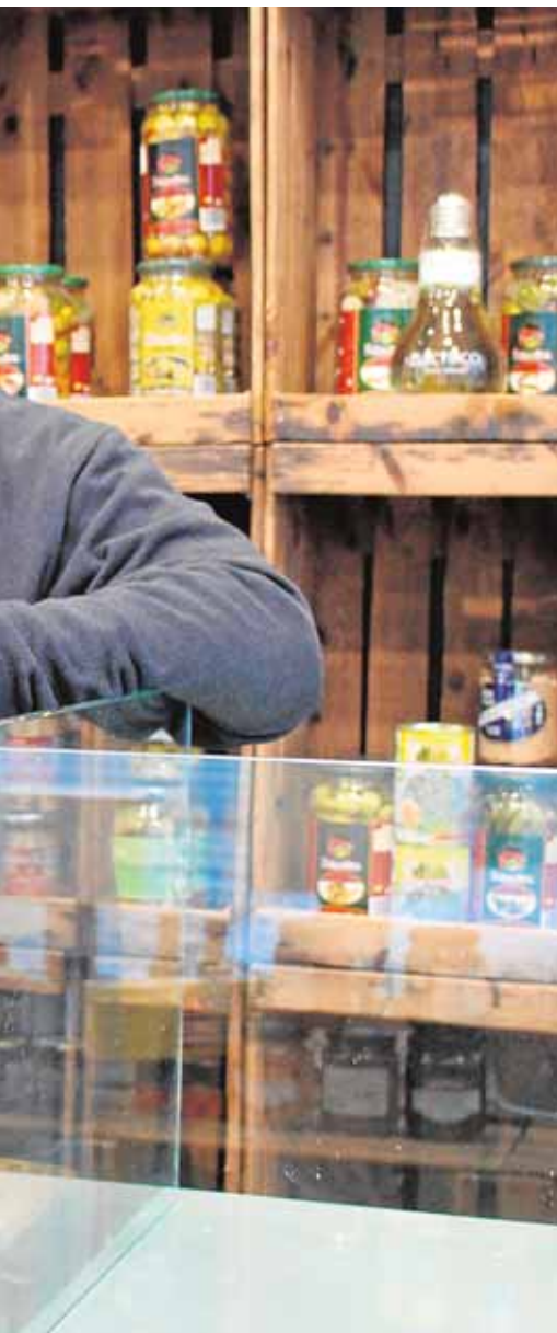
net y su tienda física en Écija

de actos que arranca el próximo viernes con una jornada coeducativa por la Igualdad en el colegio de El Campillo. Además, hasta el día 18 de marzo se organizarán charlas sobre salud en la mujer, representaciones de teatro y diferentes talleres.