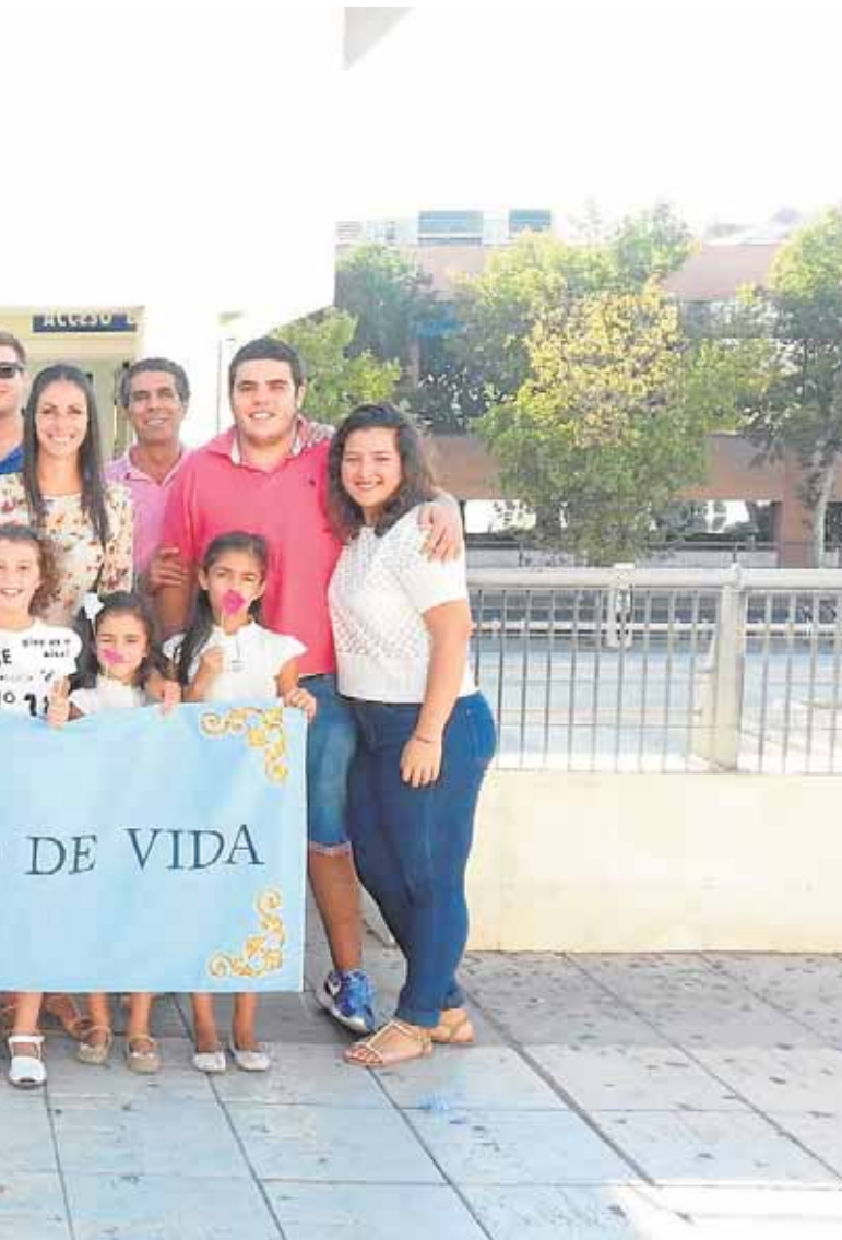
del Rocío en septiembre del pasado año

tas las ilusiones de un maestro de escuela». Una obra donde el autor recoge una profunda reflexión sobre los orígenes de Andalucía y los motivos históricos que la han llevado a su situación actual. El libro estará disponible en las librerías locales.