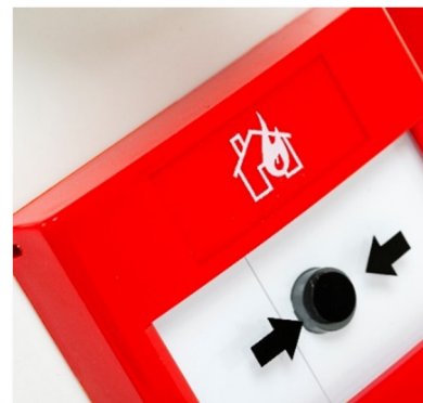
Larmknapp för manuell aktivering med siren och blyxtljus.

Sedan WES+ lanserades år 2010, har över 30 000 enheter sålts. WES+ ger en effektiv temporär brandskyddslösning för byggarbetsplatser och sedan lanseringen 2010 har det blivit en integrerad del av säkerhetsarbetet hos många stora byggföretag.