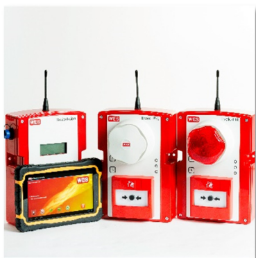
Systemets olika enheter är batteridrivna med en batteritid på ca 5 år.

WES+ systemet består av enheter som är sammankopplade via trådlös anslutning. Till basstationen kan ett obegränsat antal enheter anslutas, vilket ger ett flexibelt, praktiskt och effektivt system. Vid händelse av larm aktiveras automatiskt alla sirener och blyxtljus. Via basstationen identifierar man snabbt vilken enhet som utlöst larm, det möjliggör snabba åtgärder och säkerställer ett effektivt skydd av människor, byggnader och tillgångar.