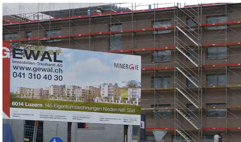
In der Neubausiedlung Niedermatt-Süd hat die Stadt ein Lokal im Stockwerkeigentum gekauft. Hier wird auf das nächste Schuljahr hin ein Kindergarten eingerichtet.

Das städtische Parlament hat dem Kaufvertrag für die Übernahme im Stockwerkeigentum zugestimmt und somit ist das «Problemkind Kindergarten Littauerboden» vorerst gelöst. Der Kindergarten kann auf das Schuljahr 2015/16 hin eröffnet werden. ■