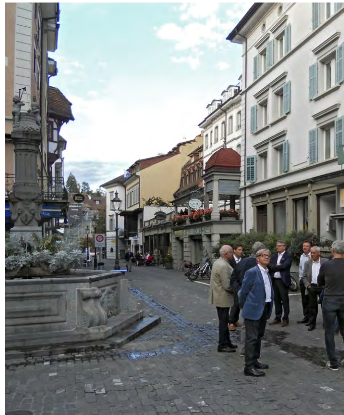
Brunnen in der Pfistergasse und Burgerstrasse.

waren 15 am Treffen mit dabei. Nur ein Ehemaliger musste sich ferienbedingt abmelden. Die grosse Teilnahme zeugt von einem generationenübergreifenden, respektvollen und kameradschaftlichen Einvernehmen zwischen den Ehemaligen und aktuellen Funktionären der BG Matt. Es ist davon auszugehen, dass der rundum gelungene Anlass bei einem nächsten Jubiläum wiederholt werden wird. ■