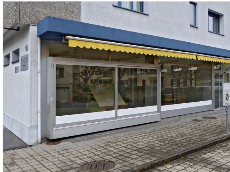
Das leerstehende Ladenlokal Husi.

Auch für die neu entstehenden Gewerbeflächen der neuen Überbauung Neuhushof 14 haben wir mit der Volksschule Stadt