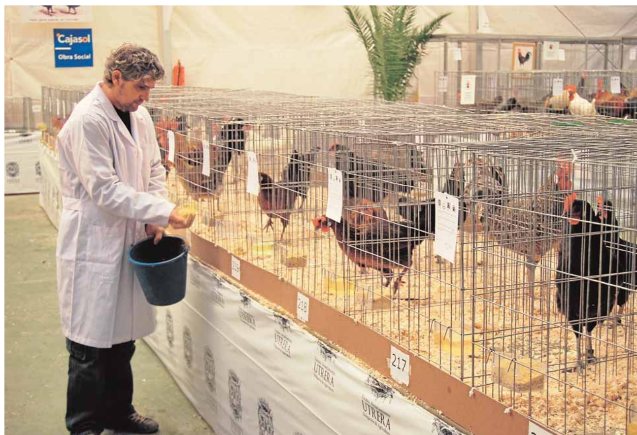
La feria de la gallina utrerana se celebra todos los años en la caseta municipal de Utrera

La gallina utrerana es sin lugar a dudas una parte fundamental de la historia de Utrera.