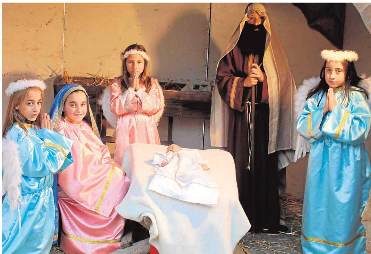
Belén viviente de Las Cabezas

dos anticonceptivos, ciberacoso y violencia de género, hábitos de vida saludables y los peligros de las nuevas drogas de diseño son los temas que centran el encuentro, que finalizará con un circuito multiaventura en el Coto de la Isleta. A.H.