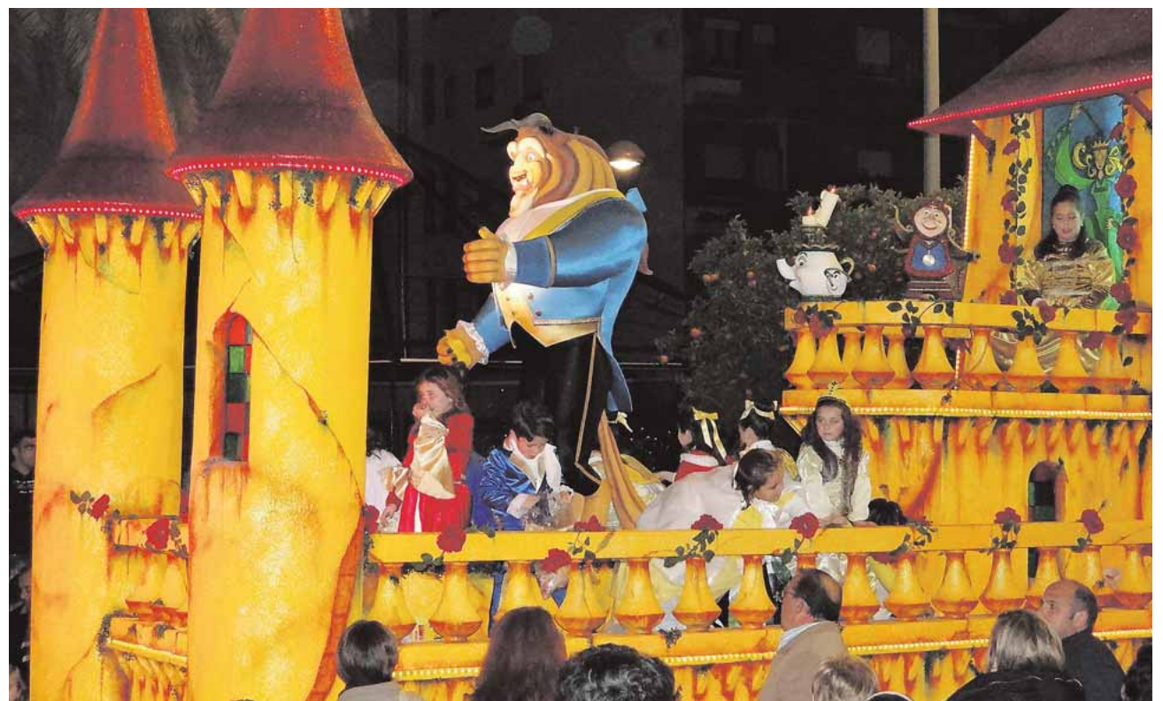
La cabalgata de Reyes pondrá punto y final a las actividades navideñas

El día 5 de enero (salvo Coripe, que lo hace el día 6), los diferentes pueblos de la Campiña preparan sus carrozas para las cabalgatas de Reyes, entre las que destaca la propuesta de dulces sin azúcar para los niños diabéticos en Morón de la Frontera.