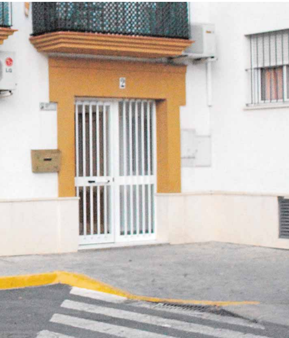
día 12 de enero por orden de un juez

ño diverso que incluye un torneo de pádel los días 26 y 27, una gran yincana el 2 de enero y talleres de manualidades para niños el 2 y 3 de enero. El 5 de enero llegará la cabalgata de Reyes y el 6 la tradicional degustación del Roscón de Reyes.