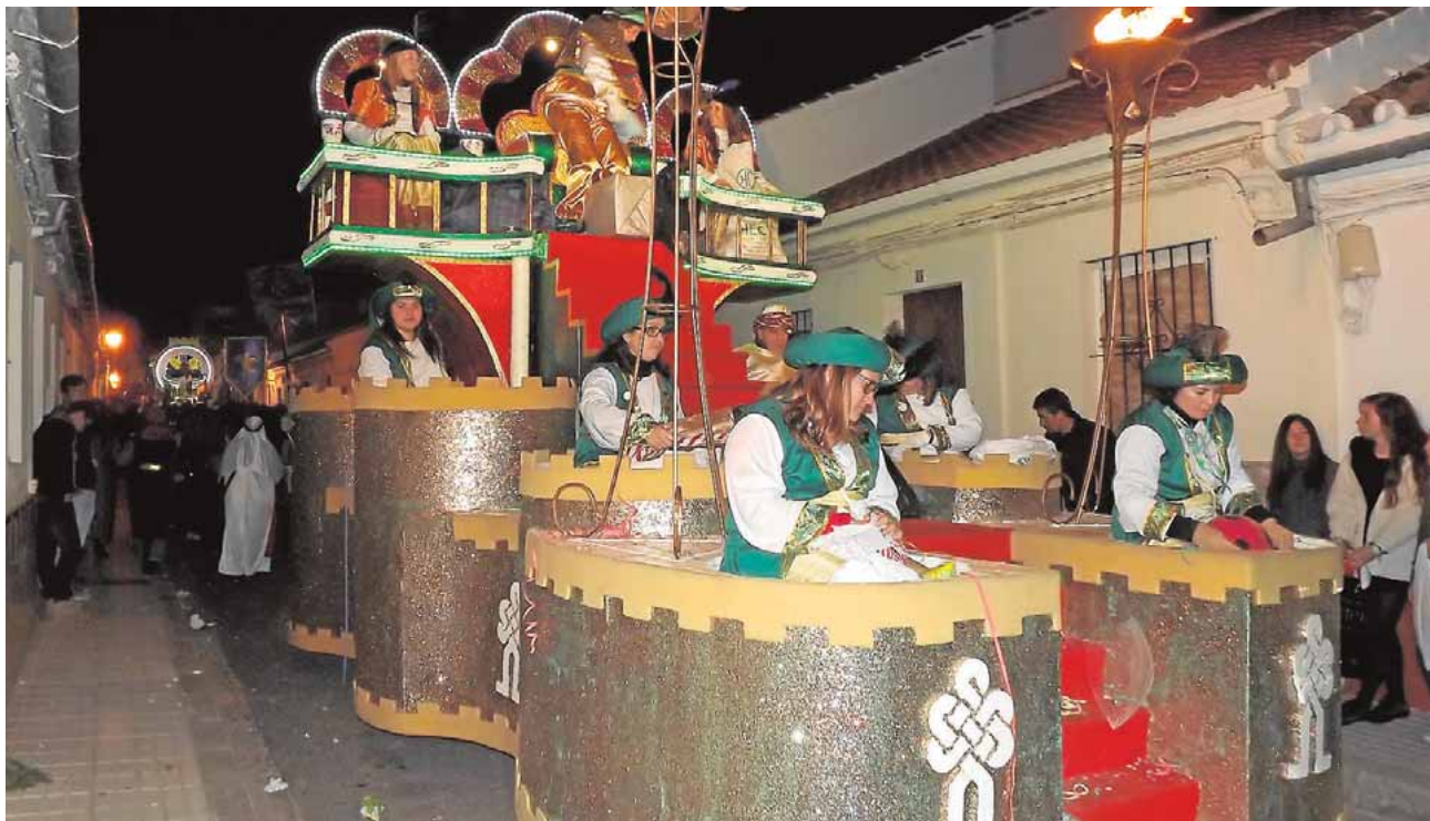
En 2016 por primera vez todas las carrozas llevarán luces led

visación y la música flamenca improvisada. «El retablo ibérico de las maravillas» es el nombre de la compañía que durante sus intervenciones hace un ejercicio de agilidad mental explotando el arquetipo ibérico-andaluz. A.C.