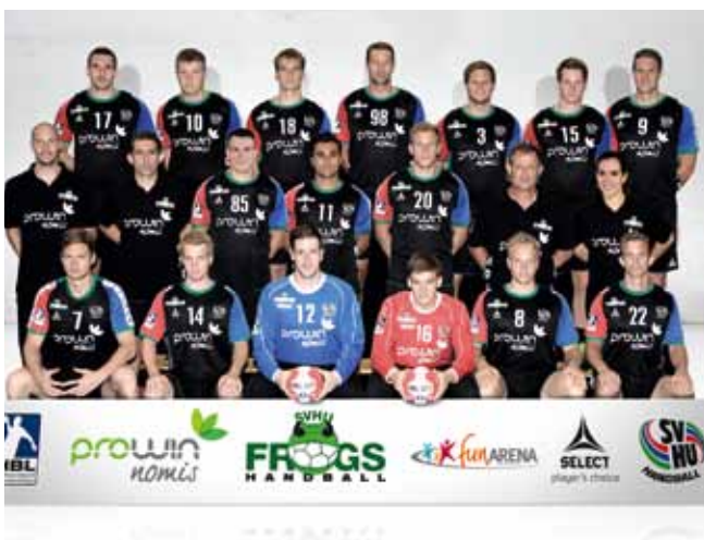
www.svhu-frogs.de SVHU Handball in der 2. Bundesliga Willkommen in unserem Froschteich.