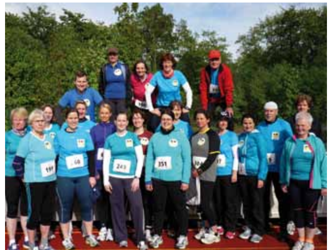
05 8. HU Volkslauf Henstedt-Ulzburg läuft am 08. Mai 2015 Beckersbergstadion