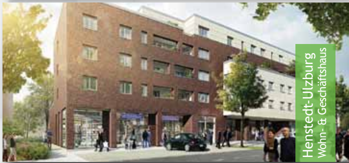
Henstedt-Ulzburg Wohn- & Geschäftshaus