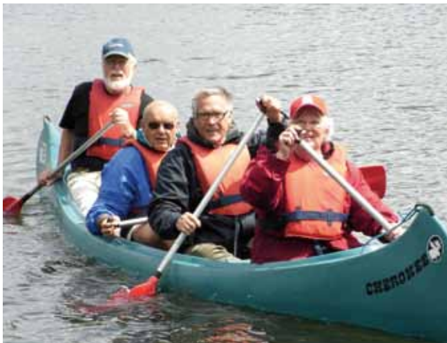
06 Senioren-Fitness-Woche 29. Juni - 3. Juli 2015 Sport- und Bildungszentrum, Bad Malente