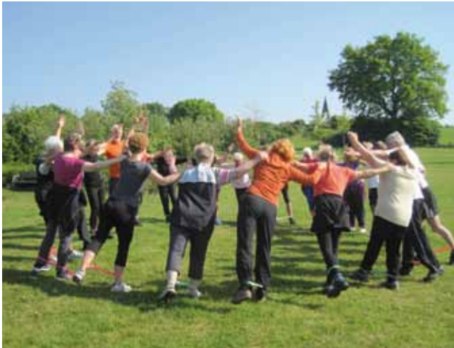
03 Seniorenversammlung (Abteil. übergreifend) 16. März 2015, 18.00 Uhr Bürgerhaus