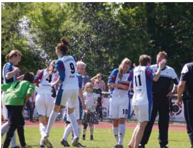
www.fussball.sv-hu.de SVHU Fußball in der Regionalliga Unsere Frauen auf dem Weg nach oben.