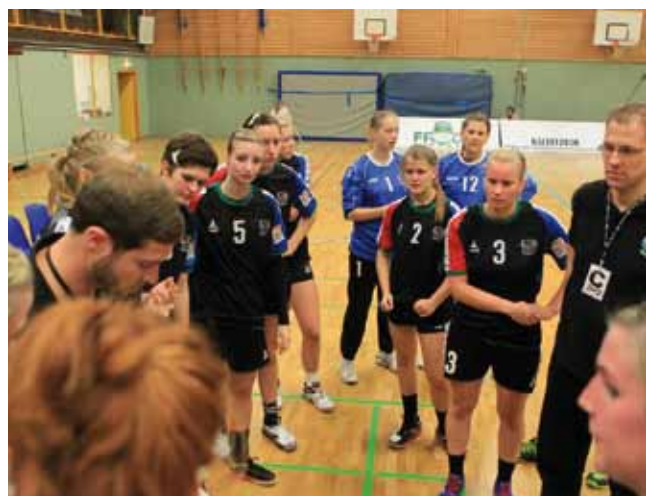
www.svhu-frogs.de SVHU Handball in der 3. Bundesliga Unsere Frauen kämpfen um Punkte.