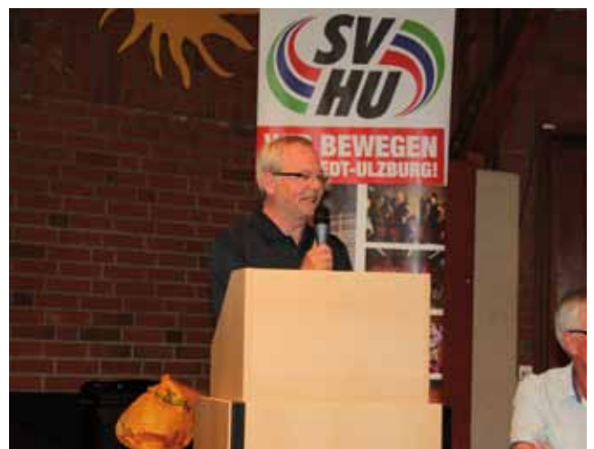
06 Delegiertenversammlung 16. Juni 2015, 19.30 Uhr Bürgerhaus