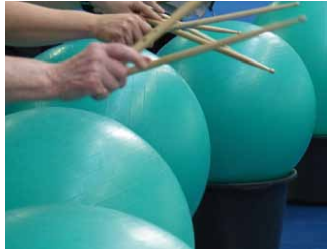
03 FTG Abteilungsversammlung 16. März 2015, 19.30 Uhr Bürgerhaus