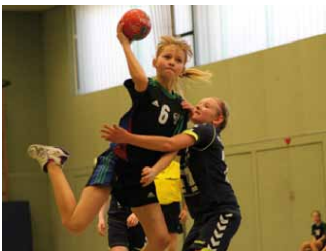
05 39. Select Ulzburg-Cup 14. - 17. Mai (Himmelfahrt) C- & D-Jugend 22. - 25. Mai (Pfingsten) B- & A-Jugend