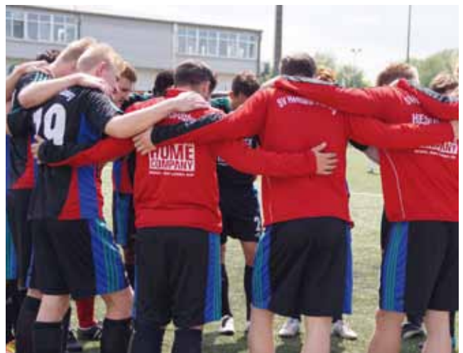
www.fussball.sv-hu.de SVHU Fußball in der SH-Liga Die Erste vergisst man nie! Spannung garantiert.