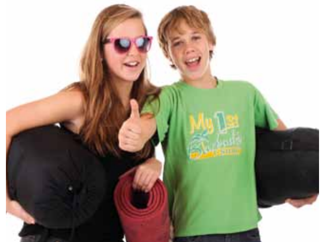
08 Jugendreise 15. - 21. August 2015 Fehmann