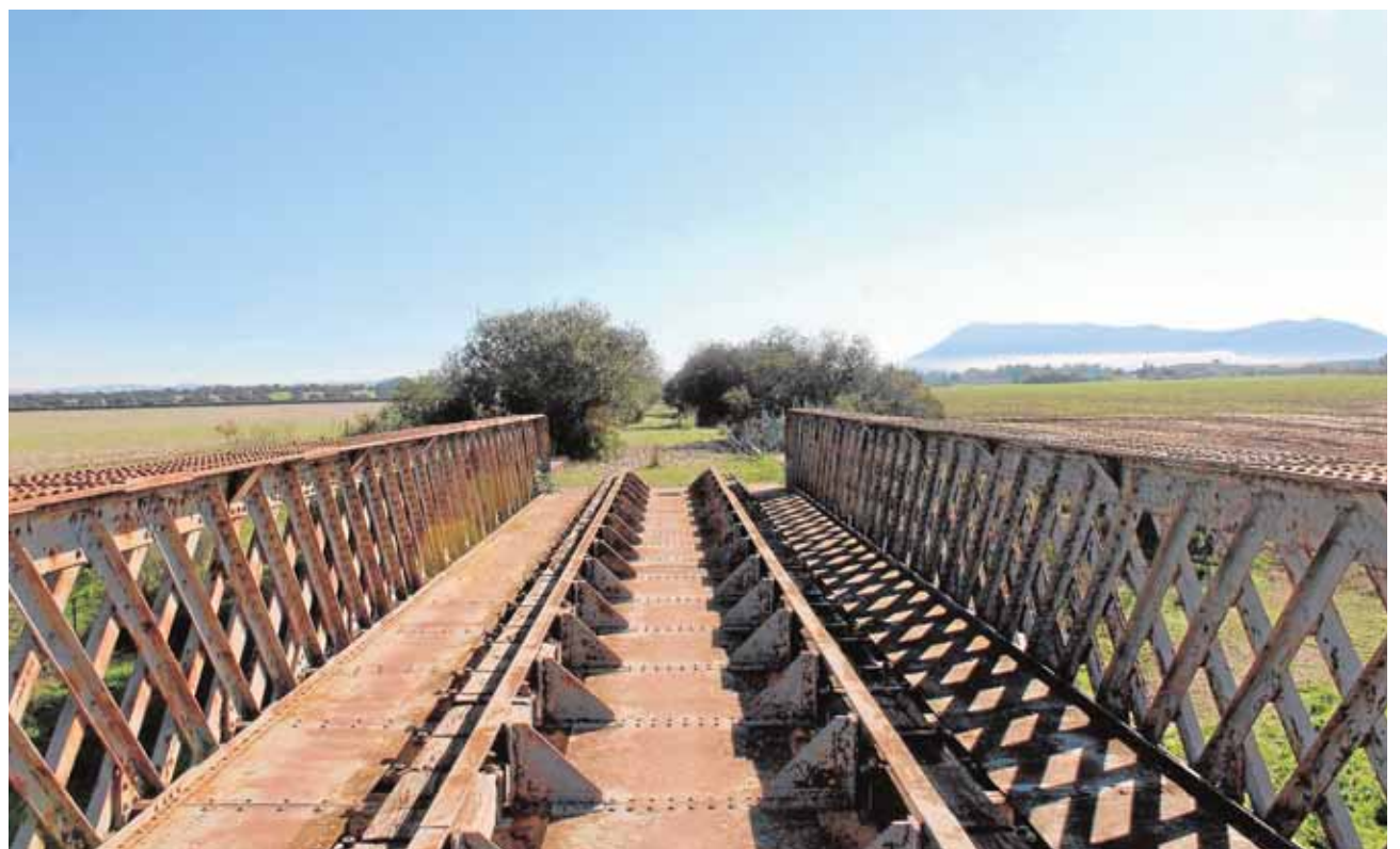
El Puente del Hornillo sería el punto principal de una futura vía verde

Pero, además, no se olvidan de la cara solidaria. «Hemos acordado una colaboración benéfica con la Asociación La Inmaculada, contra el Alzheimer, con quienes organizaremos diversas actividades en su beneficio».