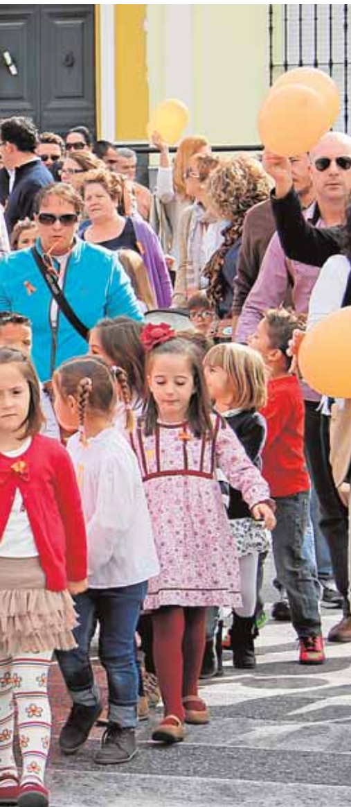
lama «una educación digna en Mairena» A.G.

ha sido repuesta la baja. La consecuencia es que hay 28 alumnos que no pueden recibir la enseñanza que le corresponde. Desde Izquierda Unida denuncian la situación y reclaman a la delegación de Educación que cubra el puesto vacante.