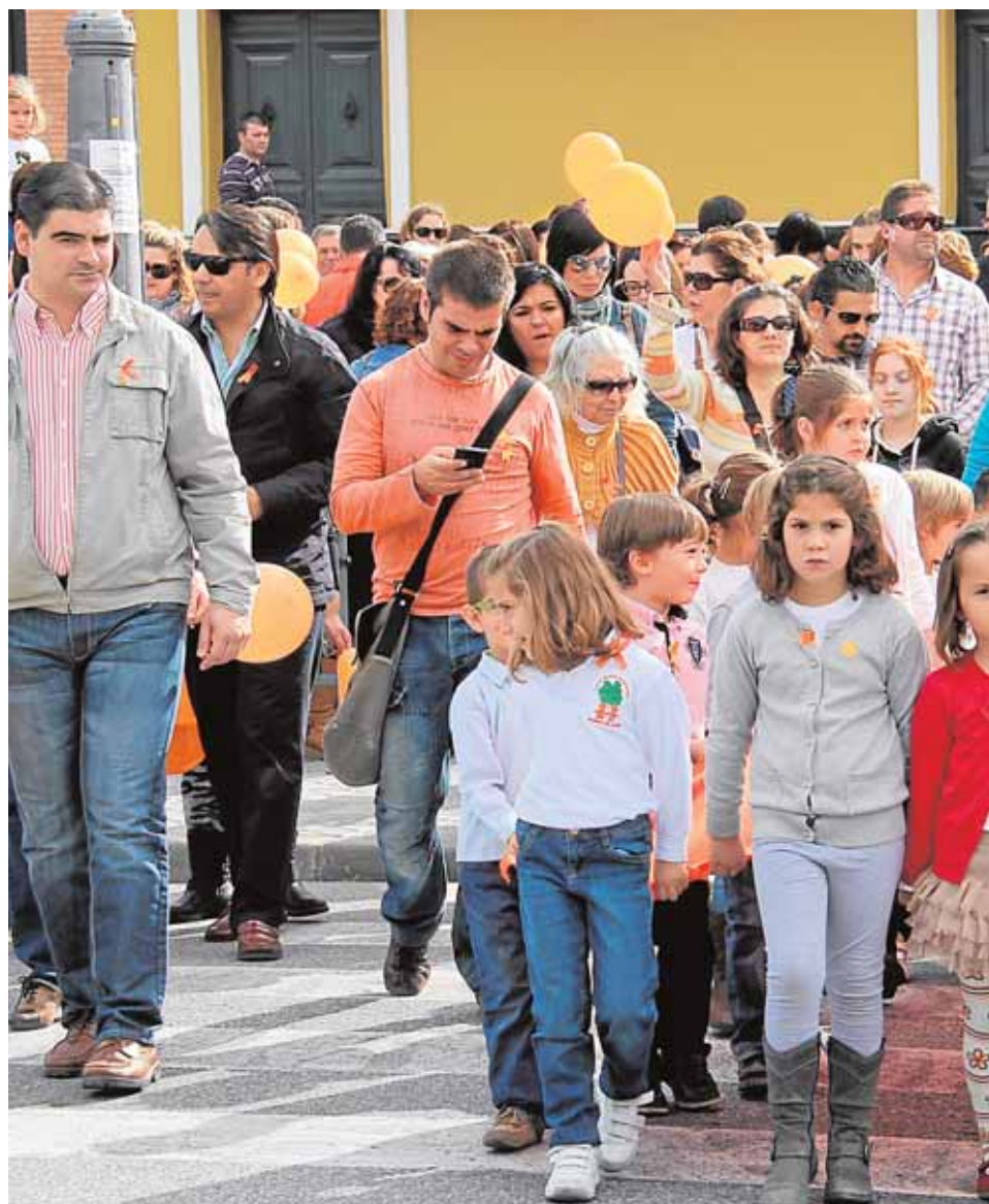
La Ampa del colegio El Prior prepara una nueva manifestación de protesta que re-

Todos los padres y madres consultados por ABC Provincia coinciden en declarar se «engañados, estafados y defraudados, una vez más», alegando que tanto consejero como delegado, les ha-