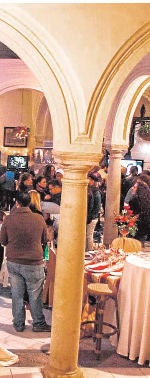
primera edición del evento nupcial.

ventud que pretende sacar los rincones más bonitos de la localidad. Los participantes podrán competir en las modalidades de adulto y juvenil, presentando las mejores instantáneas que realicen en un recorrido por las calles y plazas de Casariche. B.M.