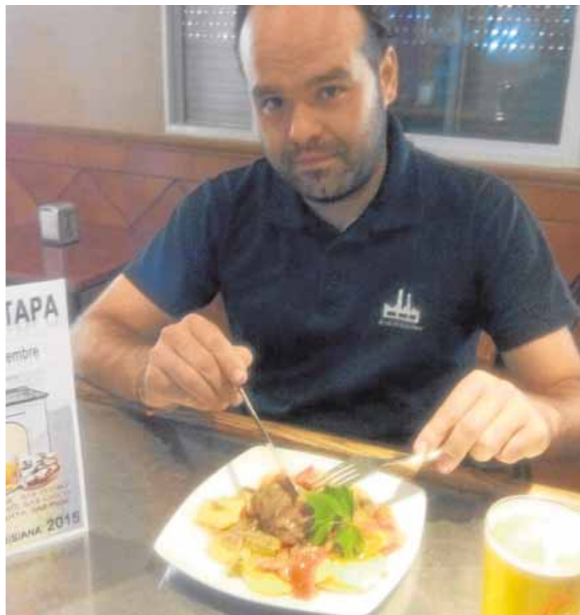
En la imagen, la carrillada al Pedro Ximénez del bar Polígono

Concretamente, estos diez establecimientos participan con las siguientes propuestas: el bar Polígono con la «carrillada al Pedro Ximénez»; el bar Pedro con la «delicia del abuelo»; el bar PSOE con «pollo y ensalada dominicana»; La Carreta con el «rollo siciliano»; Los Naranjos con el «bocadito de otoño»; el bar Chico con el