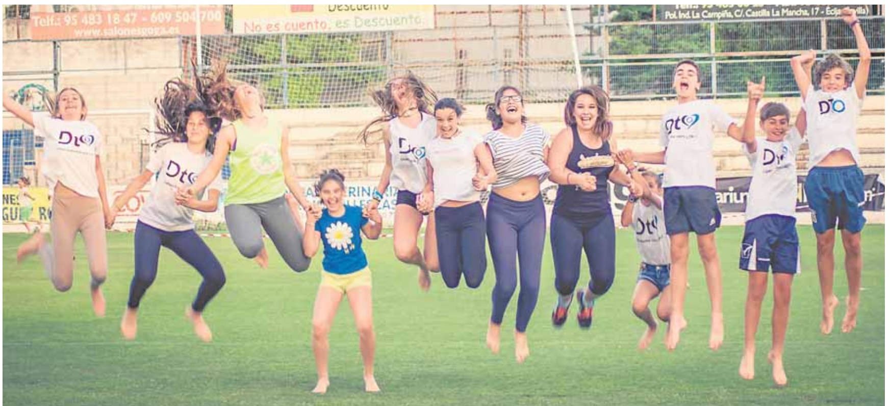
La nutrición y el deporte son fundamentales para controlar la diabetes tipo 1, pero la cura sólo es posible con la investigación

general. En ella se tratará de informar y aclarar dudas sobre los distintos signos y síntomas que puede notar la mujer, bajo el título «Tengo un bulto en el pecho. ¿Qué hago?». Tendrá lugar en el Salón de la Huerta a las 18.30 horas.