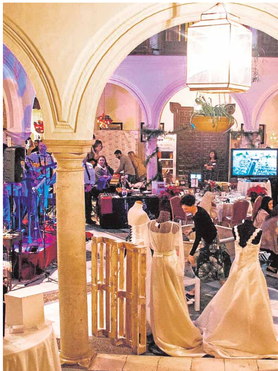
El patio del hotel Palacio Marqués de la Gomera de Osuna acogió el año pasado la p