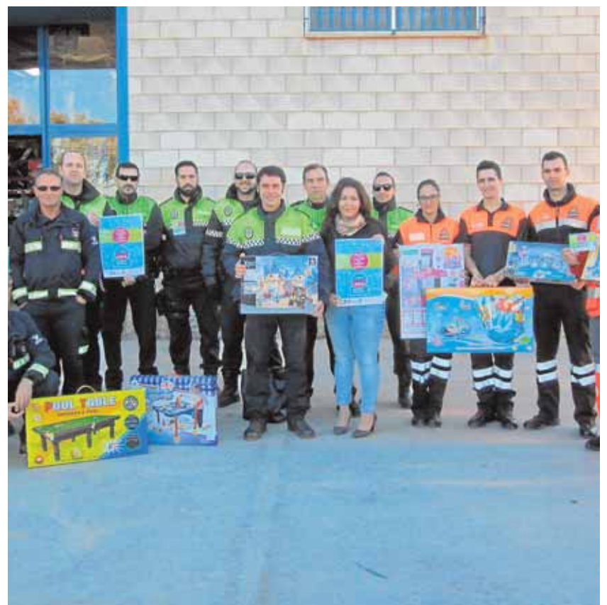
Un grupo de los colaboradores en la iniciativa

Para rematarlo todo, los ciudadanos están adquiriendo a muy bien ritmo las papeletas y cerrando así este círculo virtuoso de solidaridad. Para los niños quedarán los regalos, todos