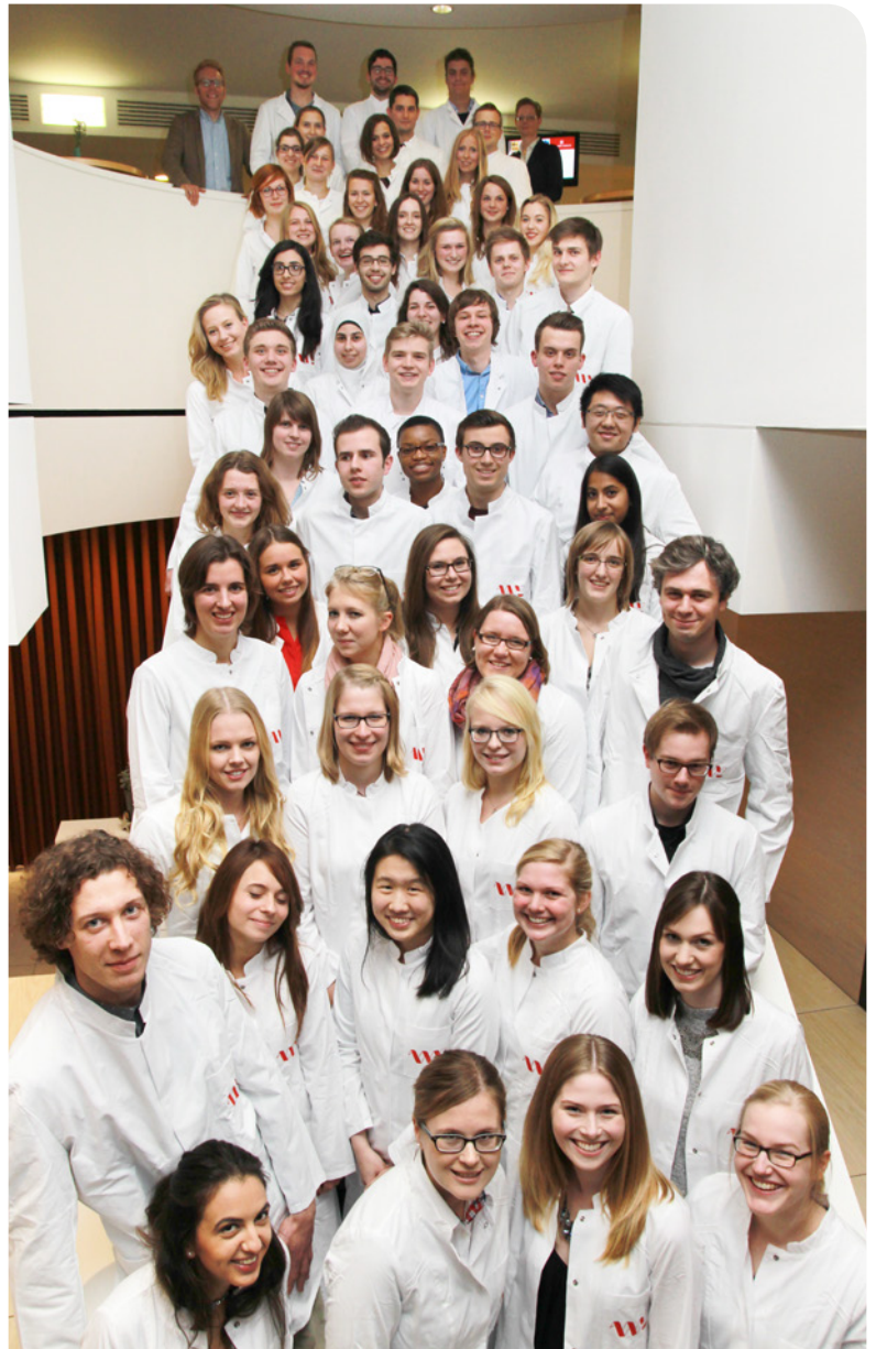
Gruppenfoto mit weißem Kittel: Wie schon guter Brauch wurden die Pharmaziestudierenden der Universität Münster nach Abschluss des vierten Semesters neu eingekleidet.