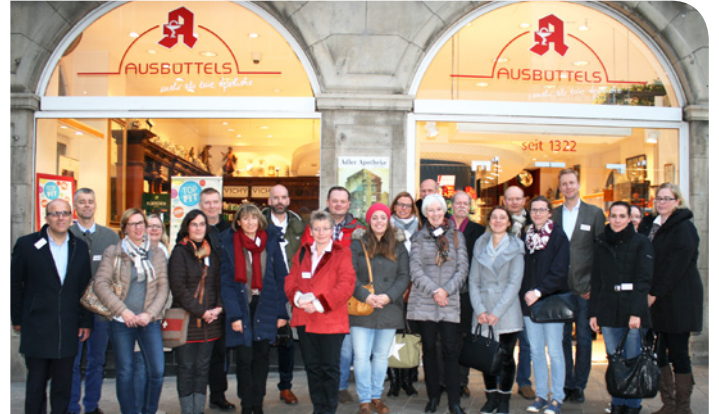
In der Busch-Apotheke in Brackwede und in Ausbüttels Apotheke in Dortmunds City starteten die Infoveranstaltungen für Berufsberater/innen.