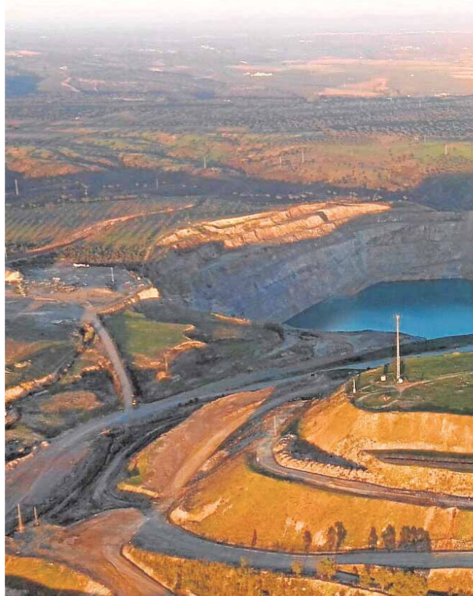
Los sondeos en la mina de Aznalcóllar avanzan mientras fian al regadío los nuevos

La lenta reanudación de la actividad minera no está teniendo todavía efectos para sectores complementarios como la hostelería y el comercio. «Es pronto aún para que se note pero sí hay más movimiento en la restauración», abunda el regidor. Hasta que se analicen las muestras de los meta-