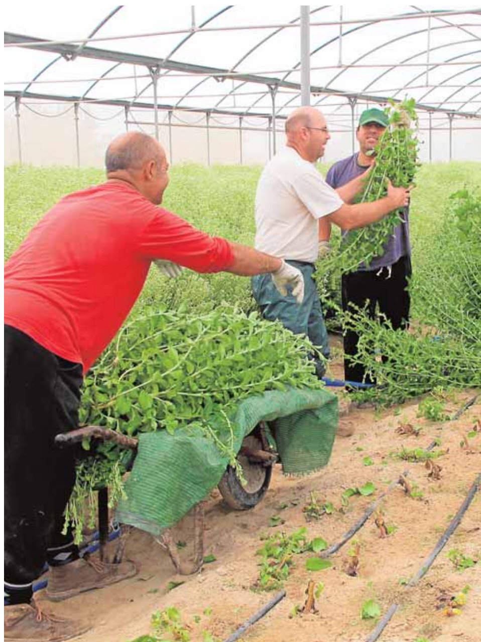
La primera recolección de stevia suma aún más actividad al Centro Especial de Empleo de Ajudisle.

Con esta situación y ante las perspectivas de futuro que pueden dejar a la remolacha como un cultivo testimonial, la stevia se presenta como una alternativa viable por la que ha apostado el Centro Especial de Empleo de Ajudisle y que apoya el grupo empresarial Algosur, que aprovecha la experiencia en el centro a modo de laboratorio para la posterior extensión del cultivo.