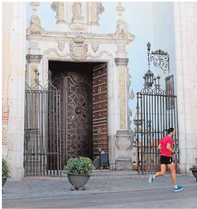
La iglesia de Santa María será uno de los puntos del recorrido

De este modo, la ruta partirá el sábado a las 19 horas de la Plaza de España y continuará por la Plaza de Santa María, Fernández Pintado, Elvira, Plaza de la Constitución, Cánovas del Castillo, Puerta Osuna, Santiago, Co-