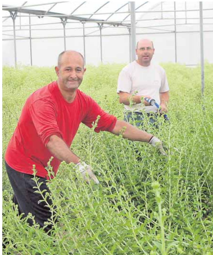
Trabajadores discapacitados de Lebrija preparando la planta de stevia A.H.

Discapacitados recogen la primera cosecha en Lebrija