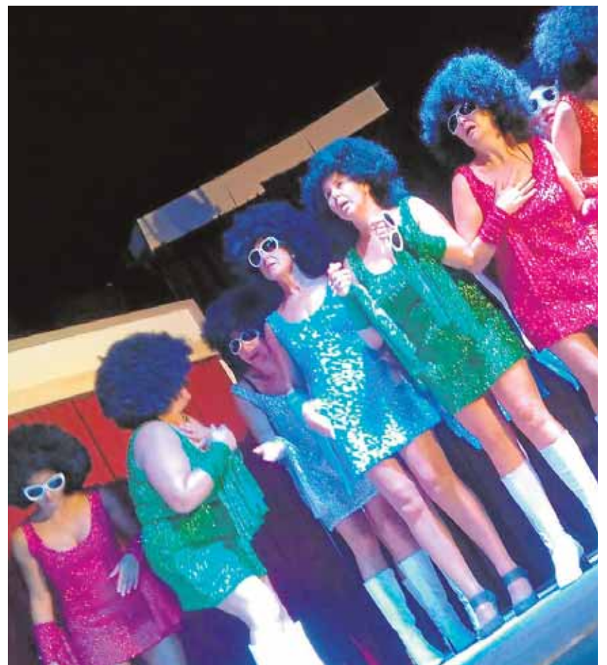
La última obra de Menudo Cuadro se estrenó el 19 de agosto