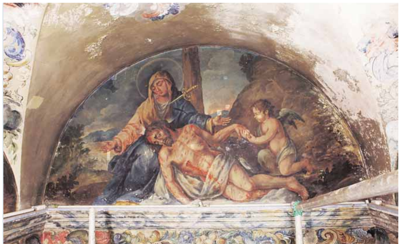
Detalle de las pinturas antes de la intervención

Así pues, entre finales de año y principios de 2017, el histórico camarín donde recibe culto del Señor de Arahál volverá a brillar con su esplendor.