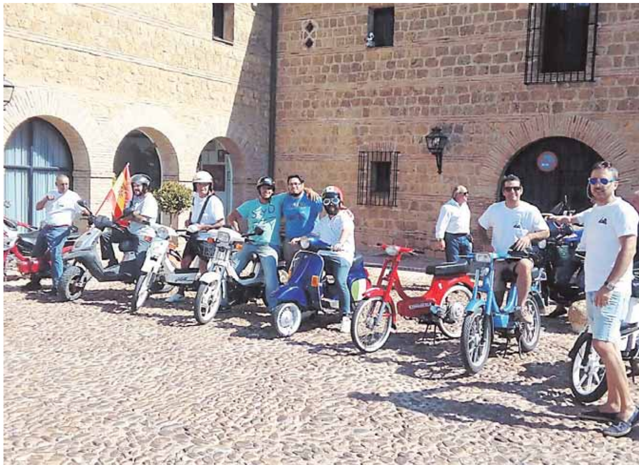
El Club del Vespino ha realizado una primera ruta por Carmona y quiere repetirlas cada mes

localidad. En concreto, los ediles franceses, que representan a municipios ubicados en el área de influencia de la ciudad de Toulouse, se han interesado por iniciativas en materia turística y patrimonial y de aquellas que inciden en el crecimiento económico.