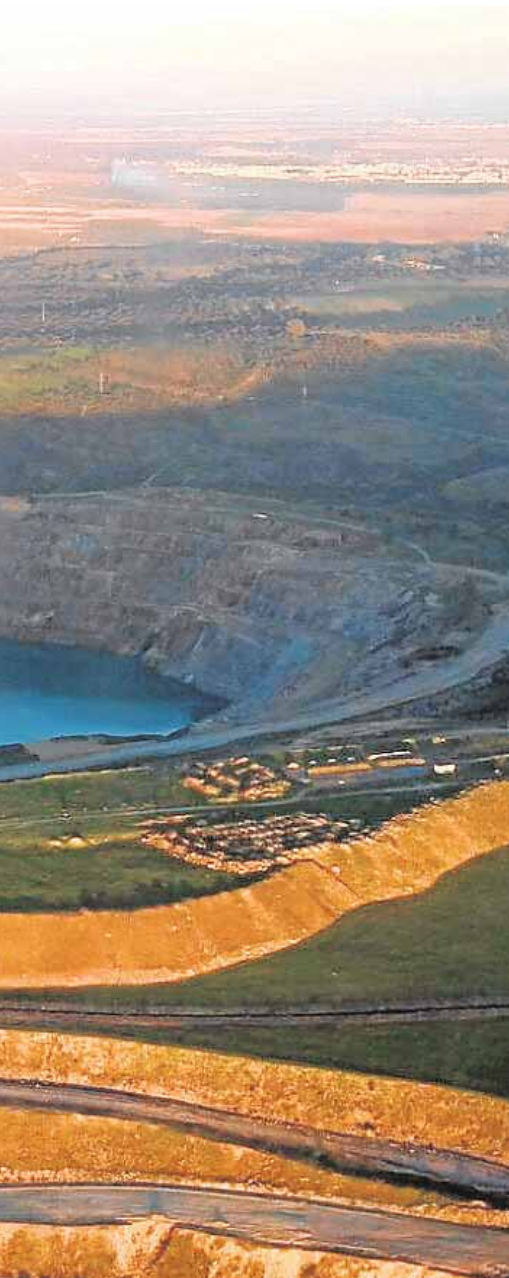
Los nichos de empleo en la comarca

y hongos presentes en Andalucía, concretamente en la Sierra Norte de Sevilla. El plazo de presentación de fotografías está abierto hasta el 18 de noviembre. Las fotos seleccionadas se expondrán en el Centro de Interpretación del Aguardiente.