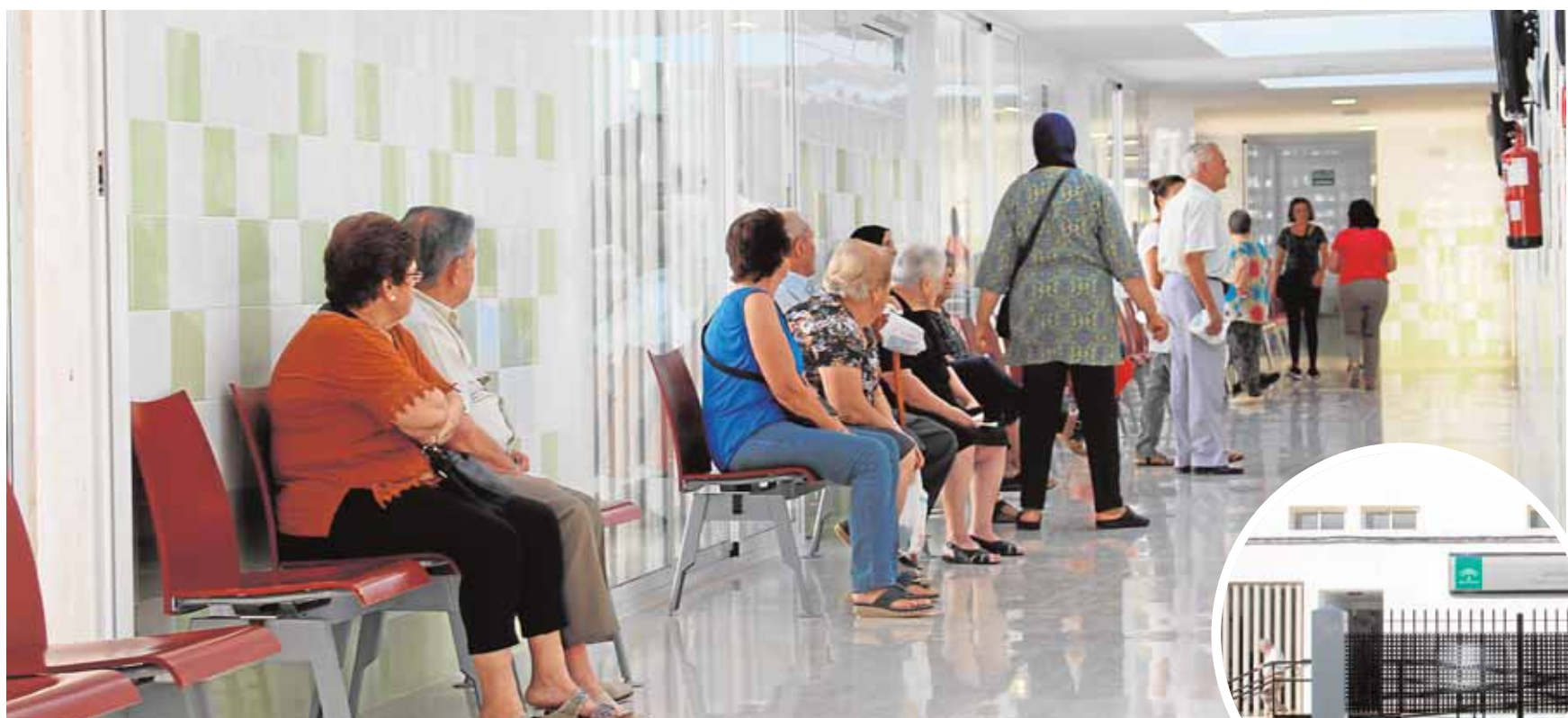
El remodelado edificio, antiguo colegio Santo Tomás, se ubica junto al recinto ferial, en uno de los accesos al municipio A.L.

Bienestar. Esta actividad, muy demandada por las mujeres fontaniegas, comienza hoy y se extenderá hasta el 30 de mayo de 2017. El precio es de 50 euros el taller completo. Las inscripciones se realizan en el Centro Municipal de Información a la Mujer.