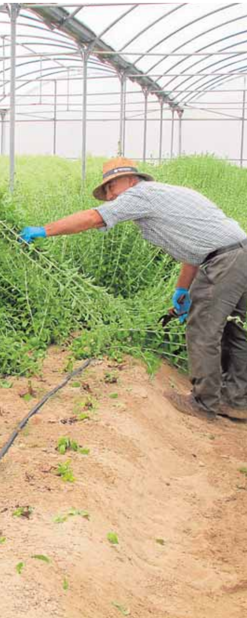
Empleo de Ajudisle A.H.