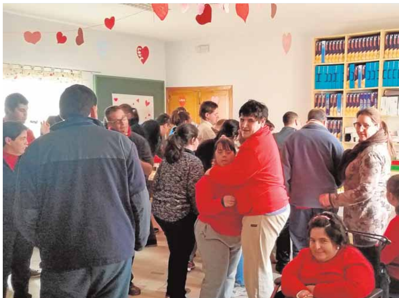
Cerca de 100 internos y familiares se benefician directamente de los programas de Avain cada año

Desde que abriera sus puertas en 2003, el centro ha atendido a más de 500 personas, entre internos con algún tipo de discapacidad, familiares, y miembros de programas derivados. Actualmente mantiene servicios como atención temprana, o una vivienda tutelada. Coordinan con centros penitenciarios para recibir «salidas terapéuticas», que costean de sus fondos, regentan un vivero, la floristería y han desarrollado un sistema de inserción laboral. La pérdida de ayudas, insisten, va a repercutir gravemente. La directora pide altura de miras a los políticos e igualdad para todos, y sentencia: «No nos merecemos que se nos mienta así a la cara».