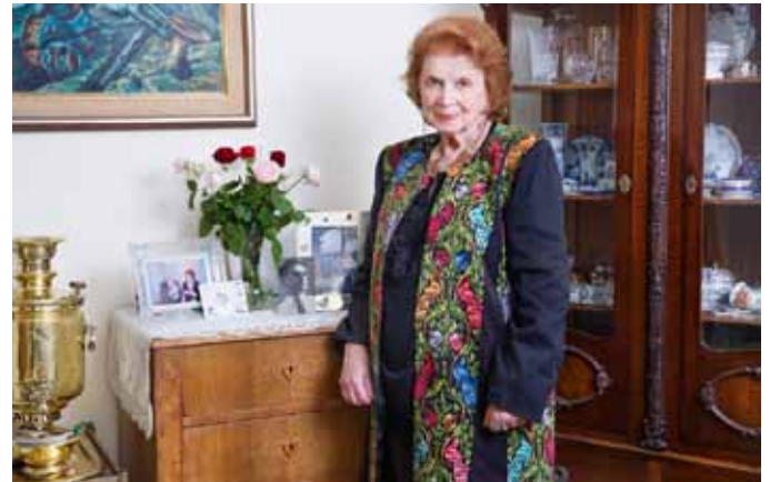
"אימא שלי היתה אישה מטופחת מאוד, ולא יצאה מפתח הבית לשוק בלי להתלבש ולהתאפר. זה הכול עניין של חינוך טוב"