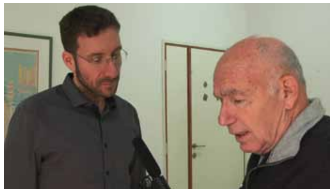
ח"כ שמולי בראיון ל"כיוון חדש"

אנחנו ניזום הפגנה מול משרדיה. זו חברה שבעלי ההון שלה לא סופרים אף אחד. ברגע האמת הם לא יהיו אתכם. הצעת - תעברו לחברות אחרות".