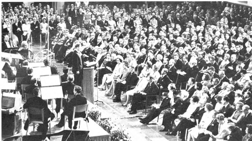
Borgmester Geir Hallgrímsson, Reykjavík, taler i rådhusshallen på jubilæumsdagen.