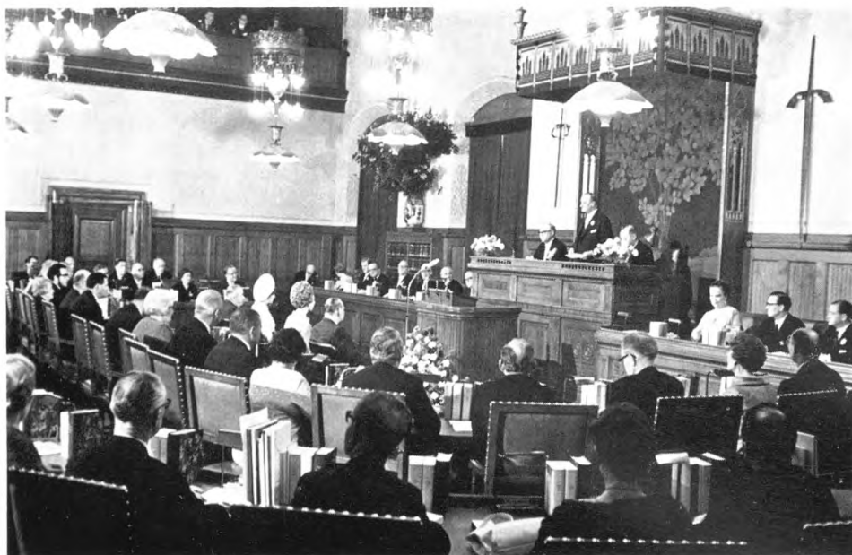
Festmødet i borgerrepræsentationen på jubilæumsdagen.

lighed for et sagligt udbytte af en sådan global konference. Udvalget foreslog i stedet, at der afholdtes en jubilæumskonference for nordiske storbyungsdomsledere.