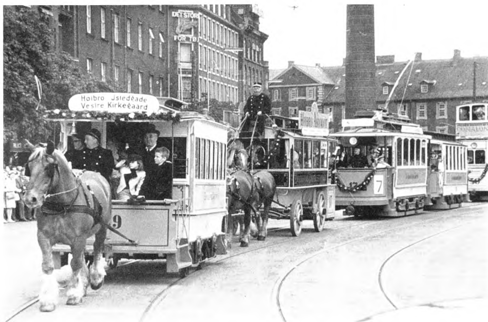
Københavns sporvejes kavalkade i forbindelse med det historiske optog.