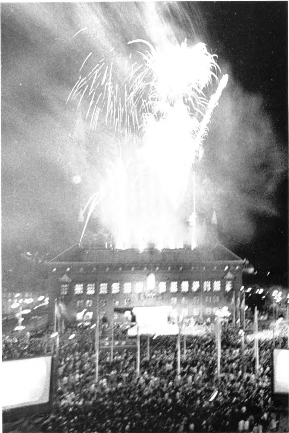
Tivolis festfyrværkeri afsluttede jubilæumsdagens festligheder.