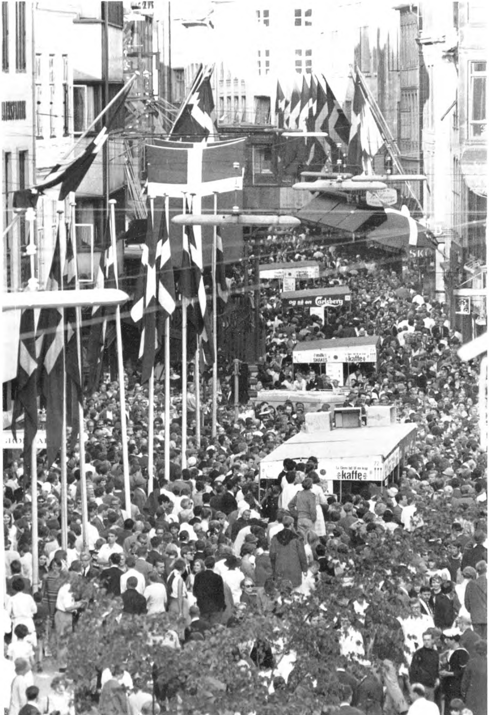
Verdens længste bord blev en meget stor succes. Det blev i det strålende sommervejr besøgt af ca. 250.000 gæster.