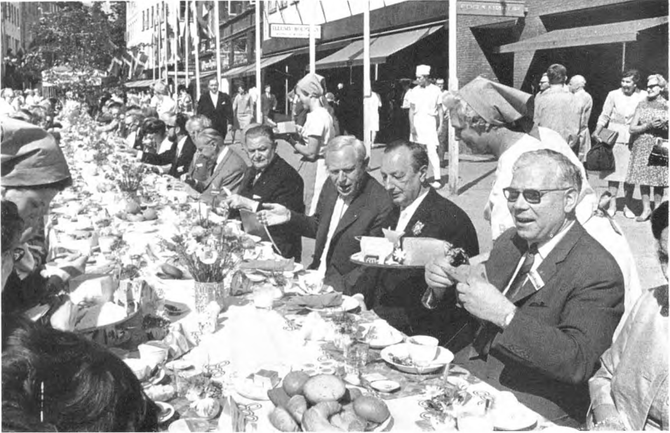
Det mejerigtige morgenbord i gågaden inden åbningen af Verdens længste bord.

Ceylon Tea Center (levering af te), Colon Emballage A/S (bakter til pandekager), Dansk Kaffekomité (levering af kaffe), Det Danske Rengøringsselskab A/S (renholdelse af gågaden), Dansk Røde Kors og A.S.F. i samarbejde med Falcks redningskorps (samaritervagt), Dansk Shell (trykning af varebons), A/S De danske Sukkerfabrikker (sukker), Dymo (skilte til personalet), Danmarks Radio (meddelelser til publikum om arrangementets forløb), Ekko Danmark i samarbejde med Dansk Papirservietfabrik (levering af servietter), Hafnia A/S (forsikringer), R. van Hauen (brød til det mejerigtige morgenbord), Haustrup Plastic (fabrikation af kaffekoppen), H. V. Reklame (prisskilte m. v.), Illums Bolighus (service til det mejerigtige morgenbord), Den kgl. Porcelænsfabrik (service til det mejerigtige morgenbord), Københavns kommune (overborgmesterens afdeling samt magistratens 3. og 4. afdeling), Københavnske sparekasser og banker (kasserere), Københavns politi, Mejeribrugets Hjemmemarkedskontor (milk-shakes og fløde samt leverancer til det mejerigtige morgenbord), Moderingen (kjoler til personalet), Orth Plast (fabrikation af drikkehornet), Papirsækkeindustriens oplysningstjeneste (opsætning af affaldssække), A/S O. Schlüntz (opstilling af borde m. v.), Store Kro, Fredensborg (levering af rådhuspandekager), Storno (radiokommunikation), Trianon (brød til det mejerigtige morgenmad),