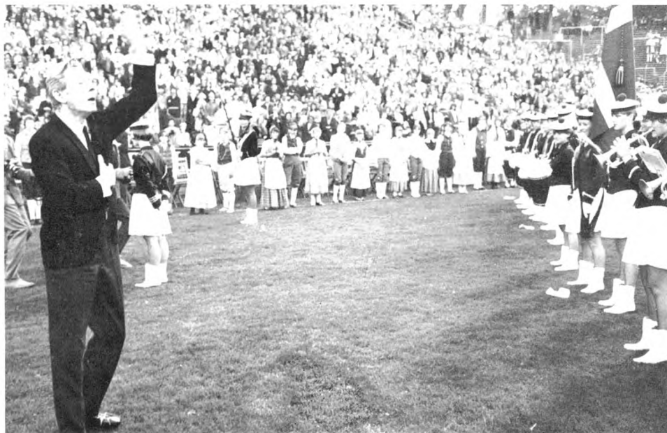
Danny Kaye dirigerer ungdomsorkestrene under Hafniadens åbning.