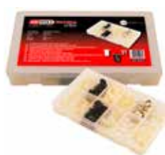
C23634 Per dadi in plastica