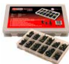
C23635 Per rivetti a vite