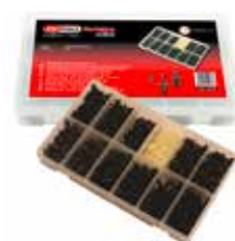
C23633 Per rivetti a pressione