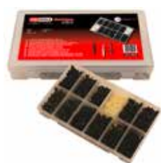
C23632 Per rivetti in plastica