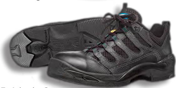
17. Arbesko 3