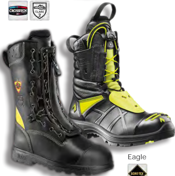
Fire Flash GAMMA

Fire HERO 2 är en brandkänga av högsta klass. Förutom optimerade funktioner ger den ett bra grepp på snö, is och vatten. Utsidan är av vattenresistent läder. Insidan är av CROSSTECH, ett material som ger ökad motståndskraft mot kemikalier och vätska samtidigt som den låter foten andas. Den är försedd med FL-Fit-System som gör det enkelt att snabbt justera snörena. HERO har sågskyddsklass 2 och är försedd med spiktrampskydd, tåhätta samt extra skydd längs med fotleden och vristen. Till kängan finns tre olika innersulor för optimal passform och support för alla typer av fötter. Som pricken över i:et har stöveln en utskjutande sula för att enkelt kunna tas av samt en namnbricka för individuell identifikation.