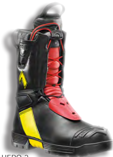
Fire HERO 2