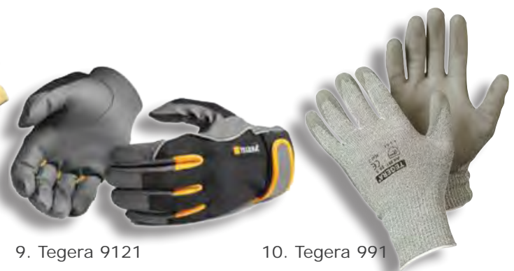
9. Tegera 9121