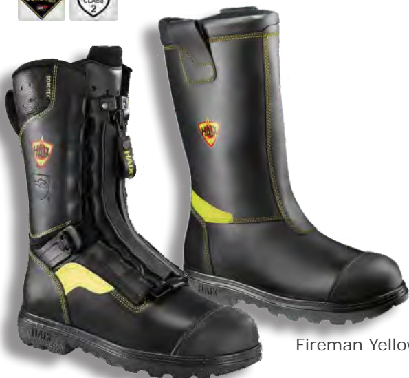
Fire Flash PRO

Eagle är en prisvärd känga med något lägre skafthöjd. Tillverkad i vattentätt läder med ventilerande insida i GORE-TEX. Försedd med tåhätta samt spiktrampskydd. En hållbar känga som är enkel att underhålla. Stängs med snörning.