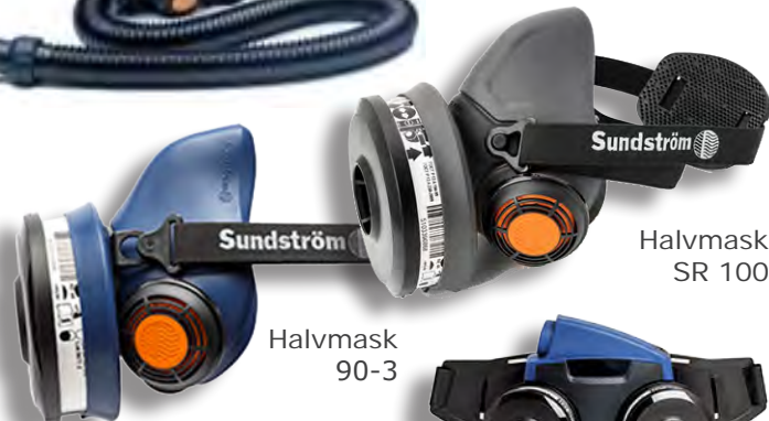
Halvmask SR 100