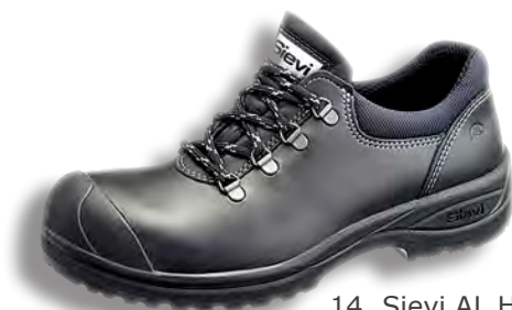
14. Sievi AL Hit3+