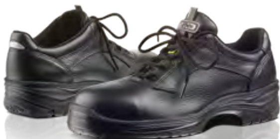
19. Arbesko 203

Skor och stövlar som håller för många mil. Stötdämpande sulor är bekväma även efter de längsta dagarna, samtidigt som ett robust ytterhölje håller dig både torr och skyddad.