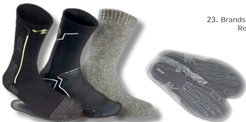
23. Brandstöver Rescue