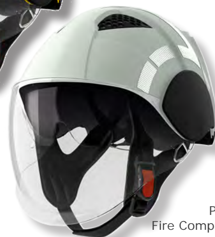
PAB Fire Compact

TIKKA/ZIPKA-SERIEN Kraftfulla, små och lätta pannlampor med LED-diod och konstant ljus teknik, dvs ljusstyrkan försämras ej med batteristyrkan. Modeller med möjlighet till större ljusspridning på nära håll tack vare en vidvinkellins.