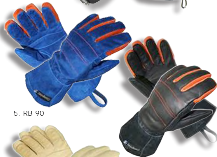
5. RB 90

10. Handske med skärskyddsklass 5, utan att göra avkall på smidighet, fingertoppskänsla och grepp. Stickad i Dyneema®fiber.