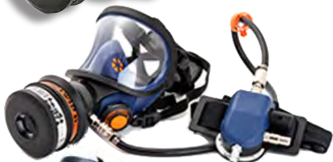
SR 200 Airline