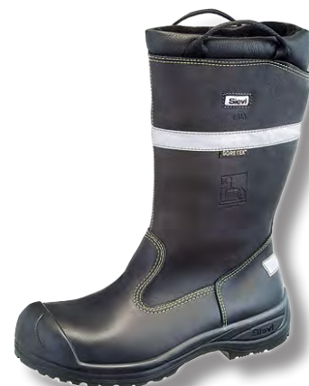
22. Brandstöver Sievi AL GT Fire

Vi har ett stort utbud av sulor, sockor och strumpor med olika funktioner. Allt ifrån luftiga och ventilerande till värmande och stötdämpande samt anpassade till skor med skyddståhätta.