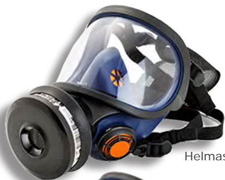
Helmask SR 200