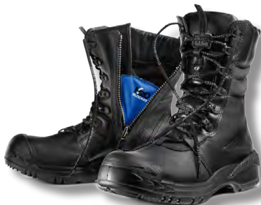
21. Arbesko 50692

21. Arbesko 50692. Ovandel i fullnarvigt impregnerat Super8-skin. Dragkedjan är försedd med H2O Blocker – en dragkedja i metall med bälg i starkt, vattentätt nylonmaterial. Reflex i skaftet, slitskydd av PU i tån och aluminiumtåhätta. Fodrad med Thermolite®. Vattenavvisande membran i fotdelen. Energy Gel Duo® ger suverän stötupptagning i både klacken och "trampet". Mjukt, metallfritt spiktrampskydd. Mycket rymlig läst.