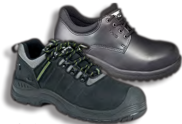
16. Granninge 7288