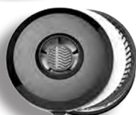
Förfilter SR 221

Ta ett djupt andetag! Skydda dina lungor från både gaser och skadliga partiklar. Med våra andningsmasker i din utrustning kan du andas ut.