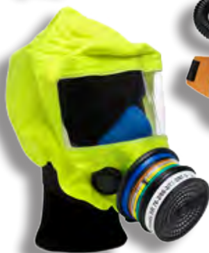
Flykthuva SR 77-2