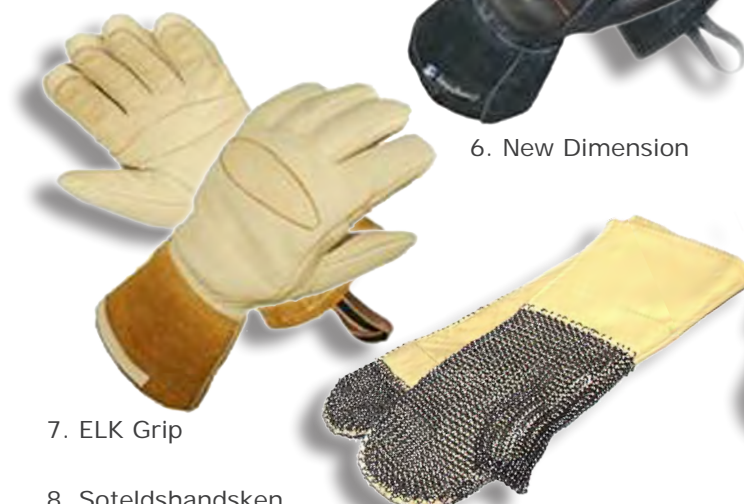
7. ELK Grip