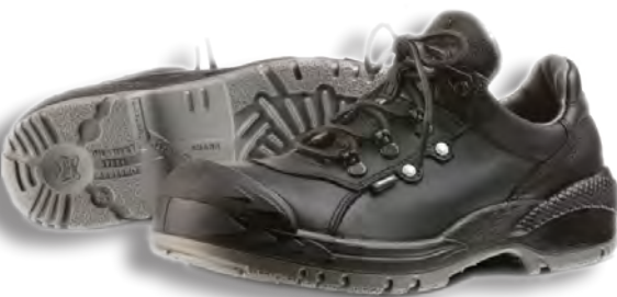
18. Arbesko 50772