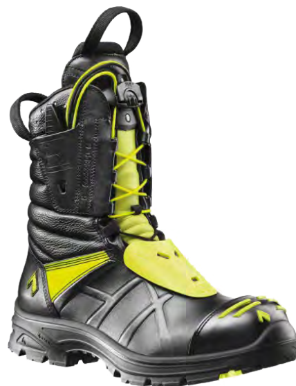
20. Arbesko 51692

20. Arbesko 51692. Varmfodrad känga i impregnerat skinn med H2O Blocker – en slitstark dragkedja med en effektiv barriär mot snöslask. Värmeisolerande Thermolite®-foder. Kängan har den nya, revolutionerande kombinationen av inläggssulan X-40 Duo och Energy Gel® 2.0 för maximal stöt-dämpning, exceptionell återfjädring och sviktkänsla - och en värmebeständig nitrilgummisula med mycket bra fäste.