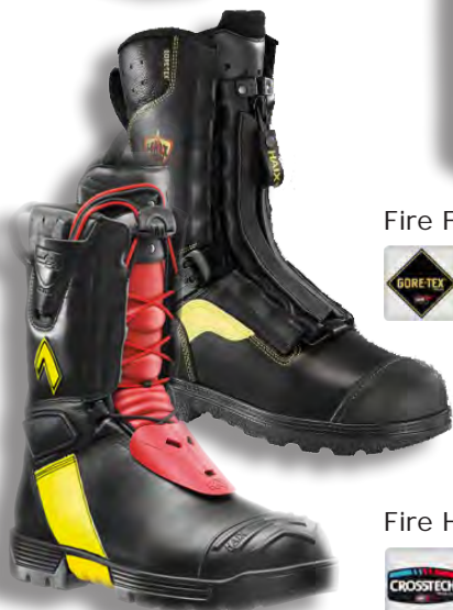
Fire Flash PRO

Skärskyddshandske Tegera 9121 med skärskydd klass 3.