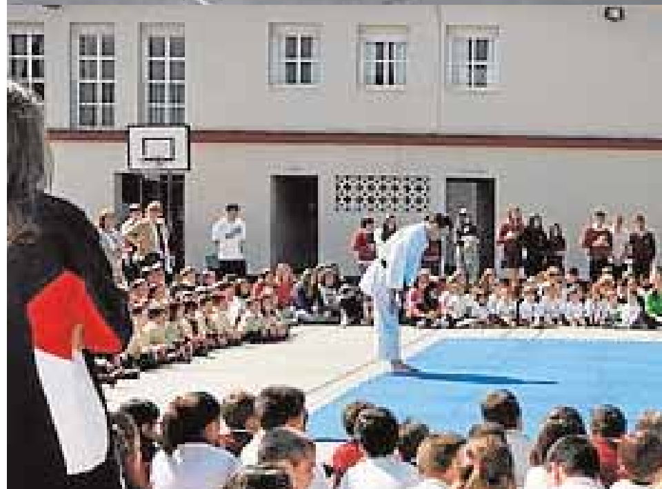
Arriba, el colegio celebra el Día de la Paz; mientras, abajo, el Club Deportivo Kimé

fisioterapia. Este año también se pondrá en marcha la Escuela de Familias para fomentar su integración en el colegio a través de talleres y charlas.