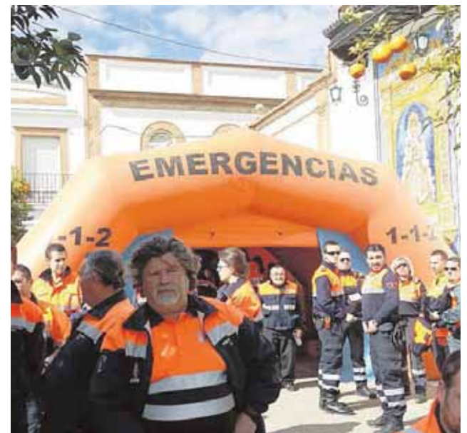
Dispositivo de Protección Civil en la Vuelta Ciclista a Andalucía