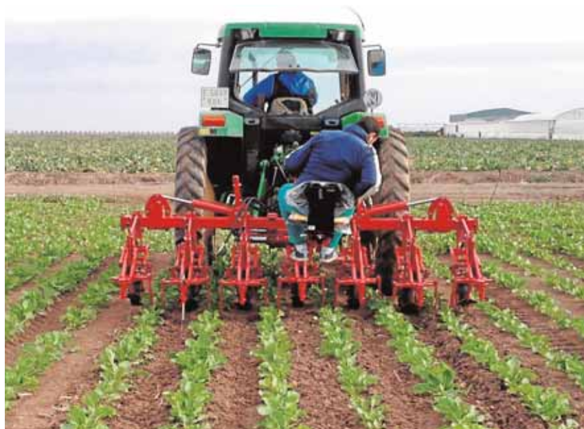
La regabina Tapia reúne unas características que la hacen única