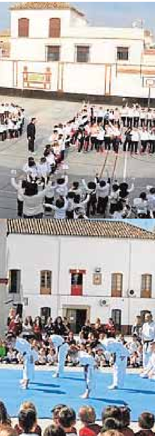
realiza una exhibición de kárate

en la Ruta Carlos III. El precio de la inscripción es 15 euros hasta el 15 de diciembre y de 19 euros a partir de esta fecha. El recorrido será de 25,8 kilómetros con salida en La Luisiana, paso por el Campillo, Cañada Rosal y meta en Écija.