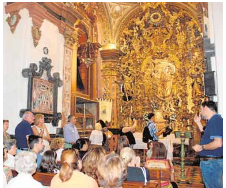
La capilla de la Virgen del Rosario en Santo Domingo

El Ayuntamiento de Écija ha recuperado tras cinco años de ausencia el programa «Écija, ciudad barroca», en el que se ofrecerá a vecinos y turistas de todas las edades un amplio abanico de actividades para fomentar el conocimiento y respeto por el patrimonio barroco de la ciudad. Así, entre los días 12 y 17 de diciembre, habrá desde visitas guiadas a escolares y adultos por diferentes edificios barrocos hasta talleres infantiles de pinturas, máscaras, etc. Como colofón, el día 17 a las 20.00 horas, tendrá lugar un concierto de música barroca en la Iglesia de los Descalzos. Las actividades son gratuitas y no precisan de reserva.