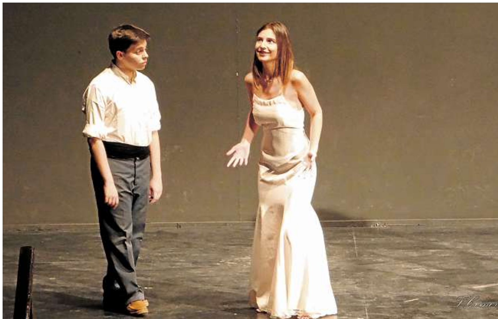
Alumnos de Primero de Bachillerato interpretan «Yerma» de Lorca en el maratón de teatro celebrado a principios de junio en Fuentes