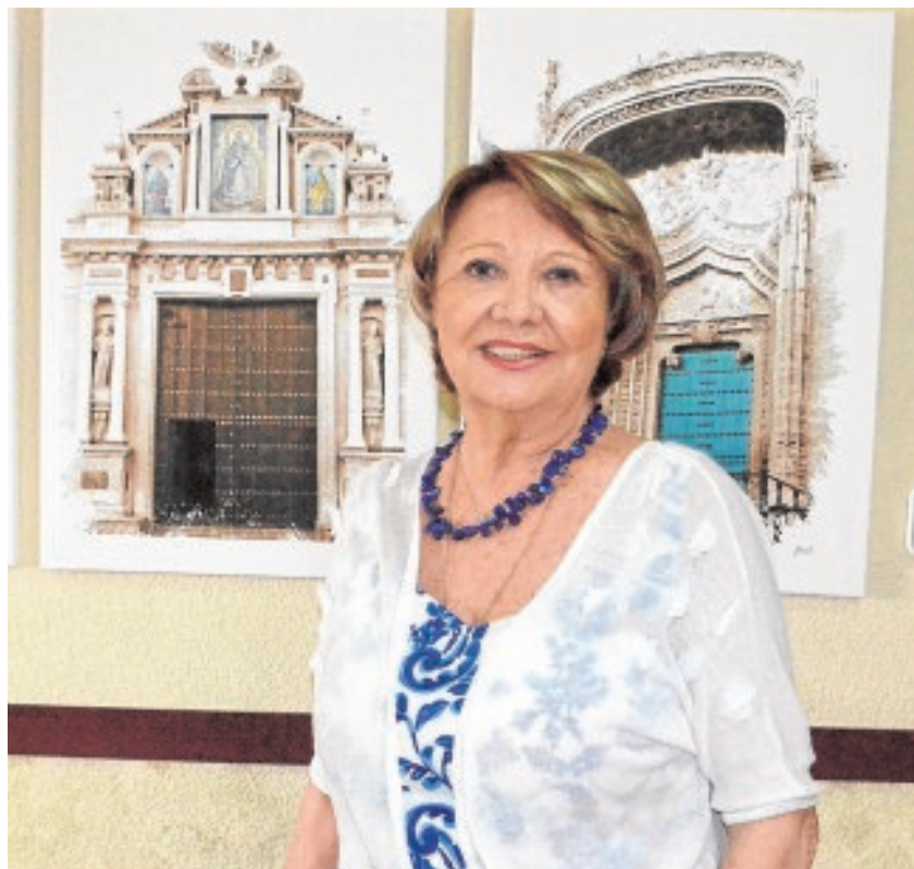
Loli es conocida también por ser la esposa del exalcalde de Utrera A.F.

Desde el año 2006 esta utreraña hiperactiva que tiene cuatro hijos y dos nietos a los que adora, lleva adelante un verdadero reto en los tiempos que corren, como es el de dirigir la asamblea local de Cruz Roja. Tomó el