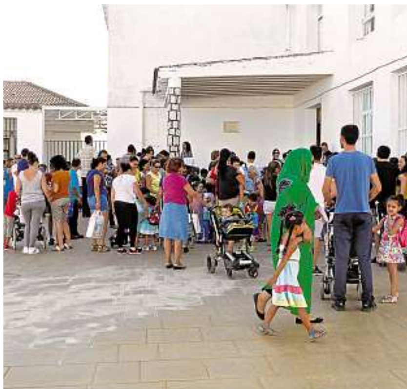
Padres llevando a sus hijos al centro escolar de Santa Teresa

Con respecto al personal que mantendrá en funcionamiento este servicio se van a mandar las ofertas al Servicio Andaluz de Empleo, y servirá para contratar a ocho desempleados en puestos como cocinero, pinche, maestros, monitores o psicopedagogos que además de trabajar prestarán un servicio solidario.