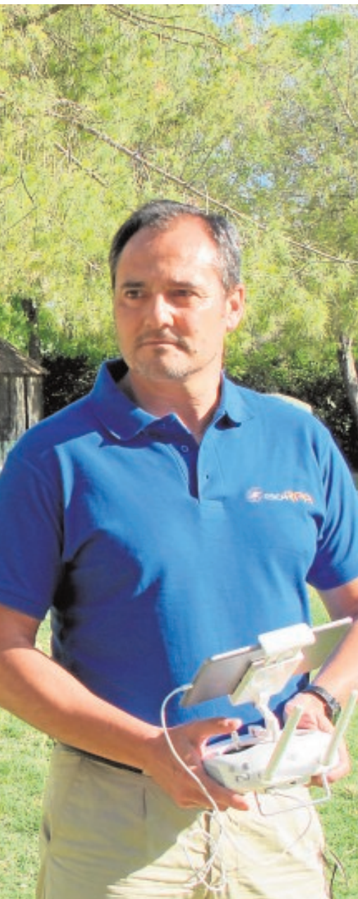
San Benito A.H.

un clásico del verano de esta localidad sevilla está organizado por la Hermandad de la Vera Cruz, la Agrupación Divina Pastora, la aecc Contra el Cáncer, la Asociación Coronil por un Sahara Libre y el C.D. Coronil. F.R.M.