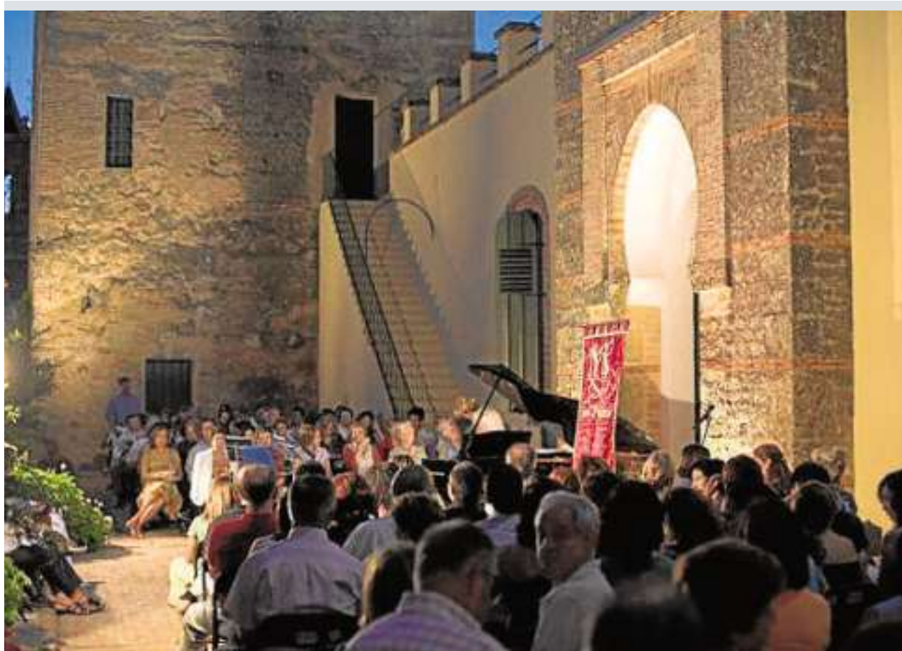
Las siete ediciones anteriores se saldaron con casi un lleno absoluto en el patio de armas del Castillo

pública su continuidad a través de una segunda edición que se celebrará en octubre de 2017. Como novedades para la segunda edición, Maigamers adelanta que se ofertarán más plazas, un total de 300, y se ampliarán actividades y colaboraciones.