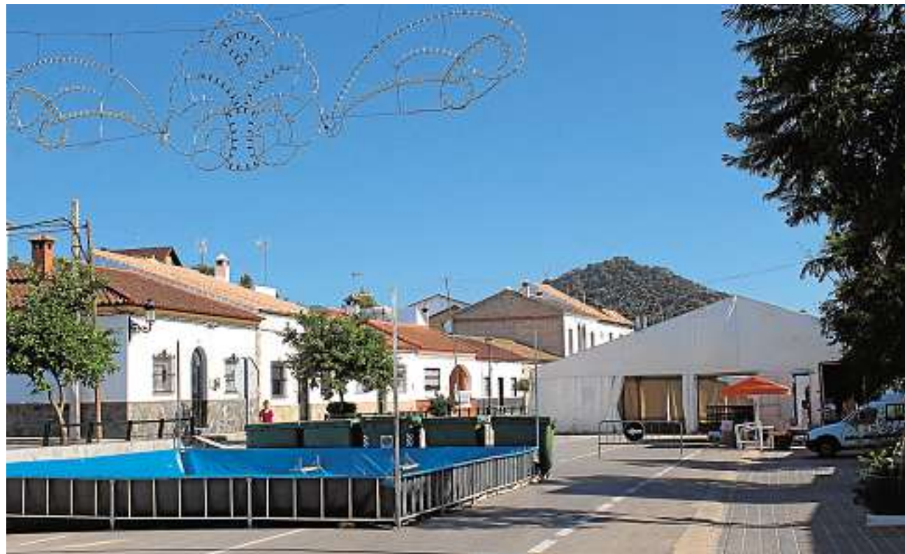
La caseta municipal es el centro neurálgico de la Feria de Coripe

Así pues, Coripe vivirá sus tres días de Feria con multitud de espectáculos entre los que se incluye el tradicional «toro de fuego», una coraza con forma de toro que va lanzando fuegos artificiales, la elección de la Reina, las Damas y Míster de la Feria y más actividades que concluirán el domingo con un castillo de fuegos artificiales.