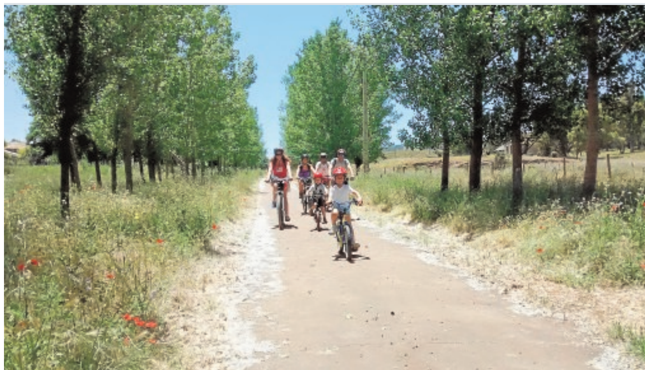
Las rutas ciclistas organizadas por «La Bicicleta Roja» son para todos los públicos

concesión de subvenciones dirigidas a la creación de empresas para jóvenes agricultores. Estas ayudas se enmarcan dentro del Programa de Desarrollo Rural de Andalucía 2014-2020 y el plazo de solicitudes finaliza el 25 de septiembre. A.C.