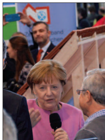
Viel Prominenz am Stand der Dachdecker.

jeden Fall auch online im Fokus: Die regelmäßigen Postings auf der Facebook-Seite der Bayerischen Dachdecker – meist live-Eindrücke der LIV-Pressestelle – haben fast 21.000 Personen erreicht.