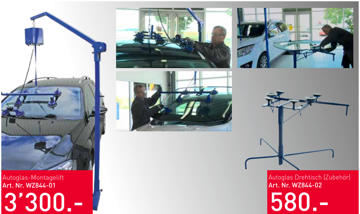
Autoglas-Montagelift Art. Nr. WZ844-01