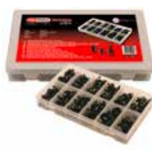
C23635 für Einschraubnieten