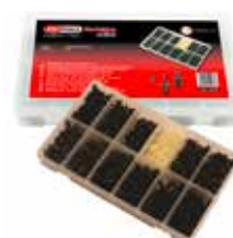
C23633 für Eindrücknieten