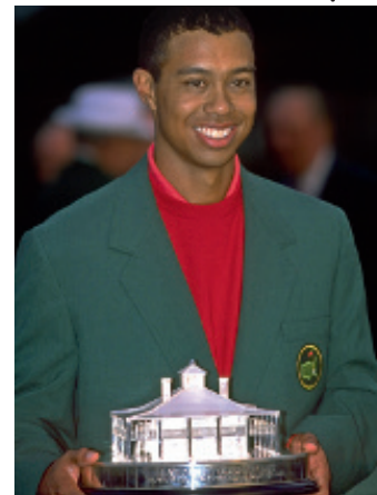
Tiger Woods vor 20 Jahren: Erster Major-Sieg in Augusta