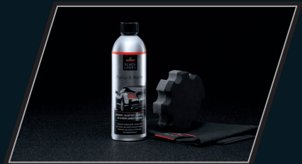
Politur & Wachs Set