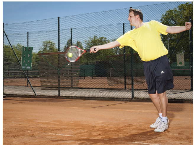
12 Tennis-Silvesterturnier 31. Dezember 2015, 12.00 Uhr - 14.00 Uhr Tennisanlage Henstedt, Bgm.-Steenbock-Str.