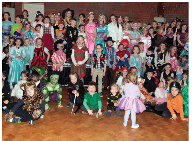
01 Kinderfasching 30. Januar 2016, 15.00 Uhr - 18.00 Uhr Bürgerhaus Henstedt-Ulzburg