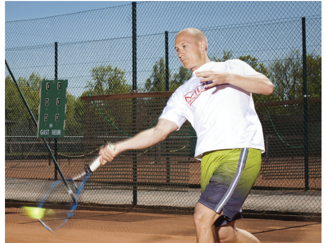
12 19. Tennis-Advent-Turnier (5-17 Jahre) 06. Dezember 2015, 14.00 Uhr - 16.00 Uhr Tennisanlage Henstedt, Bgm.-Steenbock-Str.