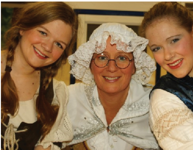
12 Weihnachtsmärchen 13. Dezember 2015, 11.00 Uhr Alstergymnasium Forum