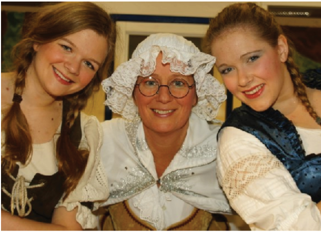
12 Weihnachtsmärchen 05., 06. & 12. Dezember 2015, 15.30 Uhr Alstergymnasium Forum