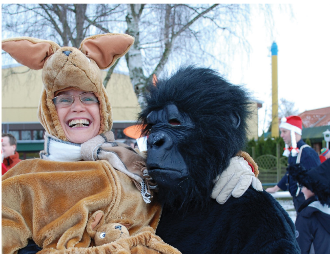
12 Silvesterlauf 31. Dezember 2015, 14.00 Uhr Beckersbergstadion