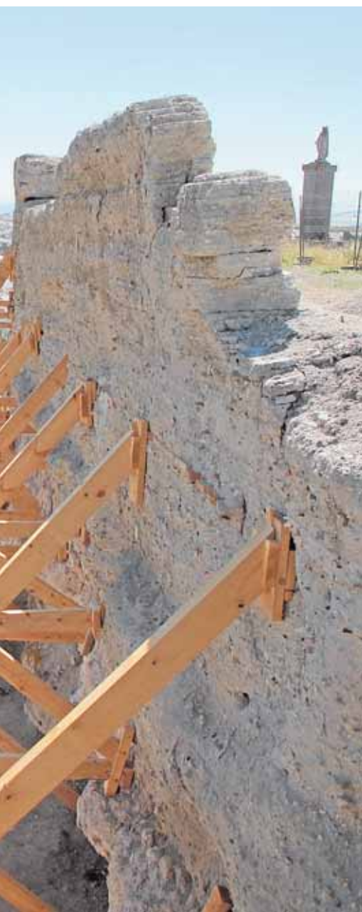
o andamiaje de vigas de sujeción

cursillos de natación, polidivertido y abonos de la piscina municipal, visitas culturales, baloncesto o voleibol, entre otros. Los interesados deben dirigirse al pabellón Enrique Lora antes del 25 de junio en horario matinal. F.R.M.