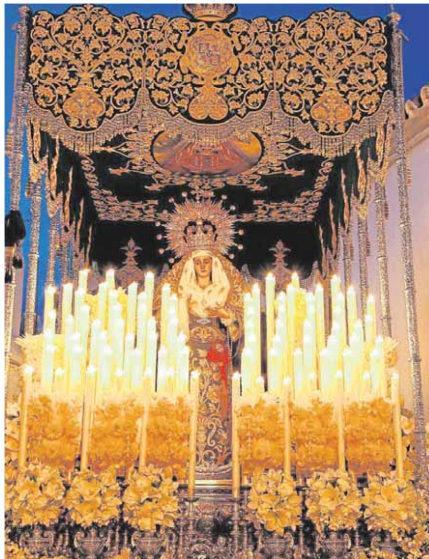
La Virgen de la Esperanza procesionará en su paso de palio

La Virgen saldrá de su templo a las 18:45. Una iglesia vinculada con la corporación desde sus orígenes, cuando fue fundada por el gremio de tintoreros de Carmona al que para pertenecer era obligado ser hermano de la corporación. En la antigua iglesia que se vino abajo cuando estuvo en el convento de Madre de Dios y volvió al nuevo templo del Sal-