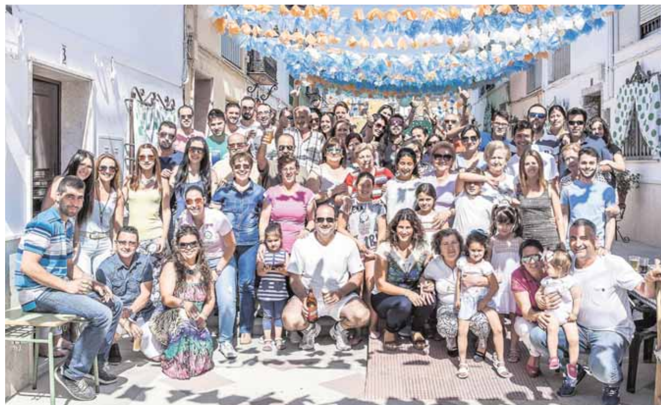
Las calles del Pantano ya están adornadas y listas para la XXXII Verbena Popular

Esas ganas de pasarlo bien se contagian, ya que, gracias al ambiente que se respira y a la gran organización, la Verbena Popular del Pantano recibe cada año la visita de miles de habitantes de los pueblos vecinos, convirtiéndose prácticamente en la feria de un pueblo pequeño. «Entre vecinos propios del Pantano, de otros barrios de Morón y los visitantes de fuera, se puede llegar a 10000 personas». Una multitud que disfrutará con la pequeña feria del Pantano, que comienza hoy.