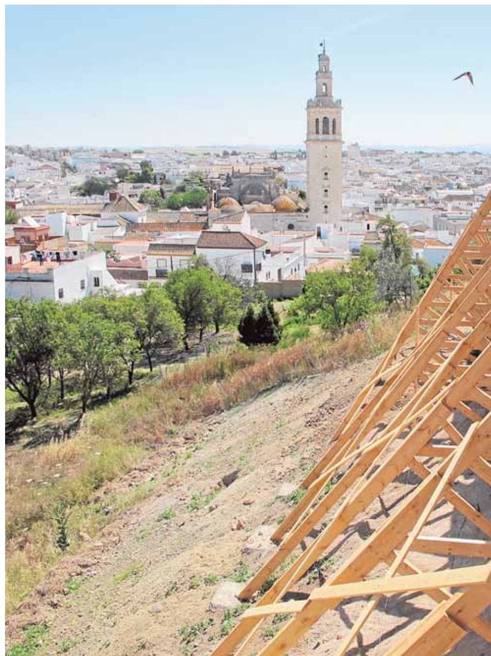
La imagen clásica de las murallas del castillo se ha visto alterada por un intrincado

«Se trata de una intervención con carácter de urgencia ante el peligro de deterioro y pérdida patrimonial», sub-