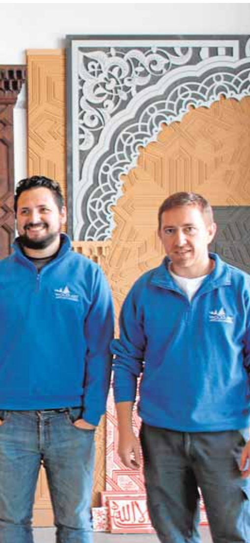
Un andalusí en material de vanguardia A.L.

diar y hacer sus deberes al mismo tiempo que se divierten, hacen deporte y despiertan su creatividad en compañía. Las plazas se otorgarán por orden de inscripción en los Servicios Sociales de La Luisiana y la Tenencia de Alcaldía de El Campillo.