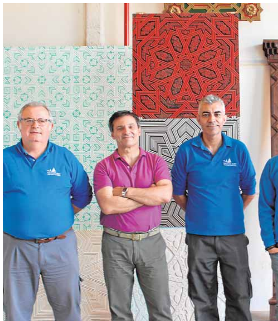
El equipo de Woodart World rodeado de algunos paneles decorativos de inspiración

Su apuesta por el diseño de paneles decorativos con material resistente atrae las miradas de Oriente Próximo