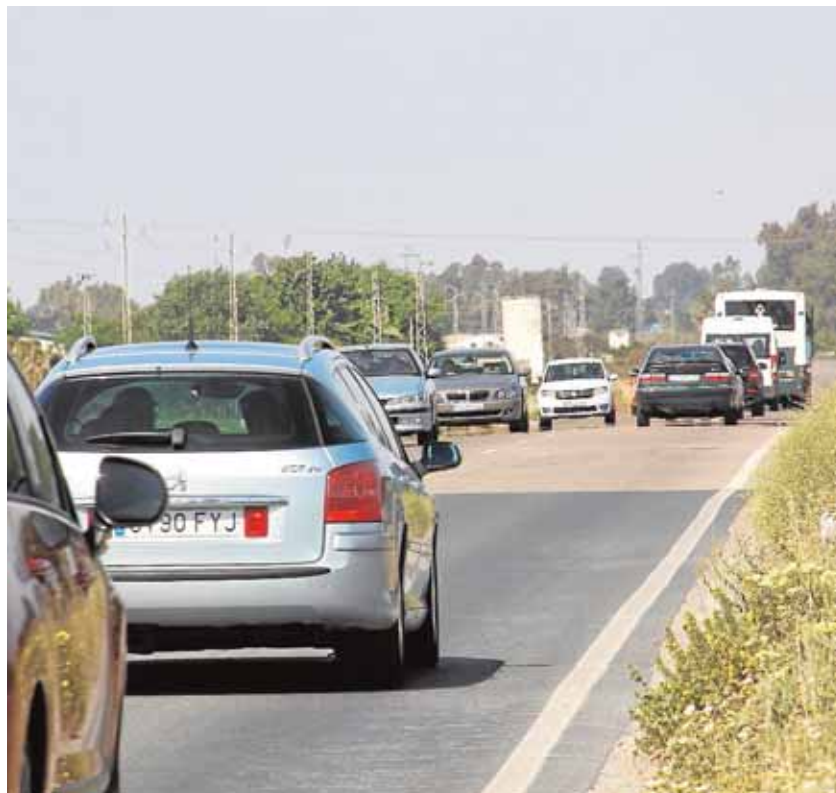
Tramo en el que se diferencia el término palaciego del utrerano

Otro de los asuntos tratados en la reunión con el delegado de Fomento fue el relativo al Plan Andaluz de Rehabilitación de Viviendas 2016-2020. En ella, se ha reclamado un nuevo impulso para la rehabilitación y la puesta en marcha de nuevos programas en coordinación con los ayuntamientos. Para la ejecución de éstos será necesaria la elaboración y aprobación de un Plan Municipal de Vivienda que englobe los programas de Rehabilitación con el número de demandantes actualizados en el Registro Municipal.