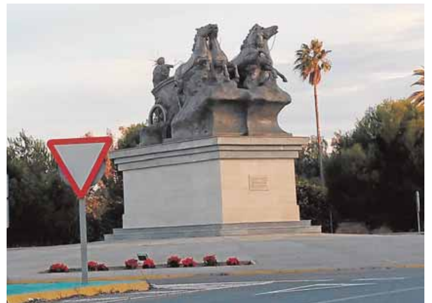
Detalle de la cuádriga, dotada de zona ajardinada e iluminación

El proyecto lleva por nombre «La Ciudad Amable», y Sanlúcar la Mayor ha sido una de los 52 municipios seleccionados para ejecuciones de obras por este programa al que se habían adherido 382 municipios, entre ellos Sevilla capital, que no ha conseguido ninguna dotación económica para su propuesta.