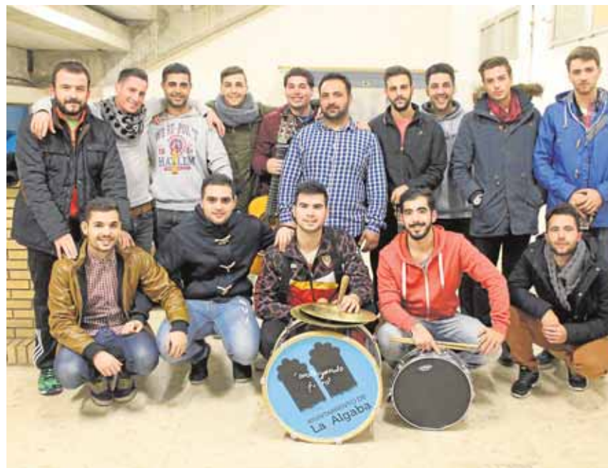
Integrantes de la comparsa «Vida» de La Algaba