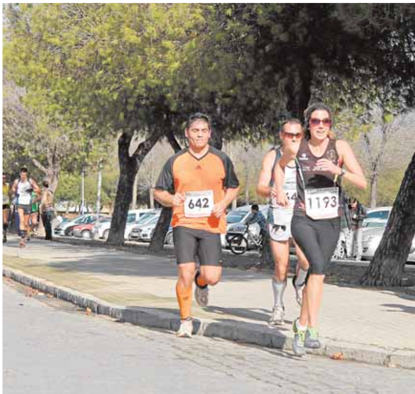
Los atletas cubrirán casi 26 kilómetros en su recorrido

Se estima que los corredores comiencen a llegar a la línea de meta a partir de la 12.15 horas. El desarrollo de la carrera se podrá seguir este año a través de la aplicación GeoPol de la Policía Local de Écija. La inscripción individual puede realizarse hasta hoy día 7 de enero a través de la página web de la Ruta Carlos III o por grupos en la página del organismo de Juventud y Deportes de Écija.