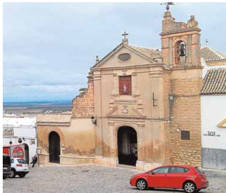
La fachada del monasterio de la Encarnación.

El pasado lunes se celebró en la localidad la VII edición de la entrega de becas en apoyo a estudios postobligatorios. El consistorio aprovecha las fechas navideñas para hacer entrega a los jóvenes pedrereños que solicitan estas ayudas, y que en el curso 2014-2015 ascendieron a 241. Entre todas estas ediciones se han destinado 95.100 euros para becar a jóvenes que cursan estudios de grado medio o superiores y a los alumnos matriculados en el Conservatorio de Enseñanzas Artísticas. El equipo de gobierno ha adelantado que en el próximo presupuesto municipal se incluirá una partida para becas de apoyo al estudio de idiomas. B.M.