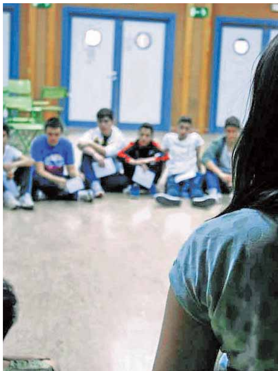
Los adolescentes participan en talleres de expresión, danza o escritura para fomentar