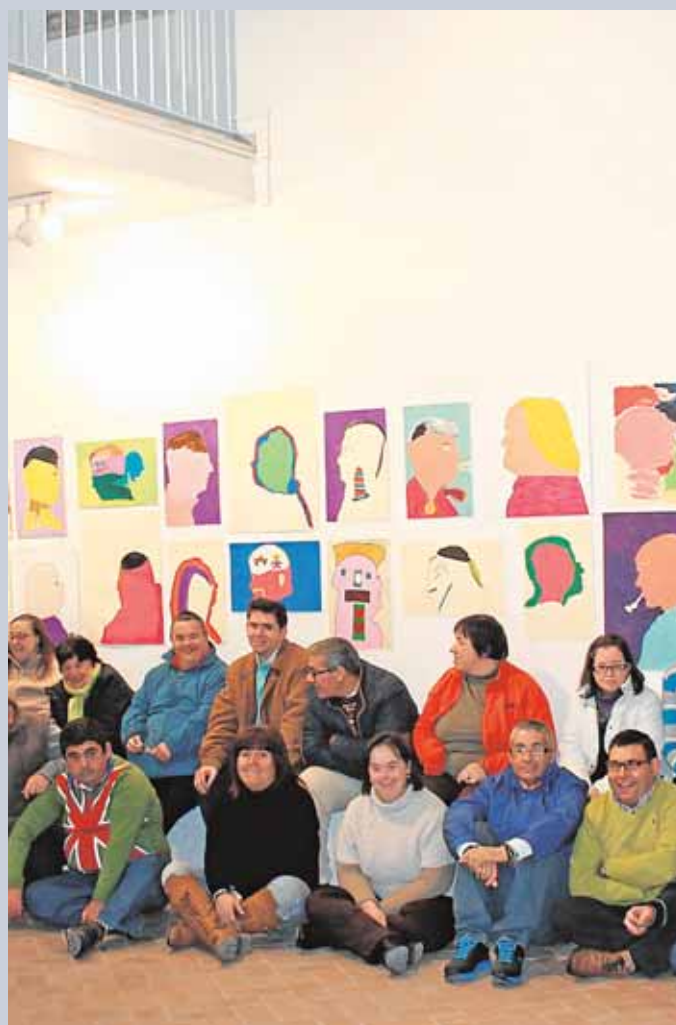
JUAN LUIS MÁRMOL

Este fin de semana será el último para visitar la exposición «Barbie y la historia de la moda» que acoge el Museo Histórico Municipal de Écija, en la que se muestra a la famosa figura caracterizada como diferentes personajes ilustres y representativos de la historia y vestida con piezas únicas. Hasta el 13 de enero en el Museo Histórico Municipal de Écija.