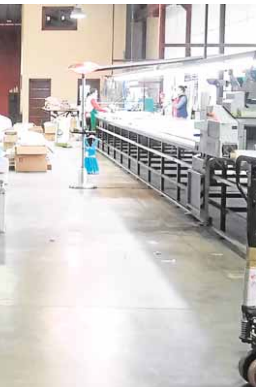
moda infantil, Nekenía

En su sala de montaje se crean los prototipos de los nuevos diseños que posteriormente se enviarán a los talleres para cada nueva colección. En este periodo sus ventas han llegado a países como México, Estados Unidos, Escocia, Portugal o Reino Unido.