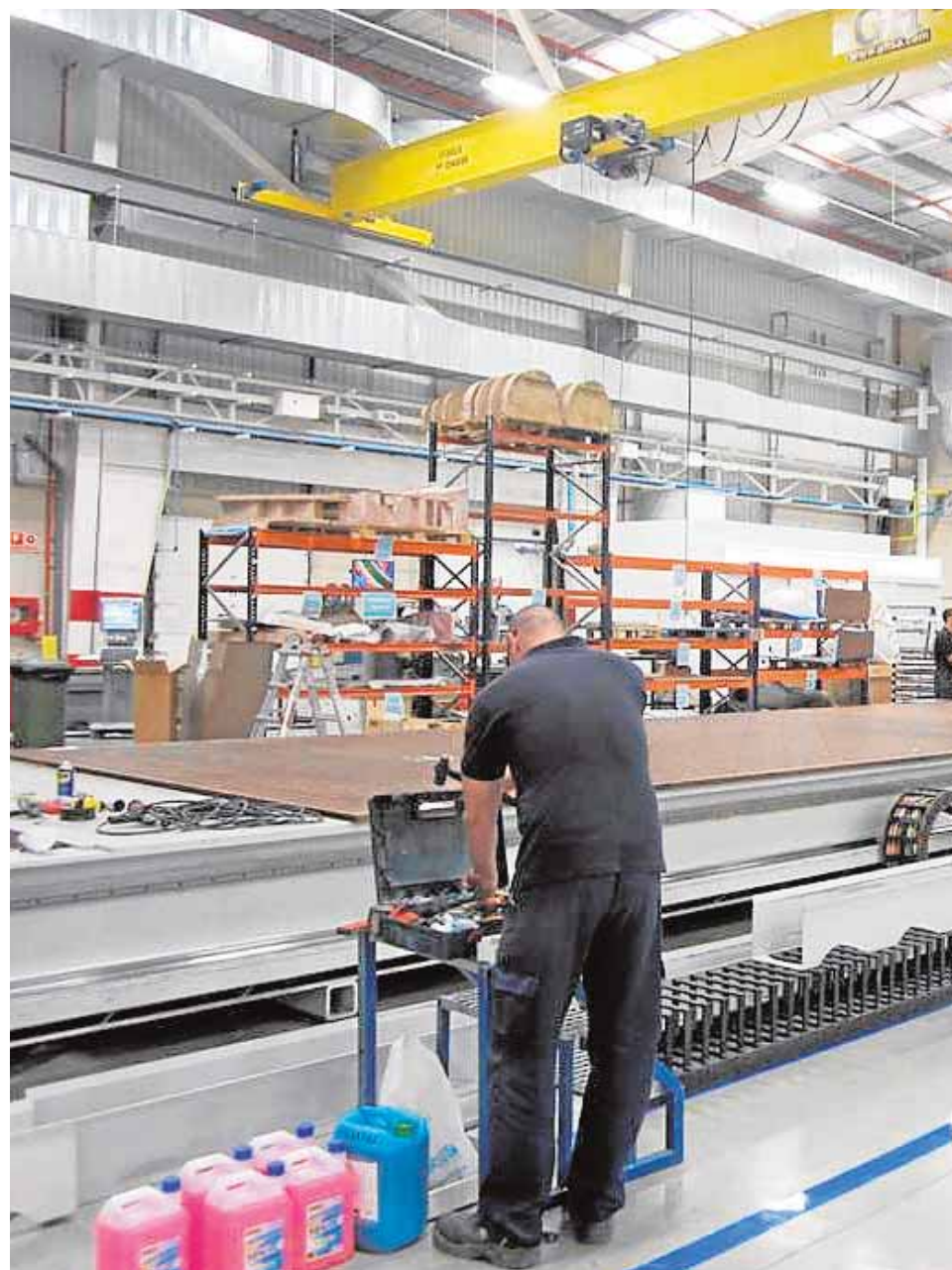
En el Parque Logístico trabajan ya 700 personas y se espera que su número crezca

La llegada de estas empresas es posible por el nuevo planteamiento desarrollado por el Ayuntamiento de Carmona. Para ello, se han modifica-