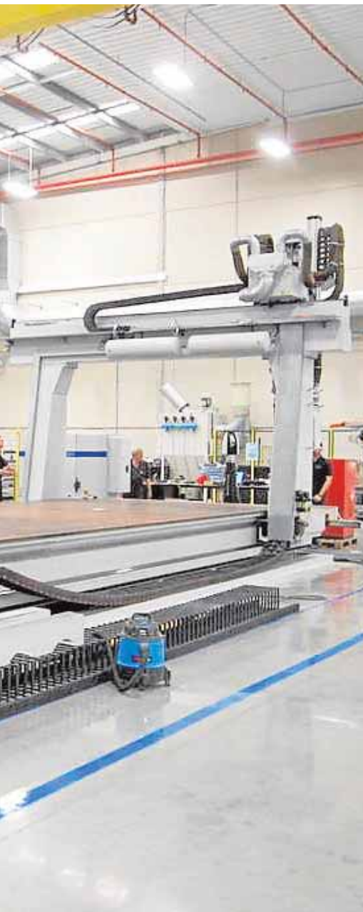
en los próximos años

padezcan problemas socioeconómicos, carezcan de recursos y acrediten la situación de desempleo. También jóvenes con dificultades sociales que les impidan continuar con sus estudios y mujeres en situación de riesgo de exclusión social.