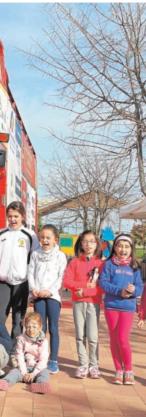
«SOS Bus» y su particular Cartero Real

Casa de la cultura abrirá sus puertas a partir de las 17 horas para que el emisario de los Reyes Magos de Oriente recoja las cartas con los deseos y los regalos de los más pequeños. Para la ocasión se hará un taller de pintacaras y habrá golosinas. B.M.