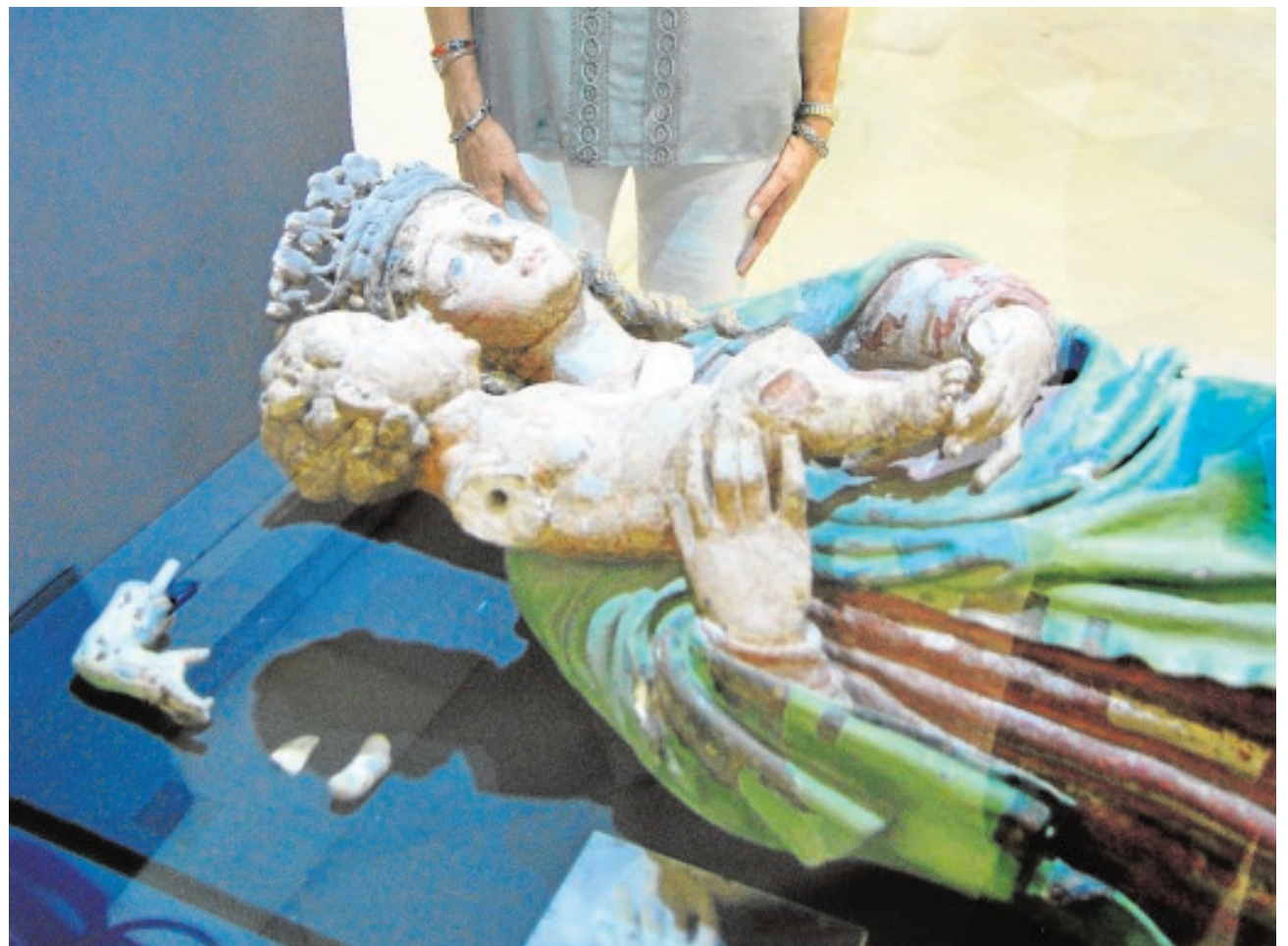
La Virgen es una original talla en piedra que se remota a finales del XV o principios del XVI

Sería necesario ahora seguir con los estudios analíticos y realizar una restauración integral de la talla para devolverle su aspecto primitivo y reintegrar las partes perdidas y limpiarla y fijar la policromía original. La obra lo merece por su historia, su valor artístico y su singularidad en el conjunto patrimonial de Sevilla.