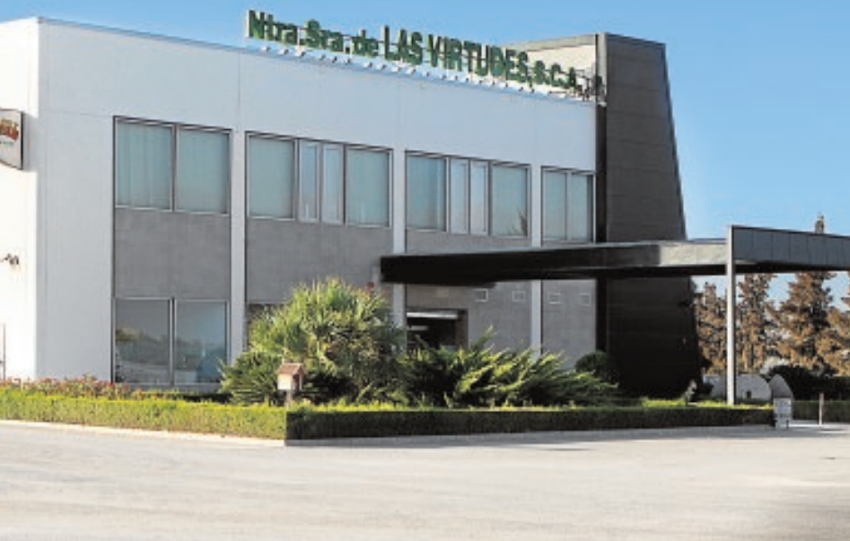
Virtudes, en La Puebla de Cazalla