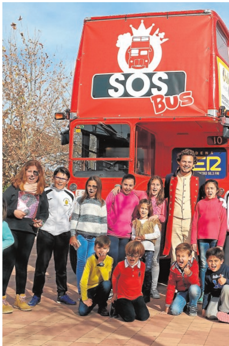
Los niños de Herrera y Estepa han sido los primeros en recibir la visita del «SOS Bus»

El alma de Cruz Roja Desde la organización comarcal advierten sobre la necesidad de voluntarios para ayudar a más familias