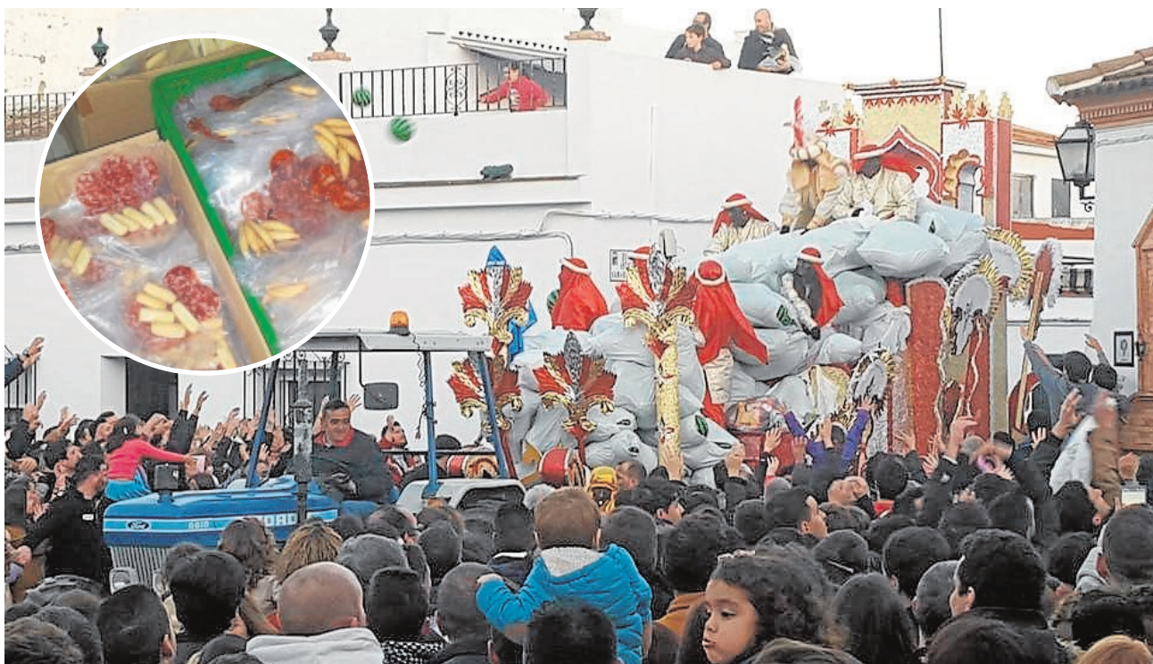
Imagen de la peculiar cabalgata de Villanueva del Ariscal, una de las más seguidas del Aljarafe sevillano

que implicará la revisión de diversos conceptos como las cláusulas y legalidad de los contratos, la relación de los adjudicatarios, la revisión de los contratos de suministros eléctricos y de agua y el valor del alquiler, entre otros.