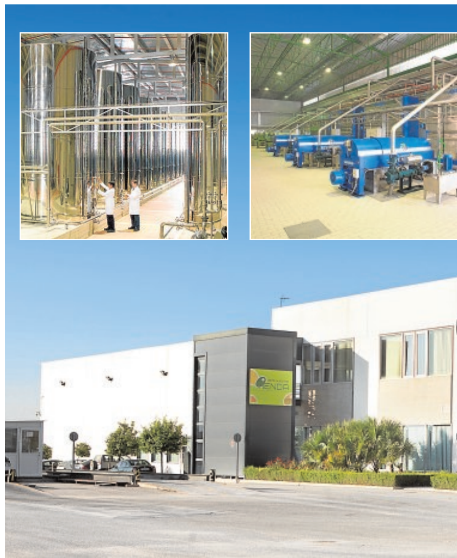
Exterior e interior de las instalaciones de la cooperativa de Nuestra Señora de las Virtudes

Son los medios por los que se pueden adquirir los productos que desarrolla «Nuestra Señora de las Virtudes», que incluyen los aceites y aceitunas de mesa. Lo hacen con un volumen de producción que se acerca cada año más a los veinte millones de