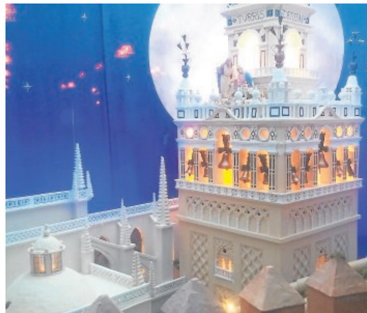
El restaurador ha realizado una réplica de la Giralda

El área de Igualdad y Cultura de La Roda de Andalucía ha puesto en marcha un proyecto que se centrará en las mujeres de la localidad y en su importancia en la vida e historia del municipio. Desde esta semana y hasta el próximo 3 de febrero se recopilarán fotografías de mujeres que servirán para dar forma a la exposición Historia de la mujer en La Roda. Todas las personas que deseen podrán llevar fotos de mujeres que podrán ser antiguas o actuales, y de mujeres de todas las edades y de todos los ámbitos sociales, culturales o laborales de la localidad. Las instantáneas se deberán entregar en el consistorio o en Servicios sociales. B.M.