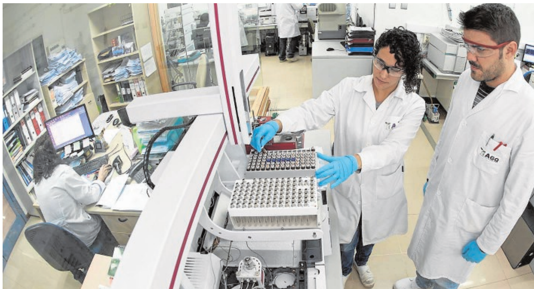
La compañía AGQ emplea a 134 personas en Sevilla y tiene su laboratorio químico en el término municipal de Burguillos

característicos de la gastronomía de la comarca de la Vega del Guadalquivir y actividades de animación infantil de 12 a 20 horas. Los coros del Rosario (esta tarde a las 18 horas) y del Gran Poder (mañana a las 18 horas) dinamizarán las jornadas. J.C.R.