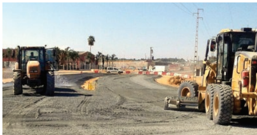
Imágenes de algunas de las obras ejecutadas por la Junta durante este año 2016

con la zona occidental de la Sierra Sur al conectar con la A-92. La vía cuenta con una longitud de 17 kilómetros y las obras permitirán incrementar su seguridad vial y la confortabilidad en la conducción.