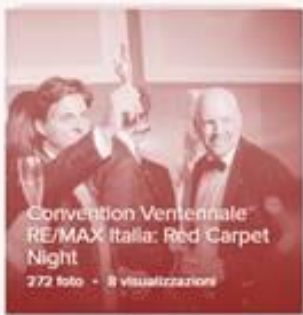
Convention Ventennale RE/MAX Italia: Red Carpet Night 772 foto - 8 visualizzazioni