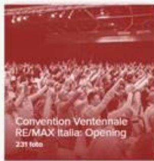
Convention Ventennale RE/MAX Italia: Opening 221 foto