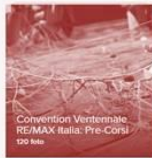
Convention Ventennale RE/MAX Italia: Pre-Corsi 120 foto