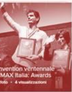
Convention Ventennale RE/MAX Italia: Awards 172 foto - 4 visualizzazioni