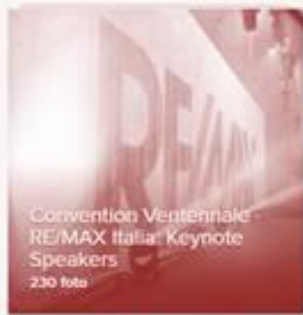
Convention Ventennale RE/MAX Italia: Keynote Speakers 230 foto