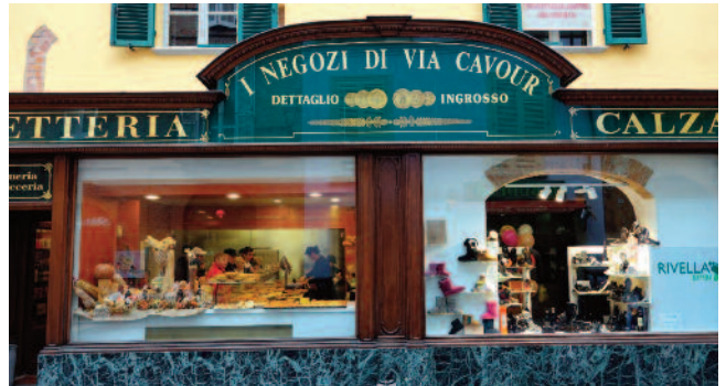
Dachdecker auf Feinschmecker-Tour in Alba.

Am Freitag stand zunächst die Stadtführung auf dem Programm. Sie begann mit dem Besuch des riesigen Mailänder Friedhofs Cimitero Monumentale. Weiter ging es mit dem Bus in die Innenstadt zum Mailänder Dom. Wie es sich für Dachdecker nun mal gehört, wurde auch das Dach erklimmt, von dem aus sich eine einzigartige Aussicht bot. Die Stadtführung endete an der Einkaufspassage Galleria Vittorio Emanuele II und mit einem Abstecher zur Mailänder