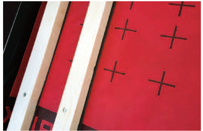
Zwei Tage lang Tipps und Tricks von Profis: die korrekte Nageldichtung im Detail.

Start für die Weiterbildung aller Ausbilder war dann am 19.12.2016. Nach dem einführenden Vortrag von Jürgen Lehner zur konzeptionellen Ausrichtung des ÜBL stellt Lothar Zieglmeier die Zwischensparren-