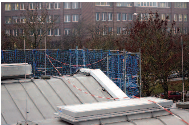
Absperrketten markieren die 2-m-Randbereiche zur Dachkante.

sein muss. In einem zweiten Sperrbereich ist der Standplatz des Material- und Werkzeugcontainers. Auch in dem eigentlichen Baubereich auf dem Dach herrscht doppelte Sicherheit. Zusätzlich zu den erforderlichen Geländern wurden Schutznetze montiert, die jeweils nur die beiden Eingangsbereiche zu den Treppentürmen offenlassen. Von den hier beschäftigten Dachdeckern werden diese Treppentürme übrigens sehr begrüßt, weil sie es ermöglichen, auch kleinere Materialmengen wie eine Rolle Bitumenbahn bequem und sicher aufs Dach zu bringen. Das Standgerüst mit seiner doppelten Laufbohlenbreite ist durch zusätzliche schmale Laufgitter zur Fassade hin abgesichert. „Hier gibt es keinen Spalt zwischen Gerüst und Fassade von mehr als 15 cm“,