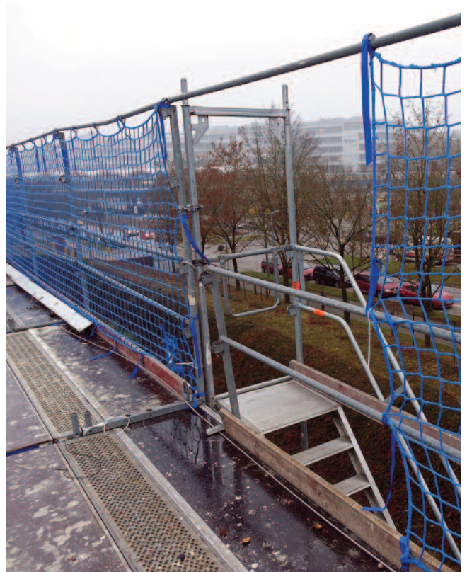
Zwei Treppentürme erleichtern den Dachdeckern den Transport von kleineren Materialmengen zur Baustelle.