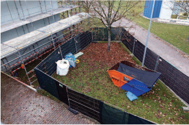
Ein Bauzaun grenzt den Arbeitsbereich von den Verkehrswegen ab. Beim Kraneinsatz wird der Zugang zum Gebäude über den Fluchttunnel (li. im Bild) umgeleitet.

sein muss. In einem zweiten Sperrbereich ist der Standplatz des Material- und Werkzeugcontainers. Auch in dem eigentlichen Baubereich auf dem Dach herrscht doppelte Sicherheit. Zusätzlich zu den erforderlichen Geländern wurden Schutznetze montiert, die jeweils nur die beiden Eingangsbereiche zu den Treppentürmen offenlassen. Von den hier beschäftigten Dachdeckern werden diese Treppentürme übrigens sehr begrüßt, weil sie es ermöglichen, auch kleinere Materialmengen wie eine Rolle Bitumenbahn bequem und sicher aufs Dach zu bringen. Das Standgerüst mit seiner doppelten Laufbohlenbreite ist durch zusätzliche schmale Laufgitter zur Fassade hin abgesichert. „Hier gibt es keinen Spalt zwischen Gerüst und Fassade von mehr als 15 cm“,