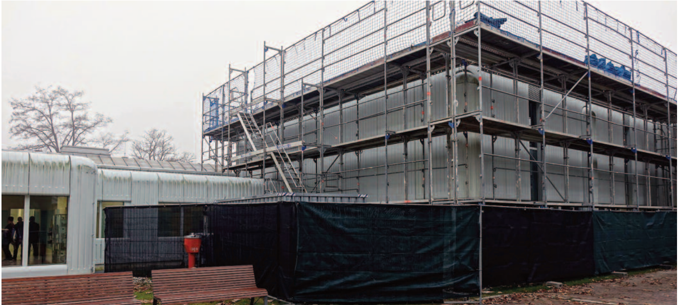
Vorbild-Baustelle des Innungsbetriebs von Hartmut Bergener im Münchener Siemens Education Center: „Der Kostenanteil für Sicherheit ist ein merklicher Teil der Sanierungskosten“.