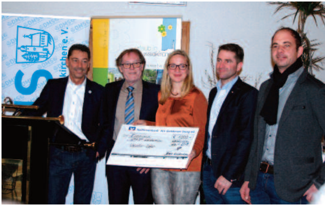
1.000 Euro spendete die DMS für die Unwetteropfer von Waldkirchen.