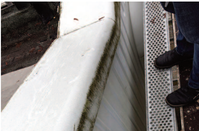
Maßarbeit: Kein Spalt zwischen Gerüst und Fassade darf hier mehr als 15 cm breit sein.