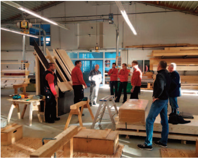
Die Theorie für die Ausbilder im Kompetenzzentrum Dachtechnik Waldkirchen e. V. gab es gleich in der Praxis.