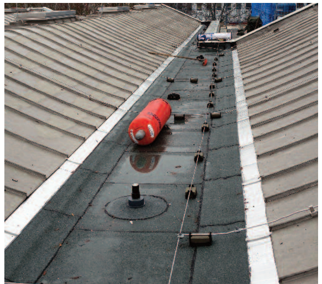
Leere Gasflaschen und Bitumenrollen dürfen - mit Keilen gesichert - nur in den Kehlrippen zwischen den Tonnendächern gelagert werden.

Der Facility-Management-Spezialist und Auftraggeber SPIE ließ die Baustelle permanent durch unangemeldete Sicherheitsüberprüfungen überwachen. Einzige Beanstandung bisher: Die leeren Gasflaschen wurden auf Hinweis der Sicherheitsexperten vom breiten Gerüst entfernt und in den Kehlrippen zwi-