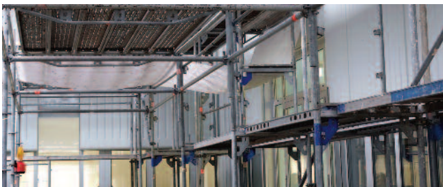
Planen schützen den Zugangsbereich zum Gebäude.