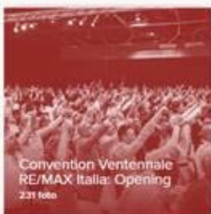
Convention Ventennale RE/MAX Italia: Opening 231 foto