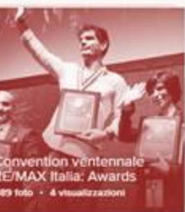
Convention Ventennale RE/MAX Italia: Awards 89 foto - 4 visualizzazioni