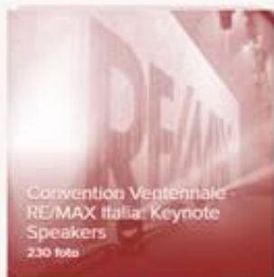
Convention Ventennale RE/MAX Italia: Keynote Speakers 230 foto