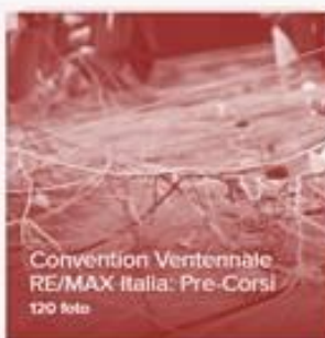
Convention Ventennale RE/MAX Italia: Pre-Corsi 120 foto