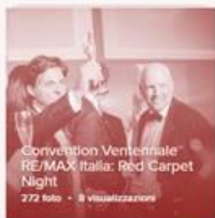
Convention Ventennale RE/MAX Italia: Red Carpet Night 272 foto - 8 visualizzazioni