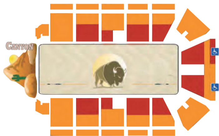
Mapa da arena