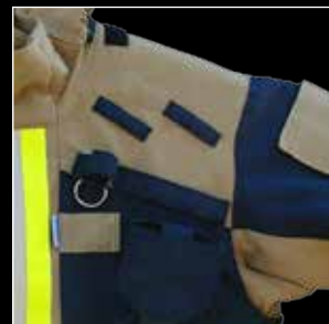
Palkeet kainalossa takaavat parhaan käyttömukavuuden. Kaksoispidike mikrofonia varten.