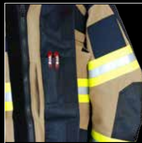
Etuosassa sisäpuolella pövitasku ja kynätaskut.