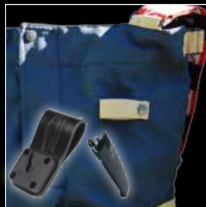
Kiinnitä radio pidikkeeseen tai lisää vyöpidike.