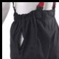
Aukot asemahou- suihin