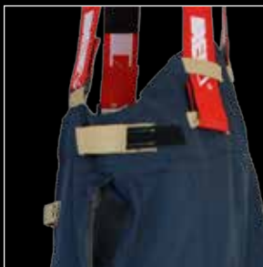
Pikakiinnikkeellä varustettu säädettävä vyötärö lisää mukavuutta.