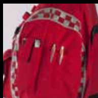
Puhelintasku ja kynätaskut