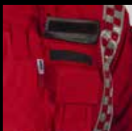
Sisä- ja ulkotaskut puhelimelle

Puhelin-/radiotasku keskellä takin etuosaa. Antenninpidike radiotaskun yläpuolella. Puhelintasku ja kynätaskut vasemmassa hihassa ulkopuolella. Oikeassa hihassa on henkilökortin paikka. Takissa on irrotettava vuori. Säädettävä vyötärönauha lisää mukavuutta. Housuissa on kaksi aukkoa. Housuissa joustava vyötärö, vyölenkit ja irrotettavat olkaimet.