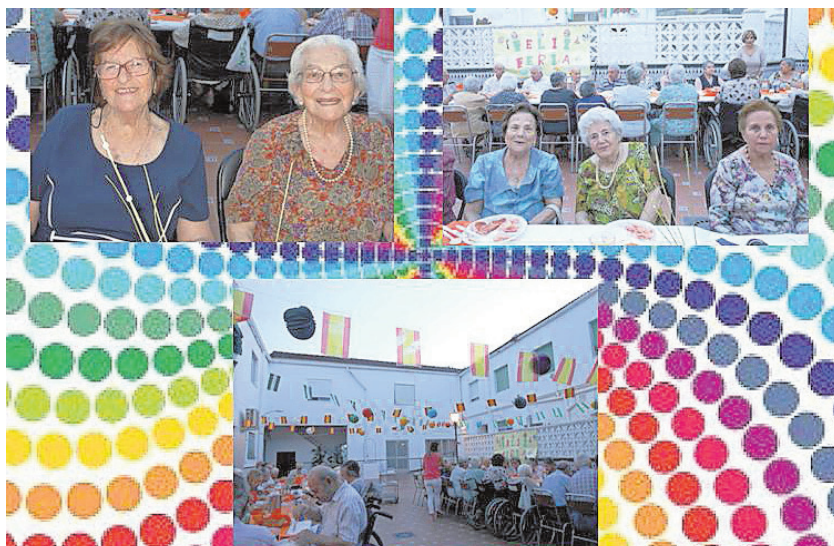
Fiesta en la residencia Virgen de los Remedios de Belmez