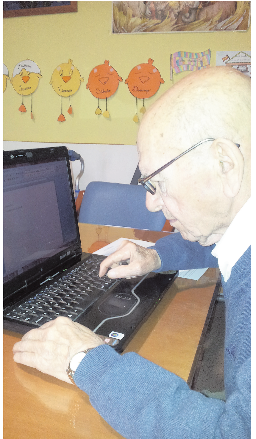
Los mayores de la residencia San Miguel nos cuentan su día a día

Seguidamente llega la hora del almuerzo y, cómo no, justo después nuestro ratito más deseado, la siesta. ¡Porque a nadie le amarga un dulce!