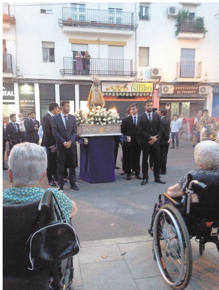
Los mayores recibieron la visita de la Copatrona de Córdoba