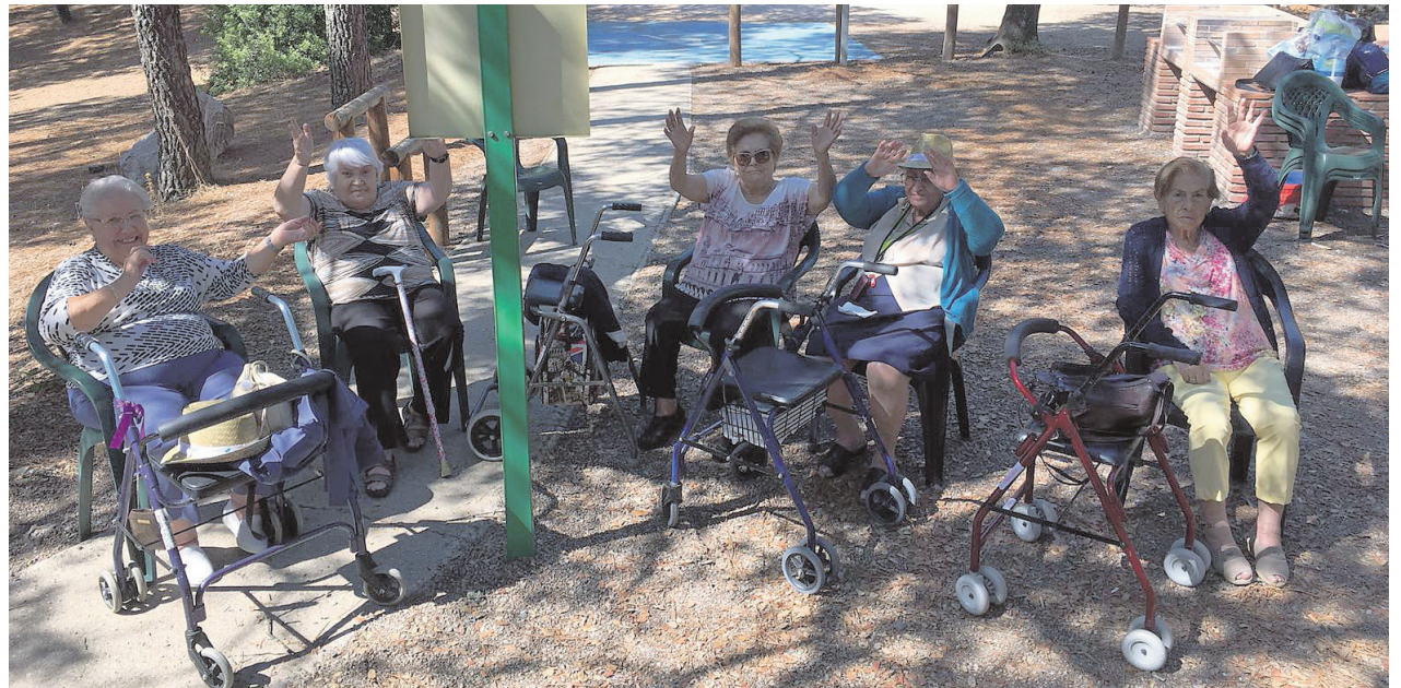
Residentes del centro durante la jornada en el parque

Cuando llegó la hora de irnos nos dio nostalgia de tener que dejar atrás ese día tan bonito. Tendremos que repetir pronto.