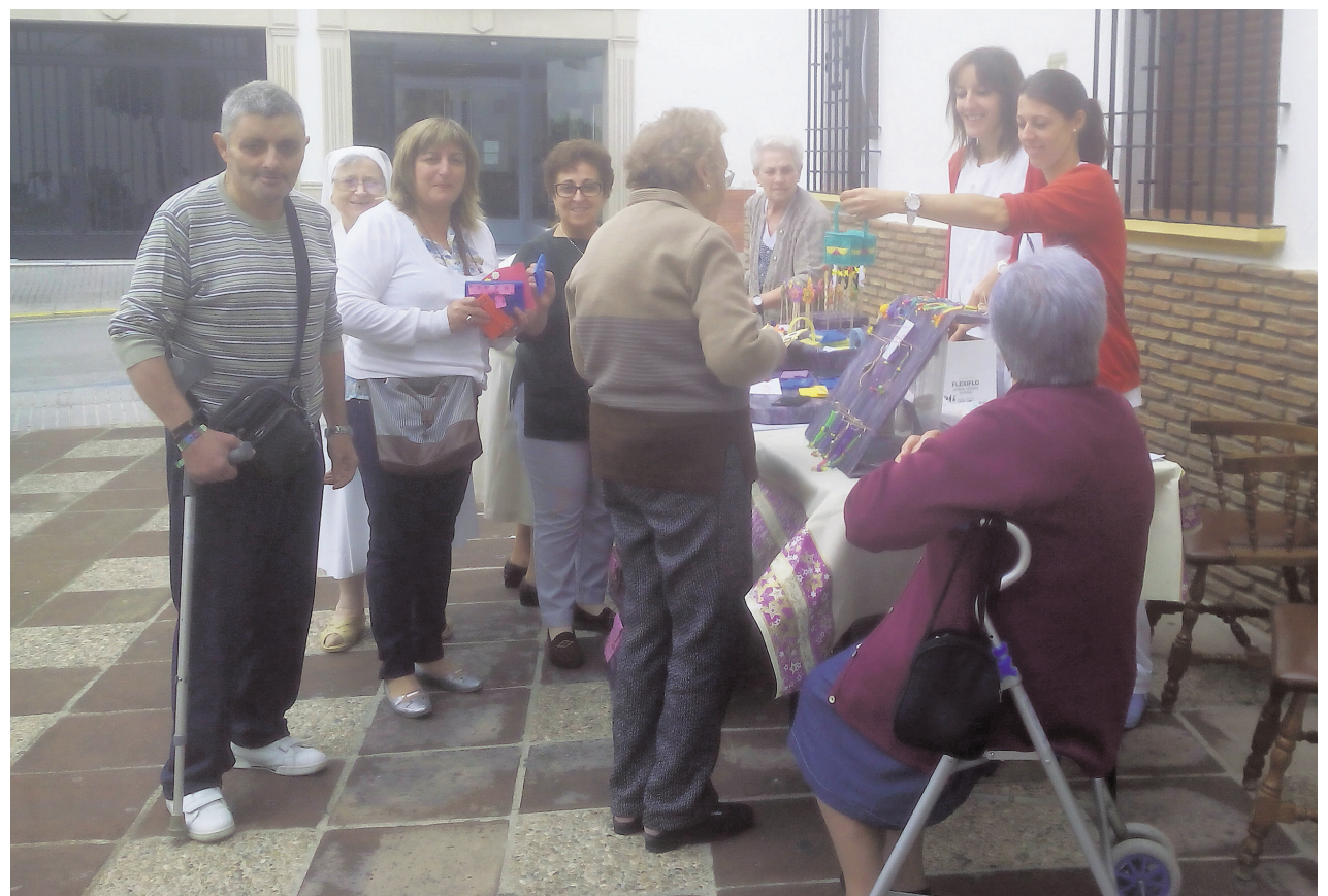
Mercadillo organizado por los miembros de la residencia Santo Cristo de los Remedios

Esperemos que nuestra recaudación tenga tanto éxito como en ediciones anteriores y podamos aportar nuestro «granito de arena» para ayuda a esas personas que se han visto obligadas a huir de sus casas.