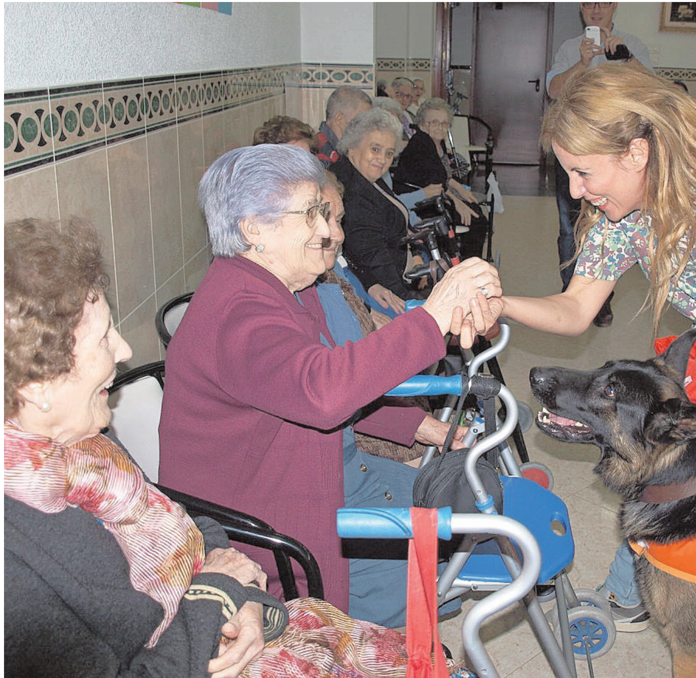
Los perros y el personal de Dogs Therapy y Herzogd-Can estuvieron en la residencia

Por todo ello, cada vez es más frecuente la práctica de terapias y actividades asistidas con animales. Los animales más utilizados para conducir este tipo de terapias son los perros, por algo dicen que éstos son el mejor amigo del hombre y, aunque en principio cualquiera puede convertirse mediante un largo adiestramiento en un buen terapeuta, existen razas que, por sus características afectivas y por tener un carácter equilibrado, están más capacitadas para ello. Entre ellos se encuentra el