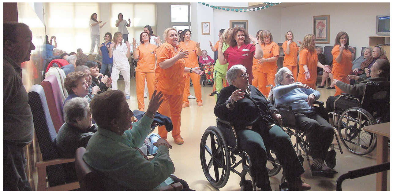
Residentes y trabajadores del centro durante la coreografía

Los trabajadores y mayores de la Residencia Séneca preparamos una coreografía para la canción «Ai se eu te pego», de Michel Teló. Esto propició trabajo en equipo, alta implicación y muchas risas. En Carnaval se hizo la grabación oficial y se repitió para hacer partícipes a los familiares. Fue una experiencia inolvidable que nuestros mayores, familiares y nuestro personal no dudaremos en repetir.