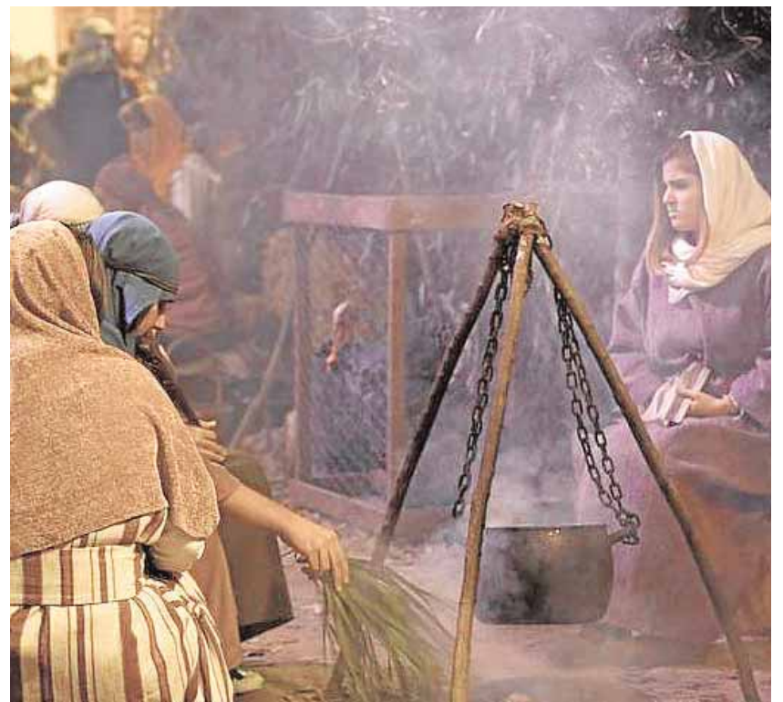
El centro de Alcalá del Río se corta durante las representaciones

Esta iniciativa de la Hermandad de la Soledad es una de las que aglutina a mayor número de personas, después de la procesión del Viernes Santo y de los cultos principales de la cofradía. A cada grupo o familia se le asigna la representación de una es-