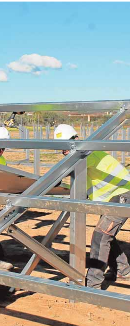
Trabajos de la planta solar

tores, pizarras digitales, ordenadores y demás material informático usado para la docencia en el centro educativo. Los jóvenes, al ser sorprendidos, fueron deshaciéndose del «botín», por lo que el consistorio pide la colaboración para recuperarlo. J.C.R.