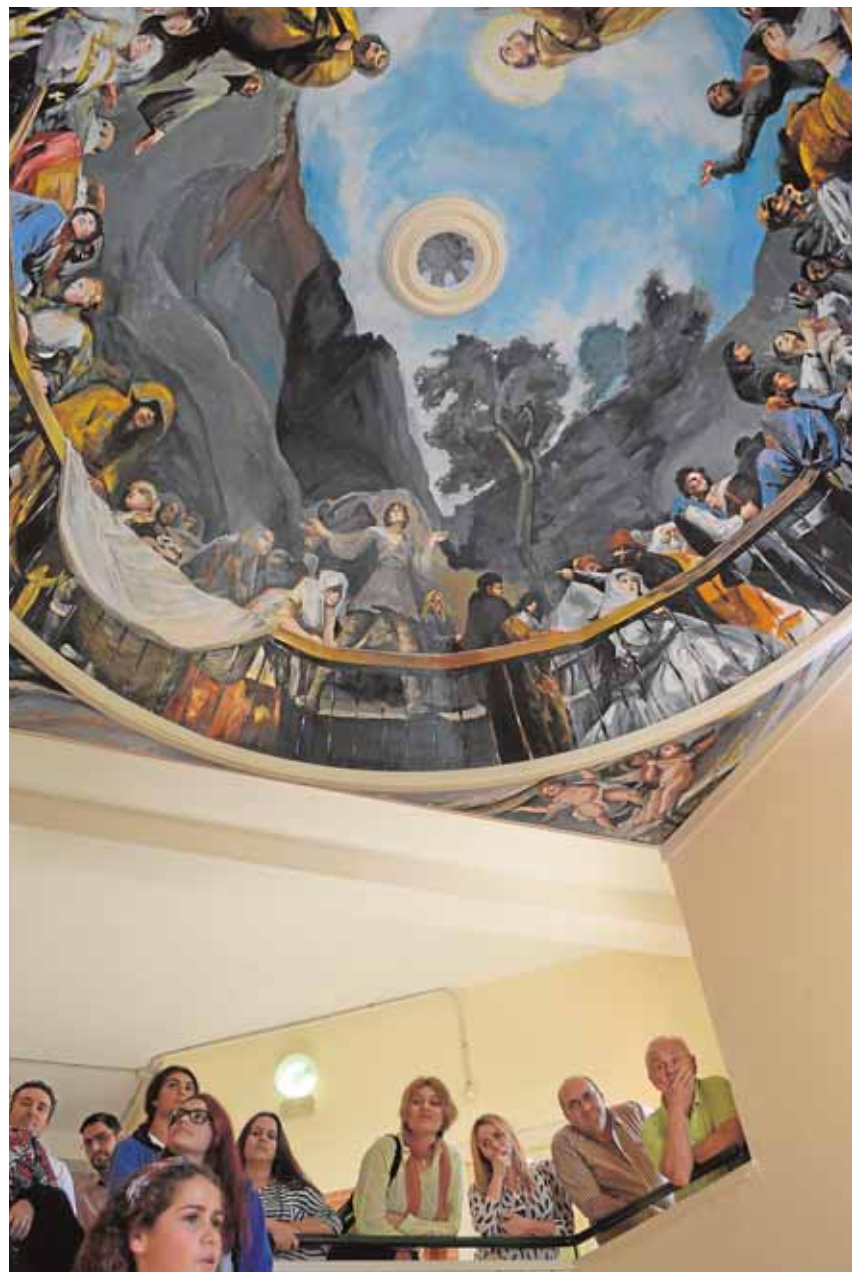
Los alumnos del instituto han trabajado dos años en la obra

Los propios alumnos se encargan de realizar visitas al museo en español e inglés