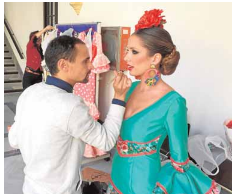
Las modelos han posado en los rincones más bellos del pueblo