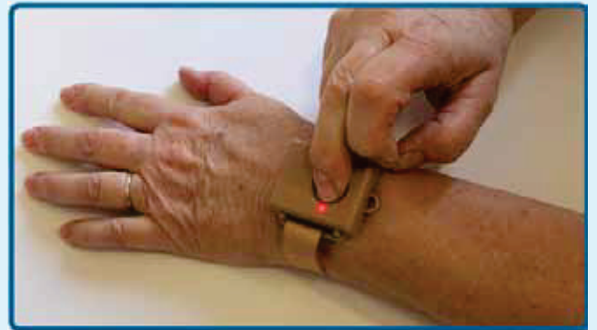
לחצן מצוקה - (מתוך אתר "מוקד אנוש")

בביטוח הלאומי מפתחים עבור הקשישים שירות חדש המבוסס על טכנולוגיות מתקדמות, והוא אמור להחליף את לחצני המצוקה המסורתיים. מדובר בחיישנים שיוקנו בבית הקשיש ויהיו מחוברים למערכת מתוחכמת שתשגר התראות באמצעות מסרונים לקרובי משפחת הקשיש ותתריע על התנהלות לא שגרתית שלו. לדוגמא: אם הקשיש קם בדרך כלל ממיטתו בבוקר ופותח את המקרר בשעה מסוימת והיום הוא עדיין לא קם, או אם הזמן שלוקח לו לעבור את המסדרון יורד בהדרגתיות בתקופה האחרונה, או אם הקשיש נמנע מלקיחת תרופות או אם הוא יצא מביתו באמצע הלילה וכו'.