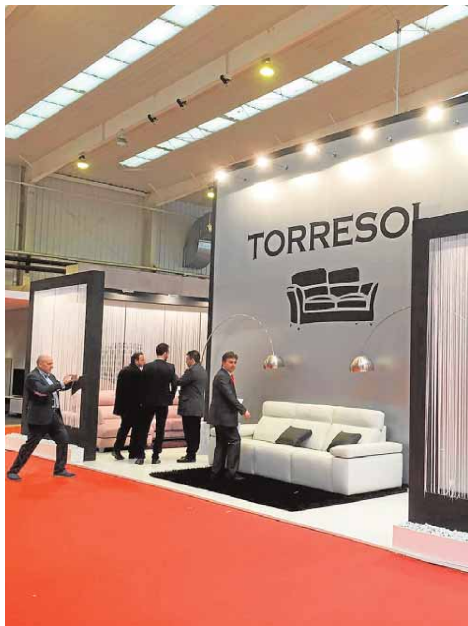
Empresas de la comarca expusieron sus productos en la Feria del Mueble de

Todas aprovechan estos aires benéficos para seguir expandiéndose a través de tres líneas: la mejora en el diseño y marketing, la exportación y la venta por internet. Así, una decena de