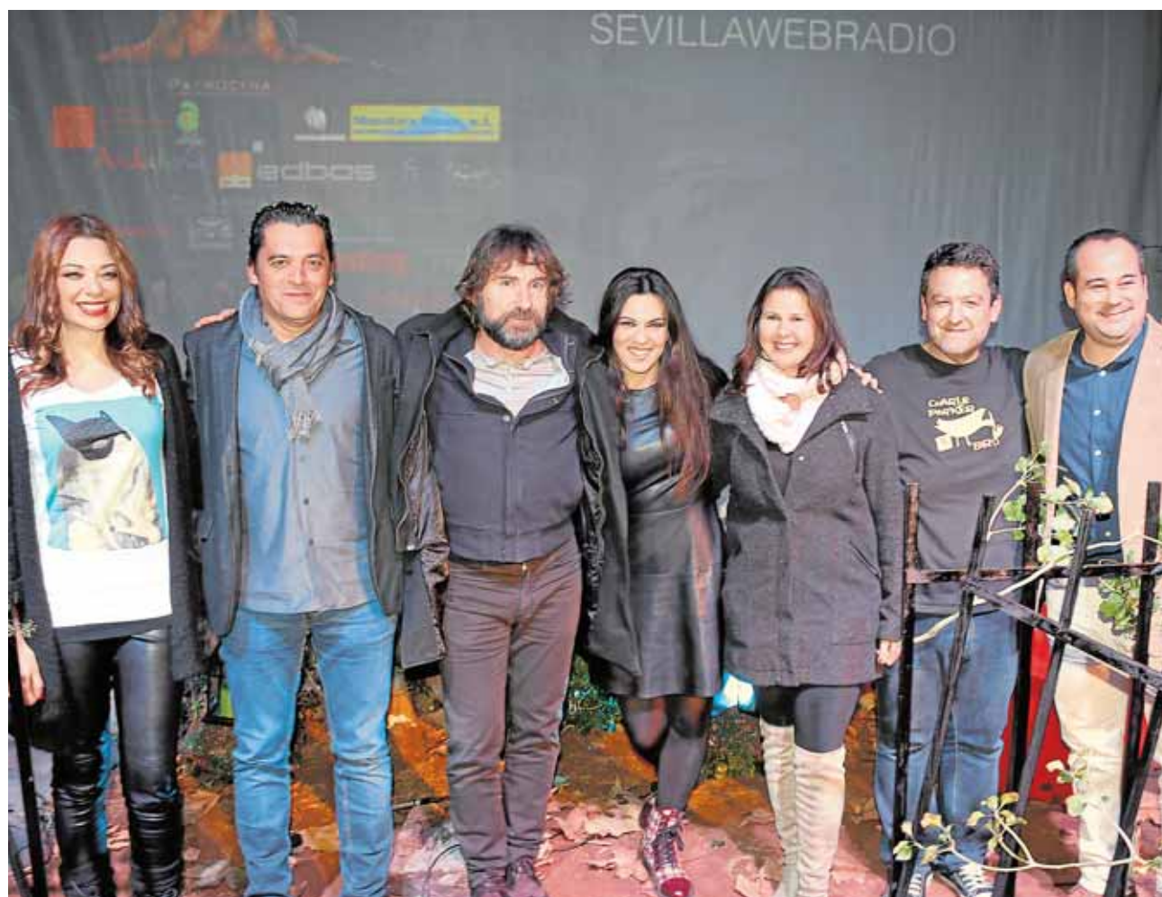
El año pasado el invitado especial fue Antonio de la Torre y la gala la presentó la actriz Lucía Hoyos

de peón de mantenimiento de instalaciones deportivas. El plazo para la presentación de solicitudes está abierto hasta las 14.00 del 3 de febrero. El proceso de selección se realizará mediante el sistema de oposición como personal laboral temporal. G.J.