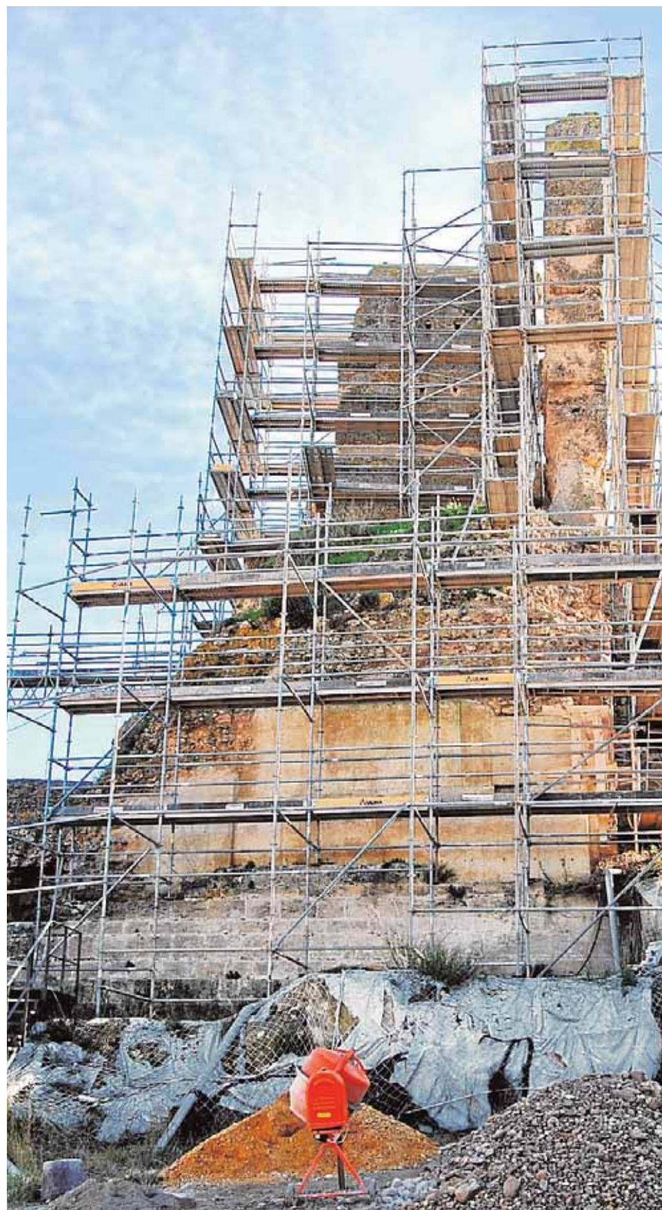
En la monumental torre del Homenaje se lleva a cabo la «costura» de los lienzos

Consolidación La imponente torre del Homenaje quedará salvada tras la unión de sus muros con materiales originales