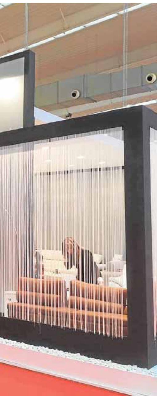
Zaragoza la pasada semana

les para el consumo de agua por parte de familias con un umbral de renta que no supere los 8.626 euros al año. Estos bonos son aplicables siempre que afecte al abastecimiento domiciliario de agua potable, alcantarillado o depuración.