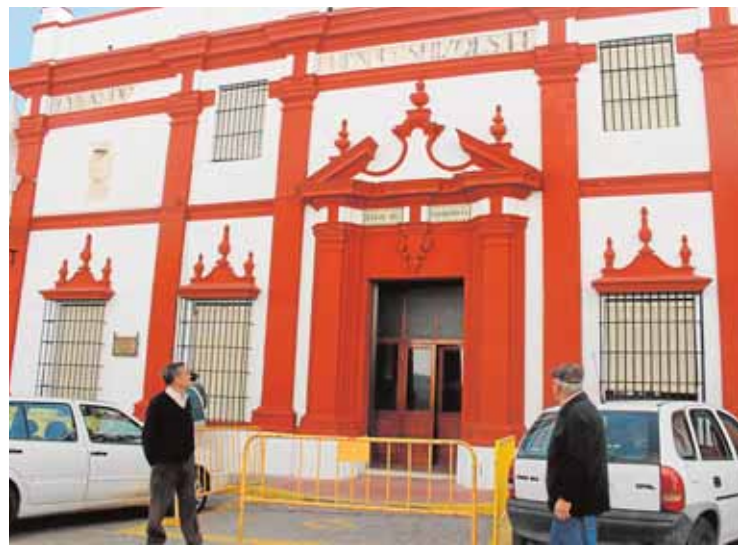
El Hogar del Pensionista, antiguo Pósito, luce reformado