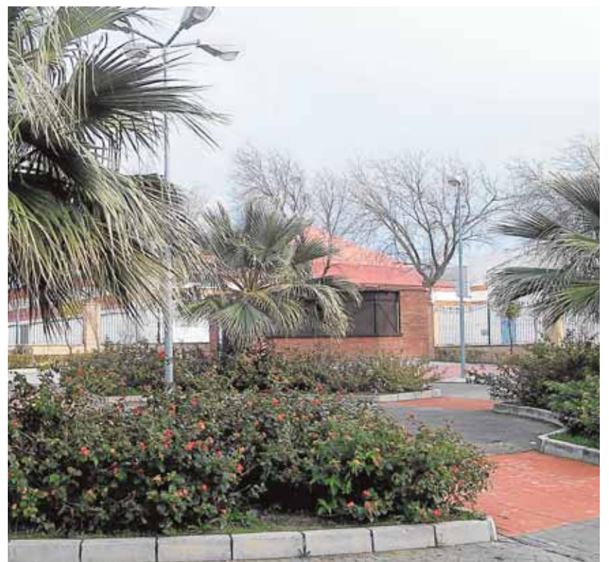
Plaza interior acondicionada en el parque Rafael Alberti

Los jóvenes que han respetado las normas que se les ha explicado durante meses se han librado de pagar unas multas que pueden ascender de los 100 a los 200 euros.