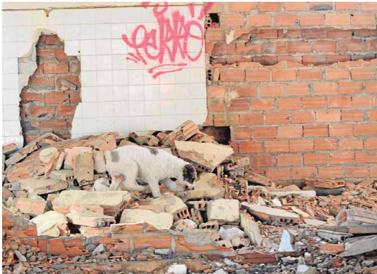
Lucas, el perro palaciego entrenado bajo el método Arcón, durante un simulacro

temporada se podrá participar hasta en ocho modalidades distintas: aerolatinos, yoga, tonificación muscular, G.A.P. (glúteos, abdominales y piernas), pilates, baile y sevillanas, mantenimiento, pádel y animación deportiva para niños. F.R.M.