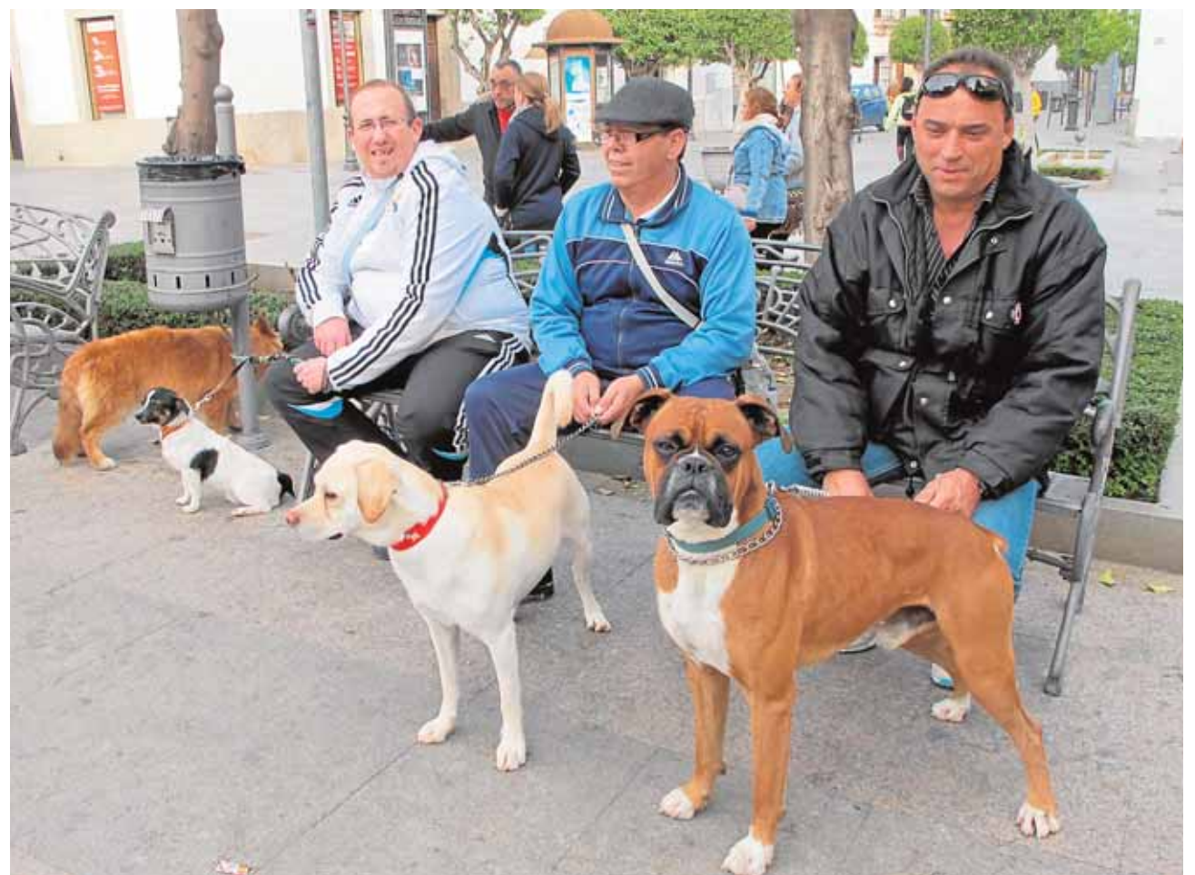
En Lebrija hay censados con chip 4.600 perros, pero se calcula que sin él hay más de 7.000

El colectivo sugiere que el Ayuntamiento facilite a los propietarios una chapa que demuestre que tienen el chip, lo que permitiría comprobarlo sin necesidad de pasar un lector.