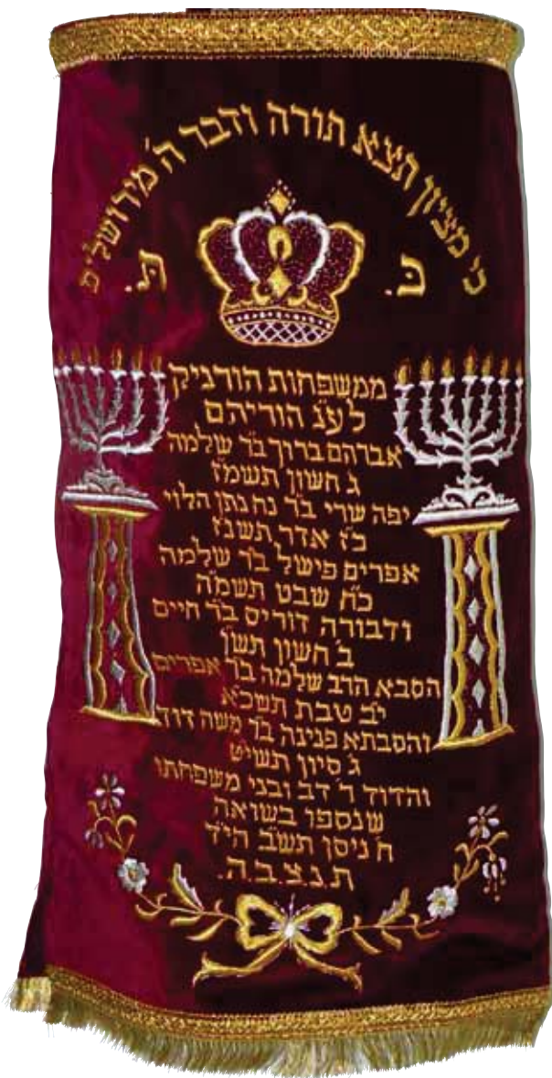
מעיל ספר התורה (מחודש)

ישנן גם משפחות או קבוצות שהחליטו לחדש מסורת ולהנהיג בקבוצה או במשפחה העברת חפץ. לדוגמה: חברי גרעין "בני-עקיבא" של בתי קנו מגש מכסף, וכל זוג מהשבט שמתחתן חורט את שמו עליו ומעביר את המגש לזוג הבא שמתחתן. משפחת ק. קנתה חופה רקומה. ילדי המשפחה משתמשים בחופה זו בזמן נישואיהם. שמות בני הזוג נרקמים בשולי החופה. החופה נשמרת לדורות בידי בני המשפחה המבוגרים ביותר.