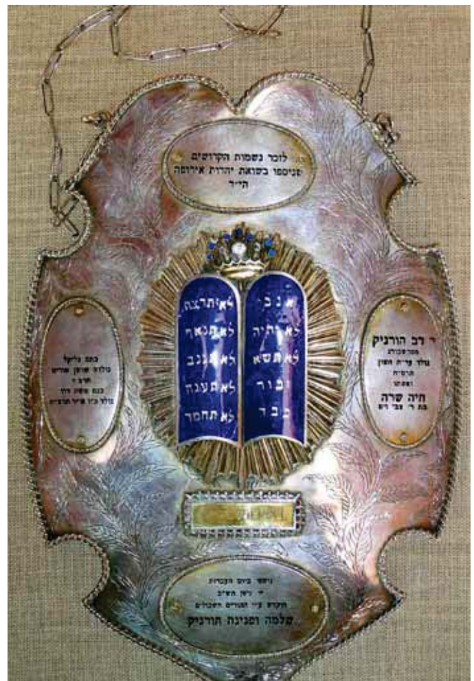
הציץ של ספר התורה החנוכיה

אבל ישנם גם כאלה ששפר עליהם גורלם והם זכו לקבל בירושה חפצים בהם הם עושים שימוש באירועים מיוחדים ואותם הם ממשיכים להעביר הלאה לילדיהם ולילדי ילדיהם. כזה הוא אחד מכתבי "כיוון חדש": "אבי ואמי עלו ארצה לפני השואה בצורה בלתי לגאלית והם לקחו איתם רק תרמיל גב ובו חפצים נחוצים. סבי וסבתי עלו ארצה עם סרטיפיקט ולכן יכלו לקחת איתם גם ליפט ובו רהיטים, כלים, ספרים ועוד. טרם יציאתם מסר להם דודי, שהייתה לו חנות תכשיטים,