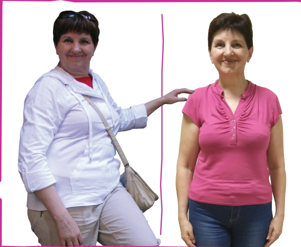
GAĻINA APDROŠINĀŠANĀS AĢENTS, RĪGA