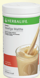
Tropiskie augļi #0144