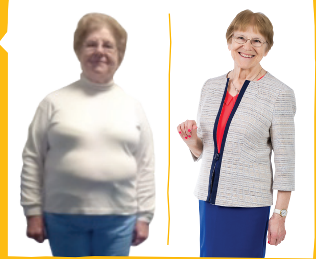
ANDRA SKOLOTĀJA, SIGULDA

ILGSTOŠI PĀRLIDOJUMI TAGAD IR AR KOMFORTU!