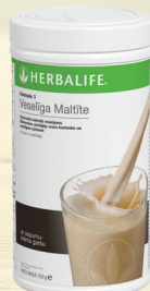
Cepumu krēma #0146