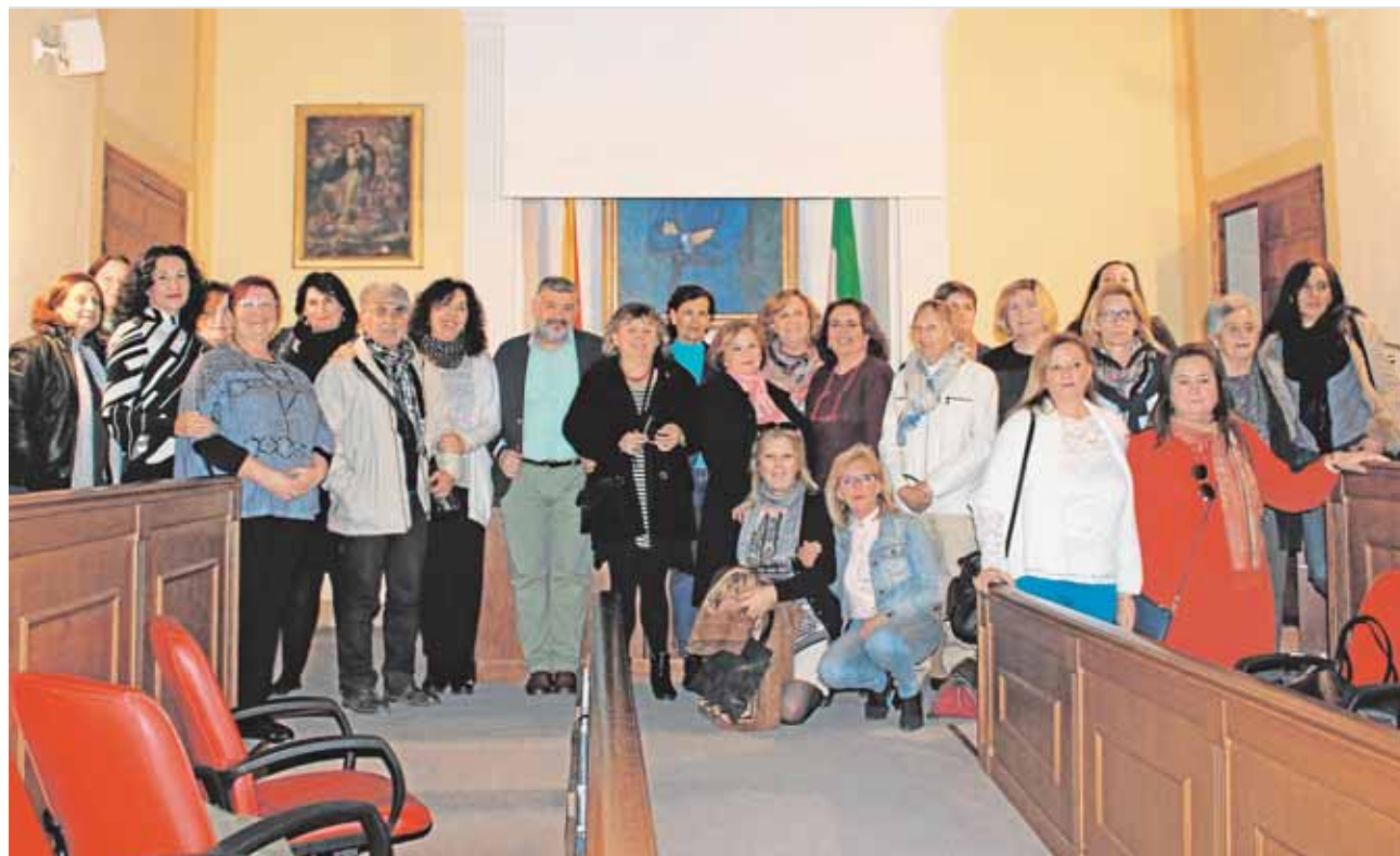
Hierbabuena impulsó el Consejo Local de las Mujeres, con influencia en la vida pública de Écija

En la calle San Cristóbal han abierto su nueva sede, con talleres de literatura, yoga o venta de ropa