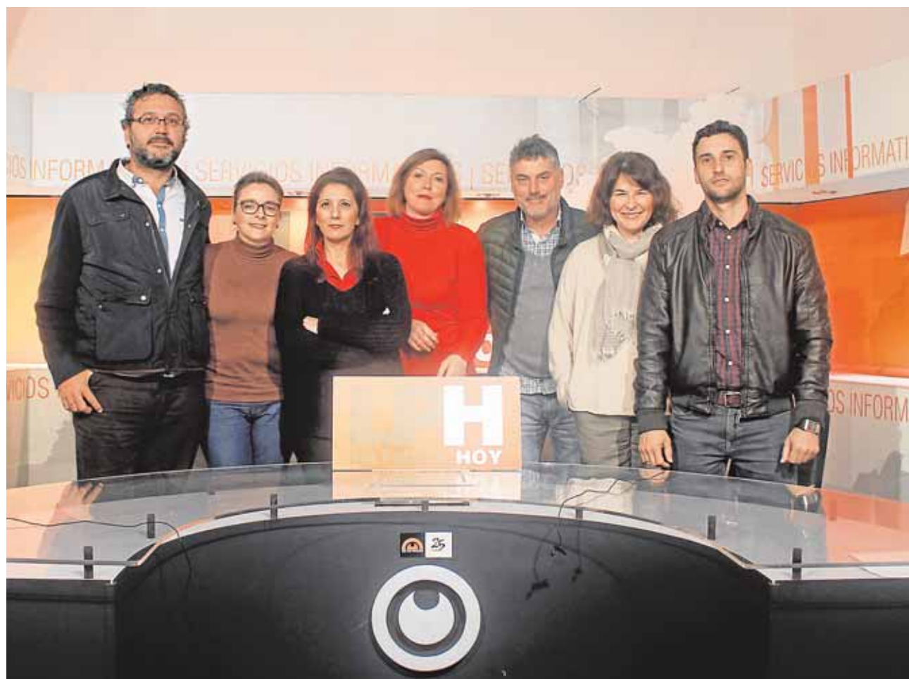
Parte del equipo de la televisión local de Los Palacios, que cumple 25 años en antena

Actualmente cuenta con una docena de trabajadores que sacan adelante un informativo puramente local y cubren todos los actos culturales, políticos y deportivos de la localidad.