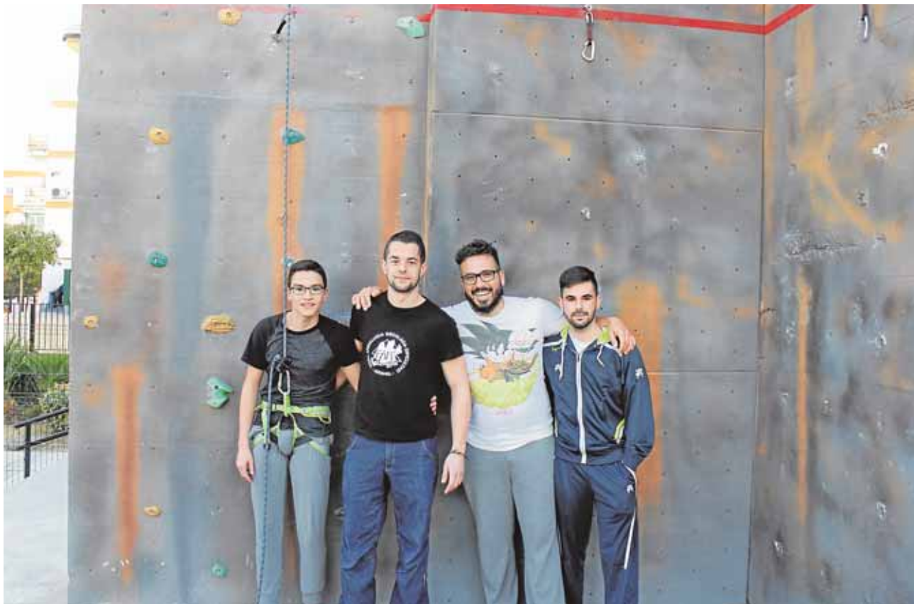
Con sus 25 metros de altura, el rocódromo de Arahal es uno de los más atractivos de España