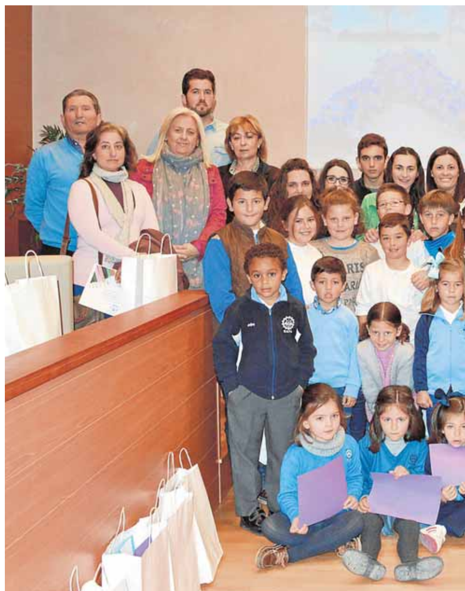
Mañana se celebrará en Osuna una nueva edición del Foro infantil por la igualdad,

Talleres escolares Los centros educativos de la comarca organizan talleres sobre igualdad y reparto de tareas en casa