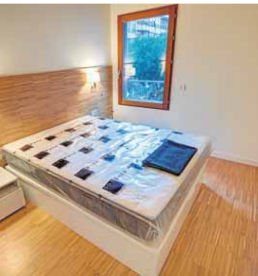
nturas y aislantes para interior y exteriores

co en el mundo y poseía cualidades jamás vistas en la construcción.