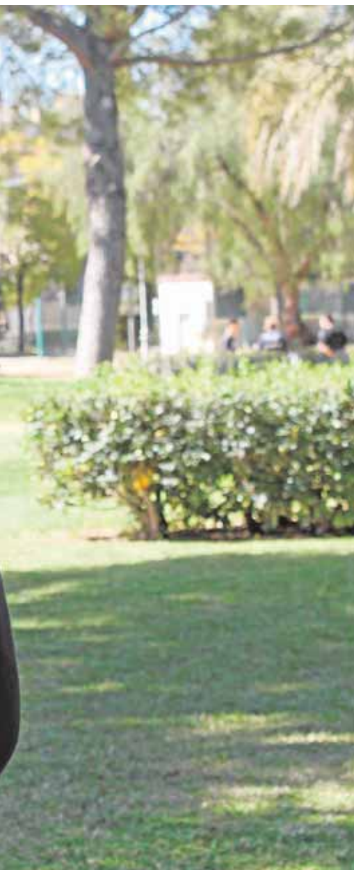
ciación de Ciudad Expo

gratuita que se dirige a la población en general, que tiene como objetivo, trabajar técnicas para la mejora del conocimiento interior, empoderamiento, emociones y valores positivos, entre otros. Este taller se desarrollará en seis sesiones.