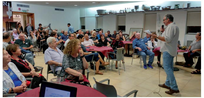
האירוע בארכיון רעננה

לבן קטנות ששלפו מאלבומי תמונות מצהיבים. תיארו בלהט את סצינת הצילום. כולם הסירו מעליהם את אבק השנים. נפלו זה בזרועות זה. ביקשו לעצמם לכמה שעות להיות שוב הילדים של רבוצקי לסטר ופיתוח.