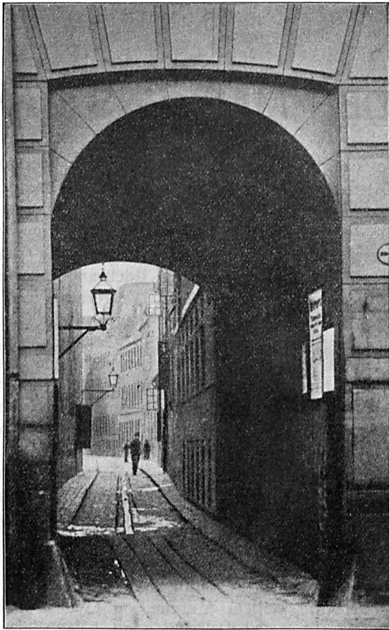
Indgangen til Peder Madsens Gang fra Østergade igennem Svaneapothekets Port.

Peder Madsens Gang mandede ud i Østergade, hvor-