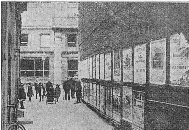
Plakatrækken i Pistolstræde.

meport for Enden af Strædet spærrer for offentlig Passage, ligger Strædet — kun 5 Alen bred — i det væsentlige uforandret og til behagelig Beskuelse. Pistolstræde, denne forhistoriske Levning fra hin Tid, da Peder Madsens Gang og nærmeste Qvarter var Elendighedernes Elendighed, er nu kun en Blindtarm, og denne saa korte og saa snævre Gang, andet er det jo ikke, har ikke ret mange Mennesker Ærinde til i Dagens Løb, men trods dens stille og tilbagetrukne Tilværelse havde det ivrigt reklamerende