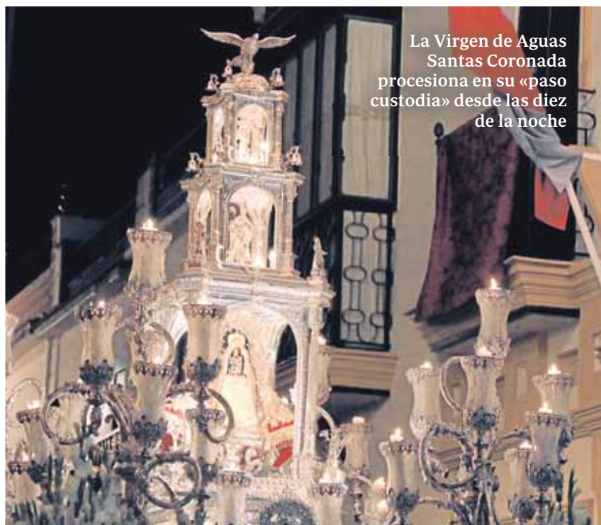
La Virgen de Aguas Santas Coronada procesiona en su «paso custodia» desde las diez de la noche

La festividad recuerda este año el 450 aniversario del primer traslado de