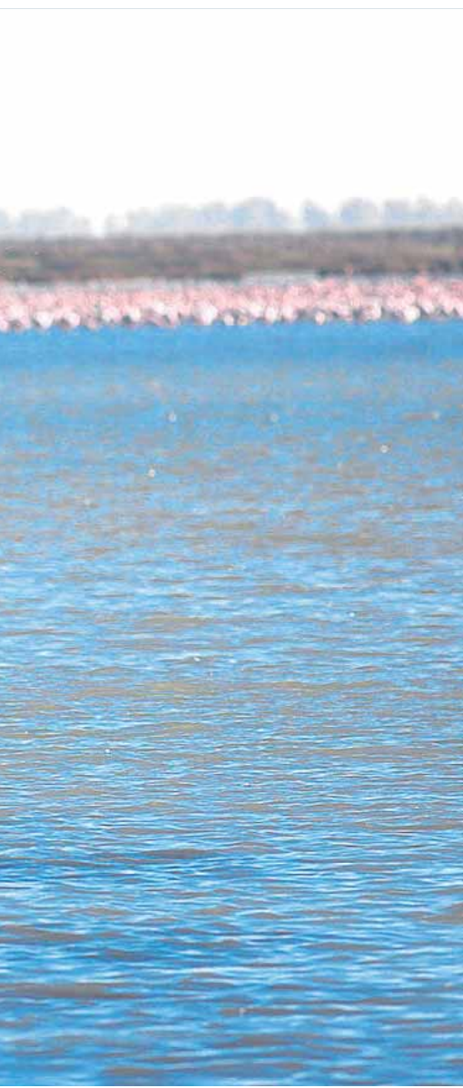
do. Aquí viven unos 40.000 ejemplares M.A.B.

de sacar a sus mascotas a pasear, debido a que la zona conocida como «El Barrio» está siendo contaminada con veneno para ratas, lo que ha provocado el envenenamiento de varios perros, por lo que piden también que se denuncien los casos al Seprona.