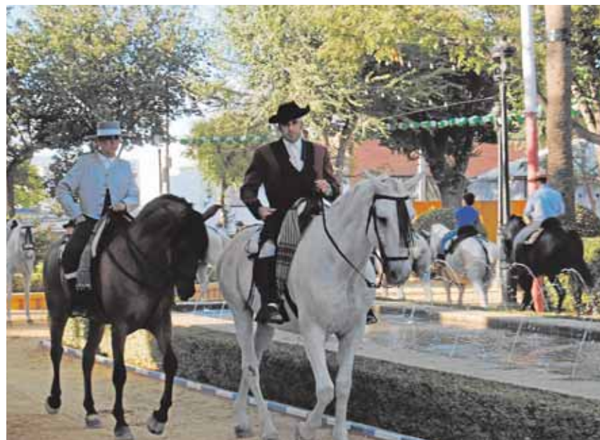
Caballistas en la Feria de La Puebla de Cazalla

Pero el pistoletazo de salida oficial tuvo lugar anoche con el encendido del alumbrado a las once de la noche. Así pues, durante los próximos cuatro días comienza el desarrollo de la Feria del Ganado, que este año cumple