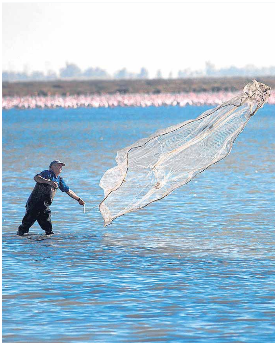
Uno de los pescadores de Veta la Palma pescando con tarraya con los flamencos al fondo.

«Algunas especies de aves comen pescado y entendemos el impacto económico, asumiendo un 20 por ciento», explica Miguel Medialdea, biólogo y responsable de Calidad y Medioambiente.