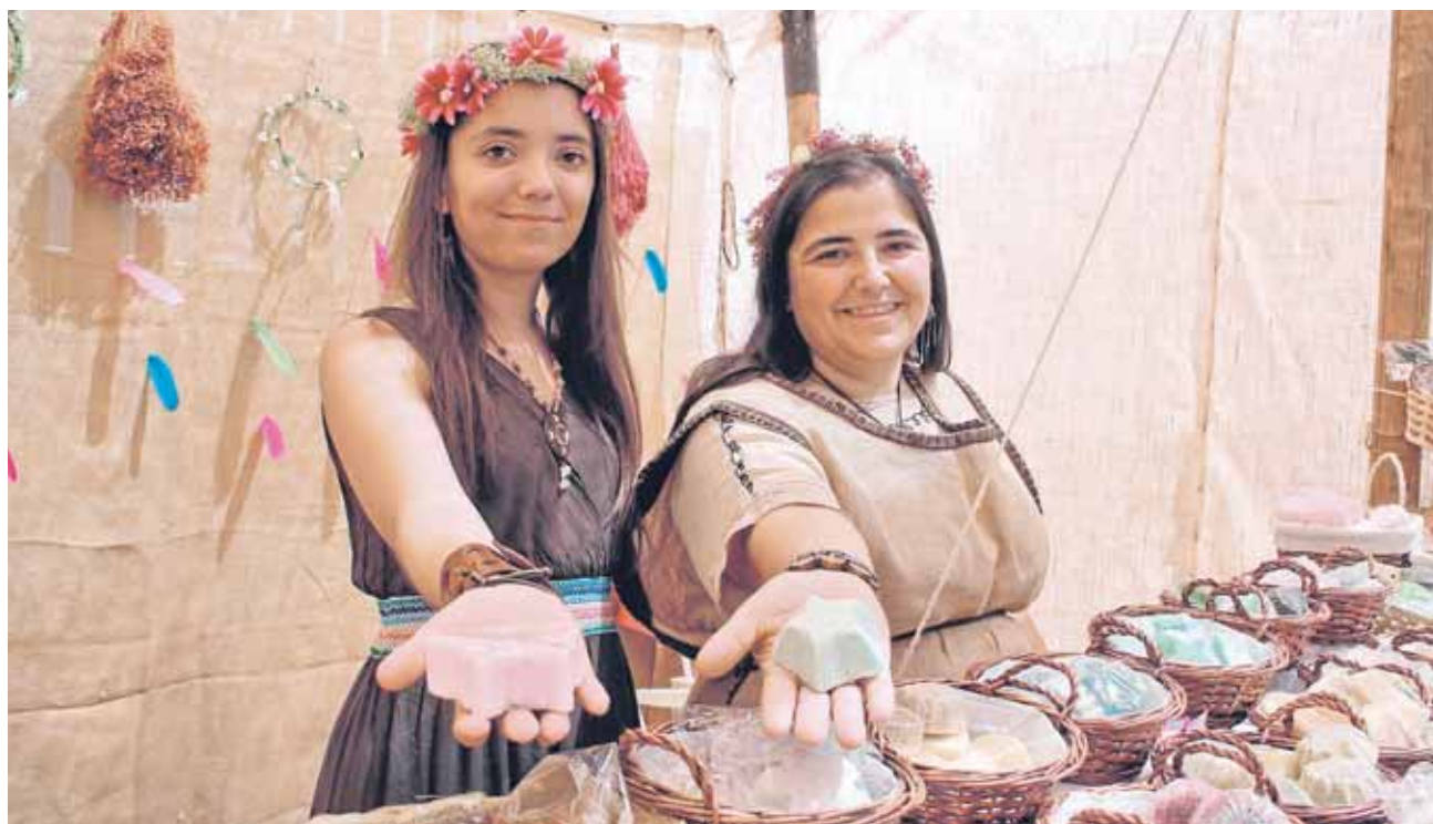
Madre e hija muestran sus jabones naturales durante las pasadas Jornadas Medievales de Alanís

distintos puntos de Andalucía. Entre ellos destacan Rafael Arcos, cuanto veces campeón de España en la modalidad de doma vaquera. La exhibición tendrán lugar en la Plaza de Toros del municipio a partir de las 21.30 horas. G.J.L.