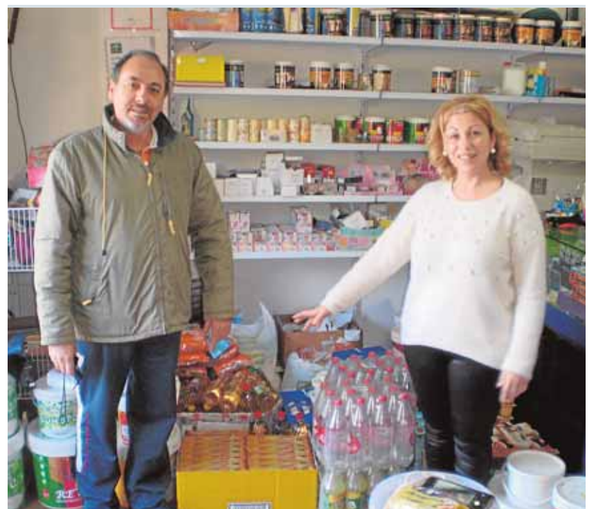
El bar la Herradura donó el dinero de los desayunos de una mañana