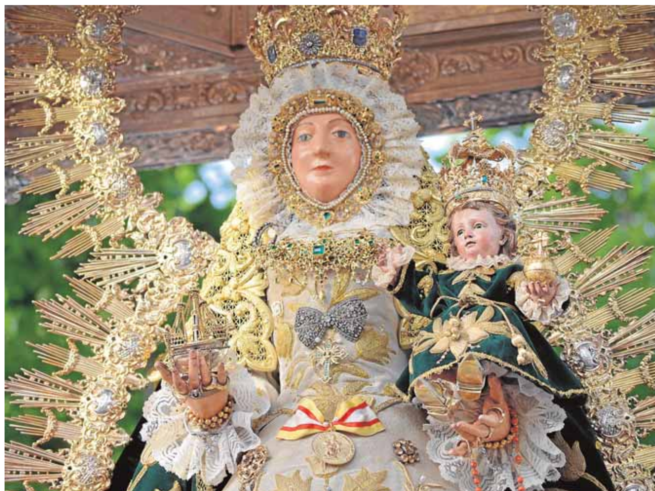
La Virgen de Consolación recibe también el nombre de «La del barquito en la mano»

de Utrera en la que cada año se suman gran cantidad de vecinos llevados por la devoción y el amor que profesan a la patrona de esta localidad vecina. Las inscripciones se pueden realizar en la Capilla de Nuestra Señora de los Ángeles al precio de 5€. F.R.M.