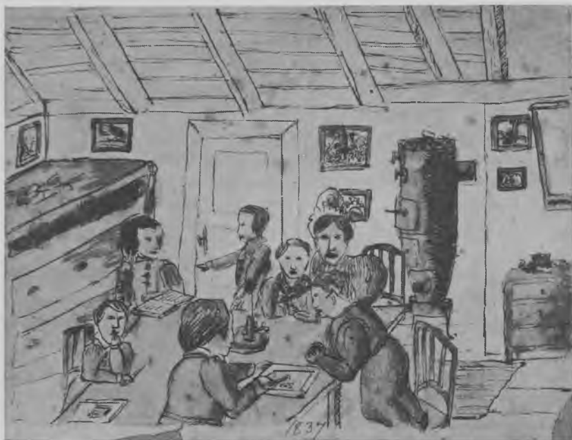
En aften i hjemmet i Nyboder, tegnet af et af børnene. Det er formentlig faderen, der sidder med ryggen til