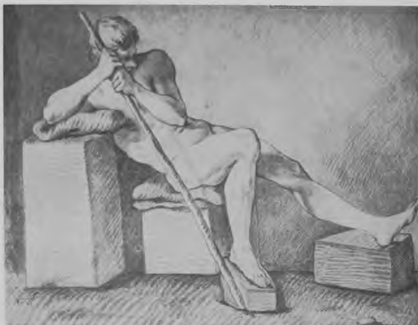
Fig. 3. C. F. Stanley: Modeltegning, rødkridt. Modellen var stillet af prof. Pilo, og Stanley vandt 9.7.1755 den store sølvmedalje på dette arbejde. Kunstakademiet's Bibliotek.

mæssige grunde en egetræsbalje – rødmalet ligesom brandslukningsmateriellet i gården og fyldt med vand. Modellens omklædningsrum var indrettet noget interimistisk i en vinduesniche, der var blændet ud mod gården og adskilt fra det øvrige lokale af et grønt forhæng. 30