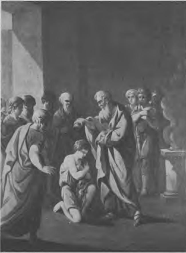
Fig. 5. Jens Juel: David salves af Samuel. Olie på lærred. 1767. For dette billede fik Juel den lille guldmedalje. Kunstakademiet.

Konkurrencen startede i perioden 1755-71 i begyndelsen af februar, hvor eleverne den første dag skulle aflevere et udkast over et opgivet emne; dette var for malere, billedhuggere og kobberstikkeres vedkommende altid hentet fra Det gamle Testamente. Arkitekterne skulle derimod give projekt til forskelligartede monumentale anlæg, der ofte var af militær karakter. Disse opgavers formulering hentede ikke sjældent inspiration i samtidens danske byggeplaner uden dog at have noget konkret sigte.