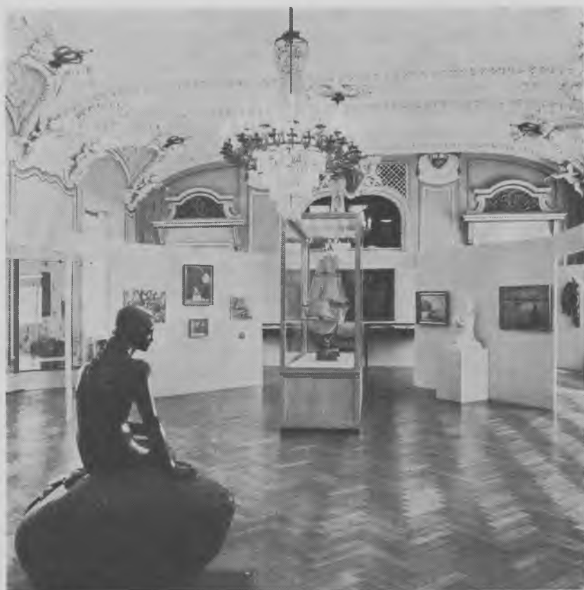
Interiør fra Havfrucudstillingen. Sommer 1972

er således malt få år før han 69 år gammel afgik ved døden 1928 – to år før Ladegården blev rømmet og nedrevet. Det er malt med en bred pensel og viser til højre den toetagers fløj, der rummede inspektørboligen. På plænen foran denne står et poppeltræ og et gammelt, kraftigt frugtræ, medens en rødmalet låge og et lavt gråmalet hus skimtes i billedets baggrund.