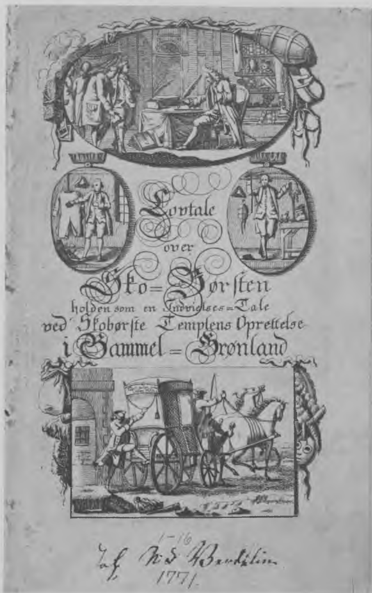
Titelblad til »Lovtale over Sko-Børsten«, Rådhusets eksemplar