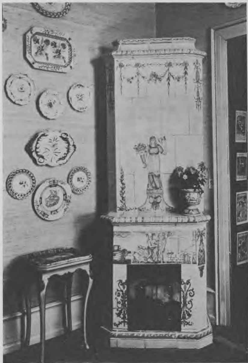
Fig. 2. Ovn fremstillet på Vesterbros ovnfabrik omkring år 1800. Svage polychrome højildsfarver