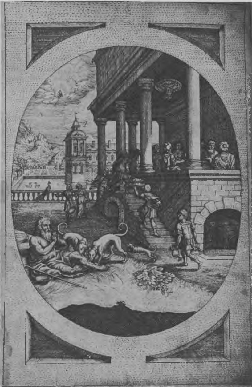
Forblad i protokollen »Original paa de Fattiges Forraad udi Kiøbenhavn« (1634), en fortegnelse over gaver til de fattige. Billedet illustrerer lignelsen om Den rige mand og Lazarus. Protokollen er et af stadsarkivets klenodier