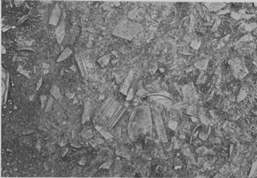
Fig. 3. Billede af skårlagene i området, hvor Kastrup Værk havde sin produktion. Stykkerne er alle uglaserede, såkaldt skrødet gods, som er gået itu før decorationen

størrelse ikke har været så afskrækkende, at de er blevet fjernet, da de blev umoderne. Der er således en på Frederiksberg Slot og en på herregården Hindsgavl på Fyn.