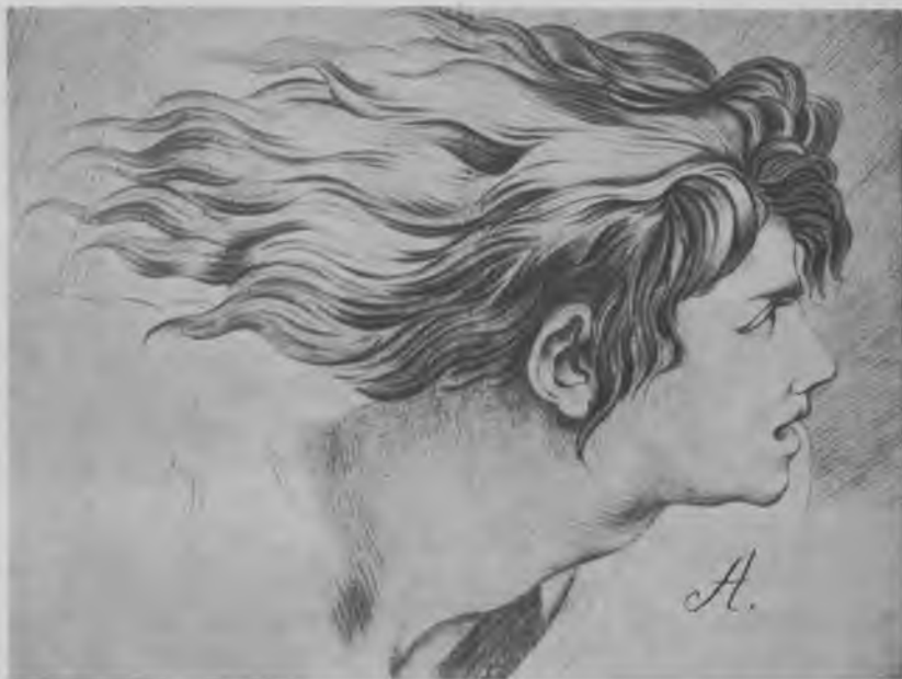
Fig. 2. Rødkridtstegning kopieret efter et af de crayonstik, akademiet fik fra Paris i 1761. Dette hoved er taget fra Raphaels fresker i Vatikanet. Tegneren ukendt. Kunstakademiets Bibliotek.

sigt over Nyhavnskanalen; i vinduesnicherne stod gråmalede borde med skabe under, medens vinduerne ind mod gården i begynderklassen dels var tilmuret, dels dækket af et stort skab. I den øverste klasse førte en dør ud til en trappe der åbenbart ved vintertide kunne være temmelig kold, for i 1758 blev man nødt til at opsætte et vindfang inden for døren. De vordende arkitekter arbejdede i modsætning til eleverne i fritegnestuerne ved flade borde. Vi ved til gengæld meget lidt om, hvad der har prydet de rum, de opholdt sig i. Udover de tegnetavler og udskårne opslagstavler, der – ligesom lærernes lænestole – fandtes i alle akademiets lokaler, 19 kan vi med sikkerhed kun placere tre lavede tuschtegninger i forgyldte rammer. De var udført af informator G. D. Anthon i 1759 og forestillede plan, snit og facade af »et Landhus med sin Grund«. 20