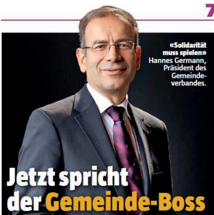
«Blick am Abend», 4.5.2016