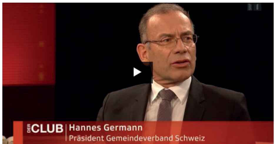
SRF Club, 23.2.2016

Der SGV hat seine Medienarbeit im Berichtsjahr im Vergleich zu 2015 noch einmal verstärkt. Schweizweit sind mehr als 150 Artikel in Zeitungen oder Zeitschriften über den SGV erschienen und rund 20 Beiträge im Schweizer Radio und Fernsehen ausgestrahlt worden. Auf besonders grosses mediales Interesse stiessen die Kampagne des SGV zur Stärkung des Milizsystems, die Abstimmung über die Service-public-Initiative, die Bestrebungen des SGV, die Gemeinden bei der Verdichtung nach innen zu unterstützen, die steigenden Pflege- und Sozialhilfekosten, die Rolle der Gemeinden im Asylbereich sowie die Unternehmenssteuerreform III.