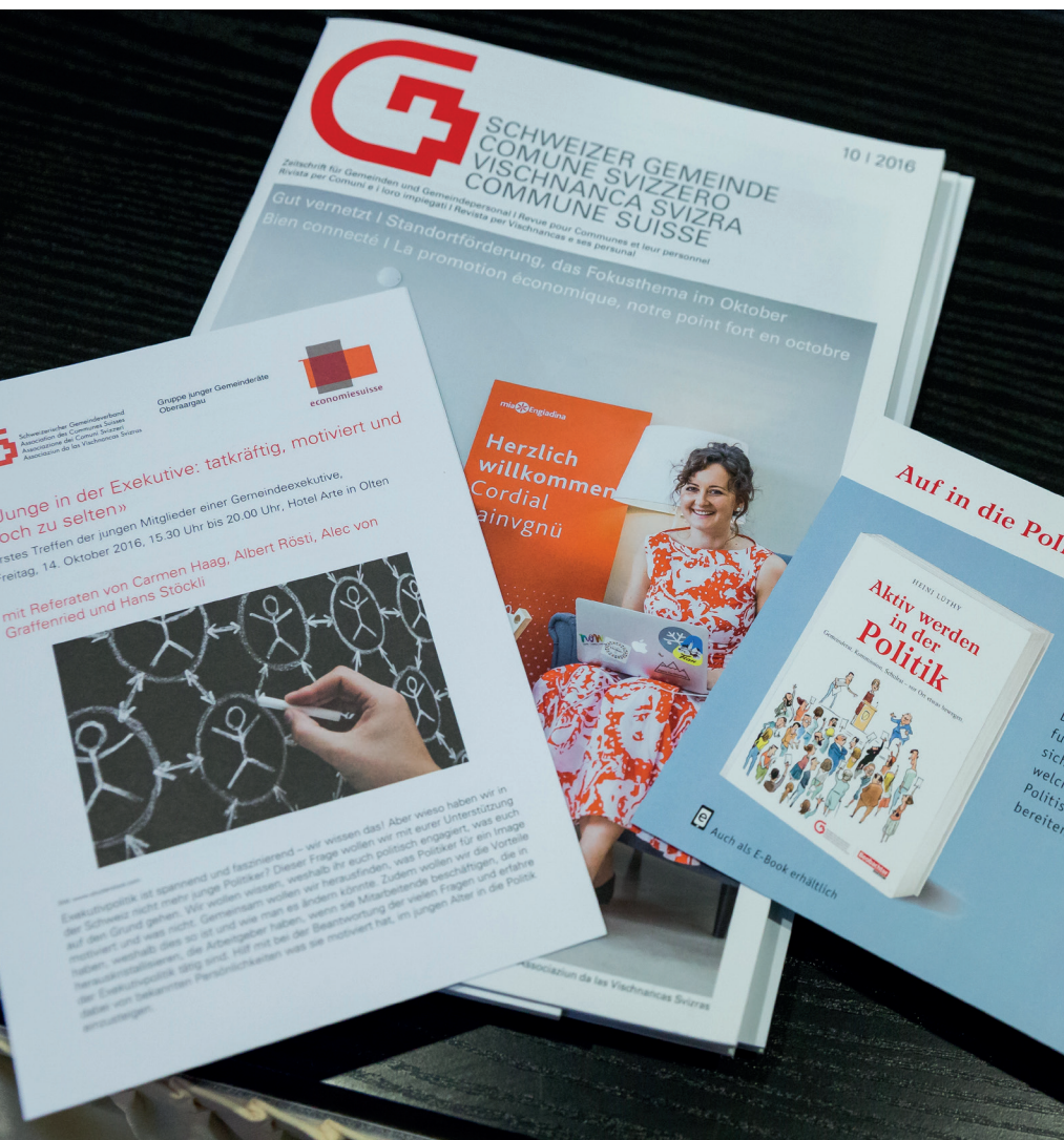
Der SGV stärkt mit gezielten Massnahmen das Weiterbestehen und die Weiterentwicklung des Milizsystems.

Mit Konsternation nahm der SGV im Frühjahr 2016 zur Kenntnis, dass seine eingebrachten Einwände zur Verordnung über die Requisition von Zivilschutzanlagen nicht ernst genommen wurden und er von der Notfallplanung im Asylbereich ausgeschlossen worden war. Mit einem scharfen Schreiben machte er den Bund darauf aufmerksam, dass es ohne die Mitsprache der Gemeinden nicht geht. Und er forderte den Bund auf, seine Verantwortung bei der Unterbringung von Asylsuchenden wahrzunehmen. Am «Asylgipfel» in Bern Mitte April unterstützte der SGV dann das Konzept des Bundes zur Bewältigung einer Notlage im Asylwesen. Gleichzeitig stellte er folgende Forderungen: Die Zahl der Unterbrin-