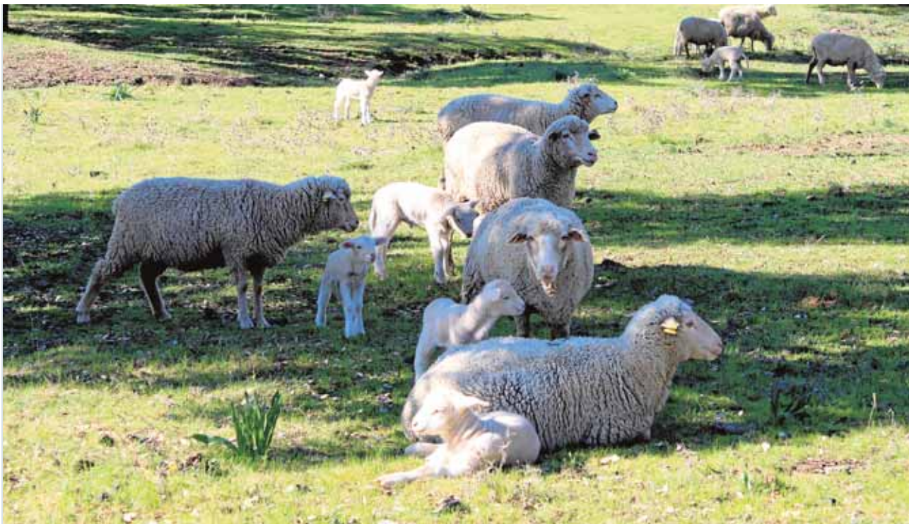
Los ganaderos se ven obligados a encerrar los corderos para que el meloncillo no los mate

elaboración de un proyecto de regeneración y limpieza del cauce del río, según ha informado la Delegación de Medio Ambiente del Ayuntamiento de Cazalla. El Consistorio ya advirtió a la CHG del mal estado del cauce el pasado verano. G.J.L.