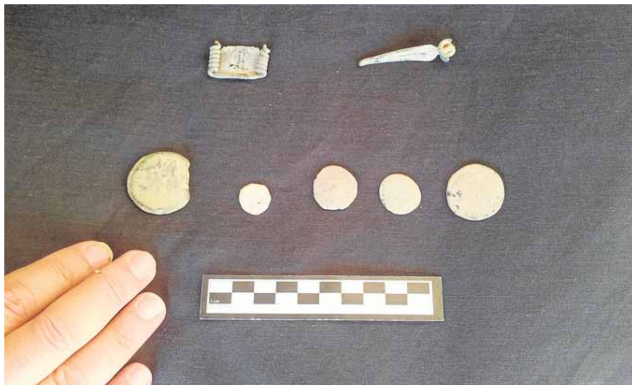
Parte de las piezas arqueológicas intervenidas, entre las que se cuentan monedas y partes de broches