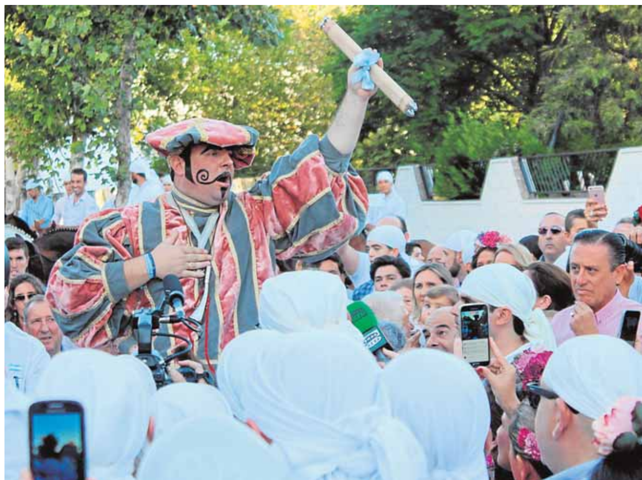
Momento en la Cruz de Caganche donde los pregoneros anuncian la ida de Setefilla a su ermita