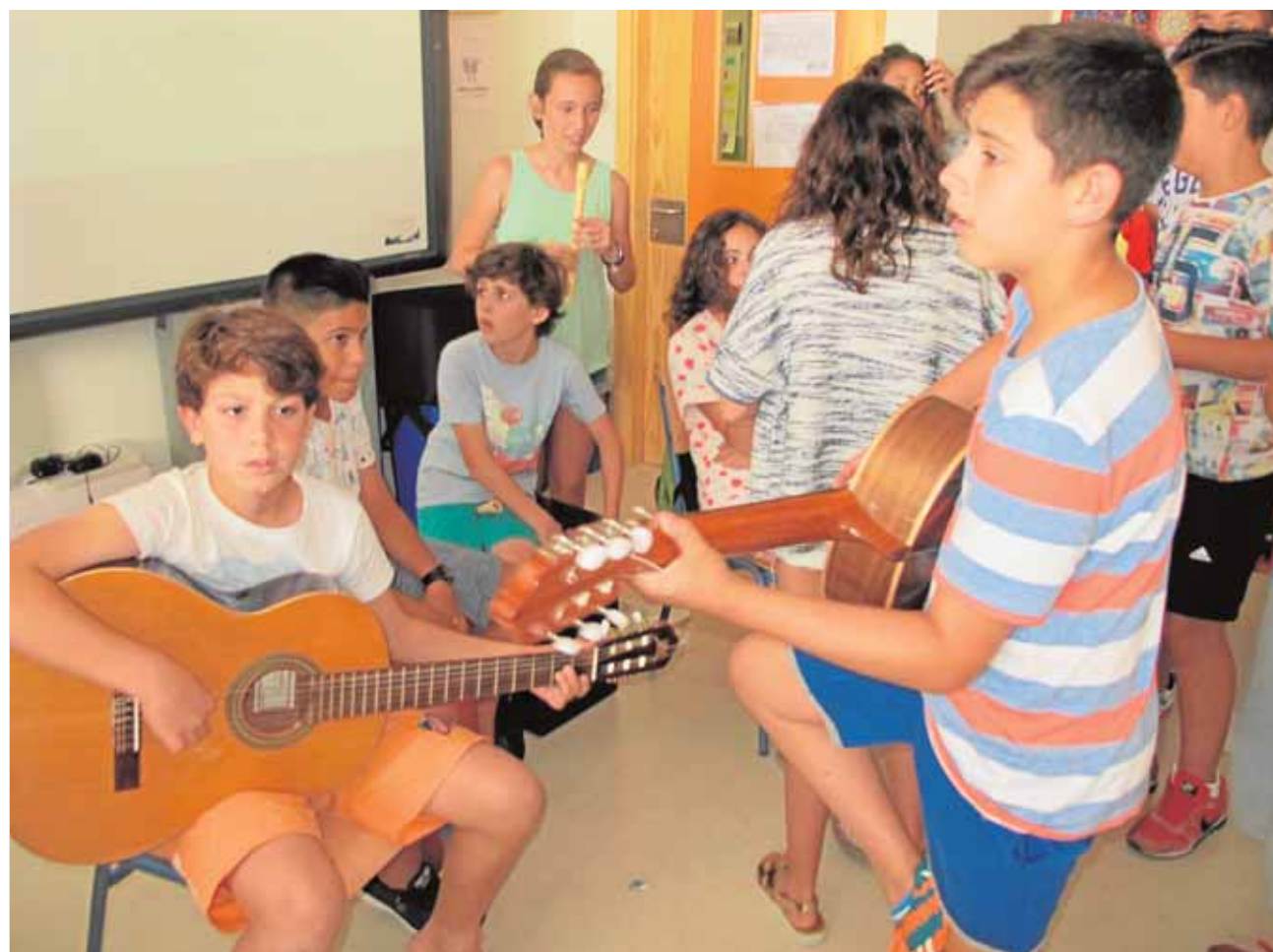
Alumnos del colegio público Nebrixa del curso escolar 2015/2016 en una de las clases del proyecto «Bordón»