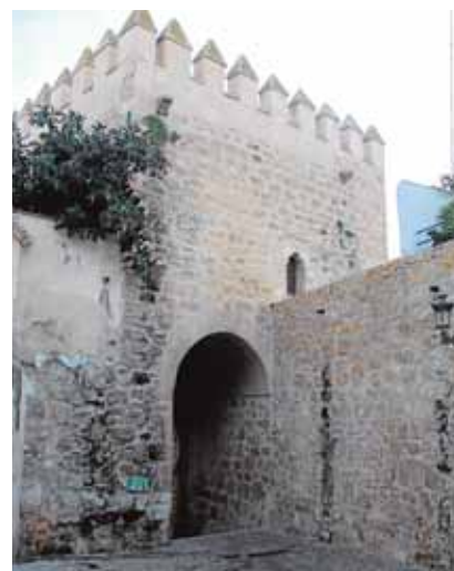
El Arco de la Rosa

Ante el éxito que tuvieron esas primeras jornadas, hoy ponen en marcha la II edición, con un variado programa de actividades que se extenderán hasta mediados de octubre, en el que se incluyen también exposicio-