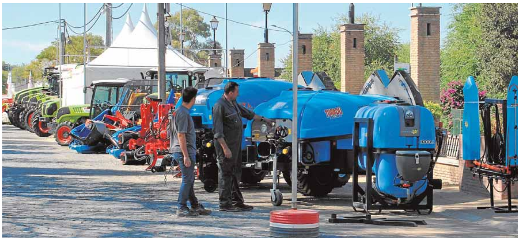
El recinto ferial de Carmona exhibe estos días los últimos avances técnicos en agricultura y ganadería

formativas en la localidad; el día 23 se celebrará una misa en San Pedro; el día 30 tendrá lugar un cuentacuentos sobre la enfermedad en la biblioteca municipal y el día 5 de octubre una conferencia en el Aula Universitaria Maese Rodrigo.