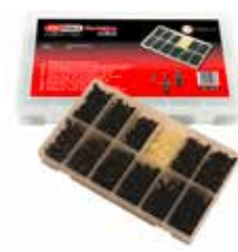
C23633 pour rivets détection