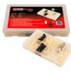
C23634 pour écrous plastiques