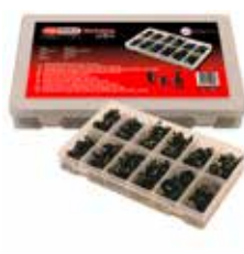
C23635 pour rivets à visser