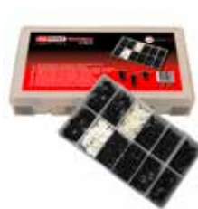
C23631 pour harnais de câbles