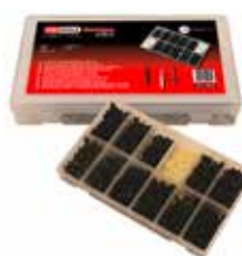
C23632 pour rivets plastiques